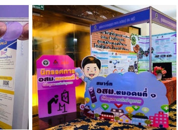
Hss show case โชว์ผลงานเด่น กรม สบส.