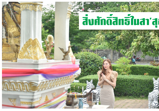
สิ่งศักดิ์สิทธิ์ในสา'สุข Ep.1 Ep.2