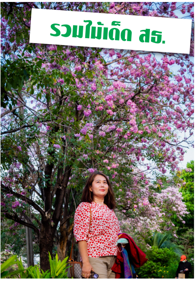
รวมไม้เด็ด สร.