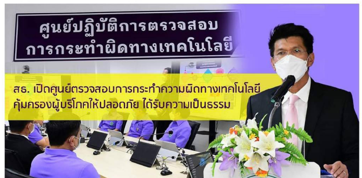
สธ. เปิดศูนย์ตรวจสอบการกระทำคามผิดทางเทคโนโลยี คุ่มครองผู้บริโภคให้ปลอดภัย ได้รับความเป็นธรรม

8. เปิดศูนย์ตรวจสอบการกระทำคามผิดทางเทคโนโลยี เผื่อระวัง สืบค้น และดำเนินคดีกับผู้กระทำความผิดที่ให้บริการสุขภาพและผลิตภัณฑ์สุขภาพไม่ได้มาตรฐาน คุ่มครองผู้บริโภคให้ปลอดภัย ได้รับความเป็นธรรม