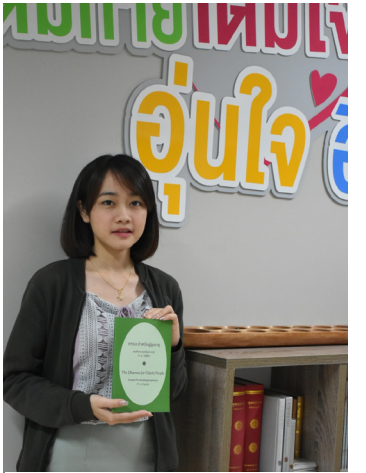
อึ้งท่าย อึ้งใจ อึ้งรัก