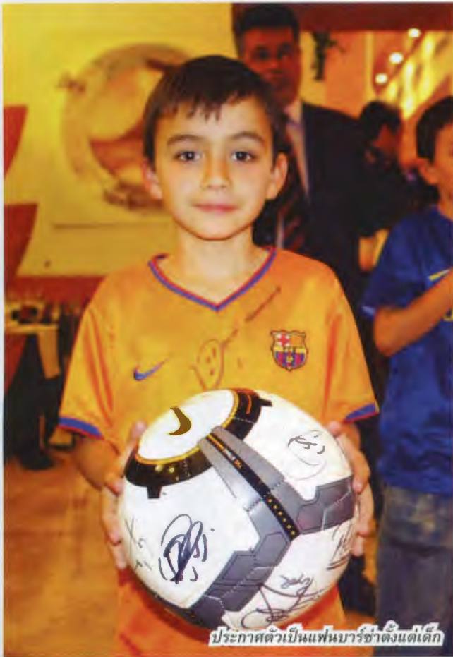
ประกาศตัวเป็นแฟนบาร์ซ่าตั้งแต่เด็ก