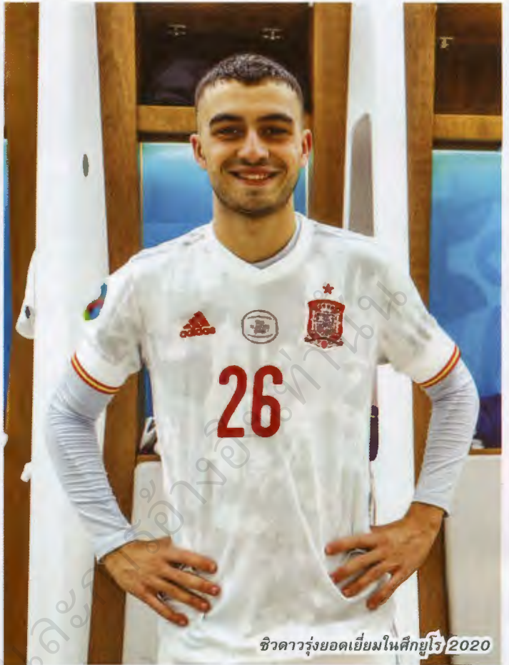
ชีวิตาวรุ่งยอดเยี่ยมในศึกยูโร 2020