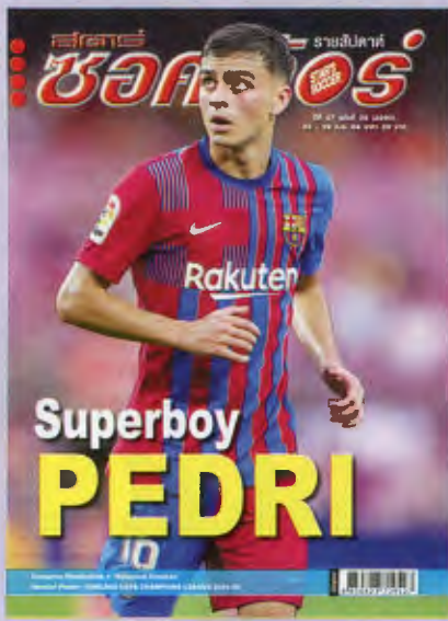
ภาพปก - เปดรี