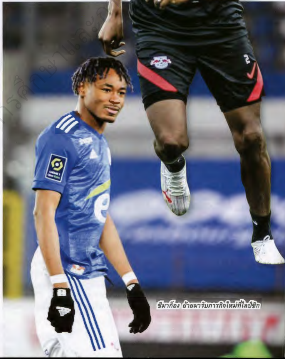
ชิมาก็อง ย้ายมารับภารกิจใหม่ที่ไลป์ซิก

ผมไม่ได้กดดันตัวเองมากนัก ปกติที่ผม อยากทำผลงานให้ดี มีนักเตะที่มาก่อนผม และจะมี คนที่มาต่อจากผม นักเตะพวกนั้นทำผลงานได้ดีกับ