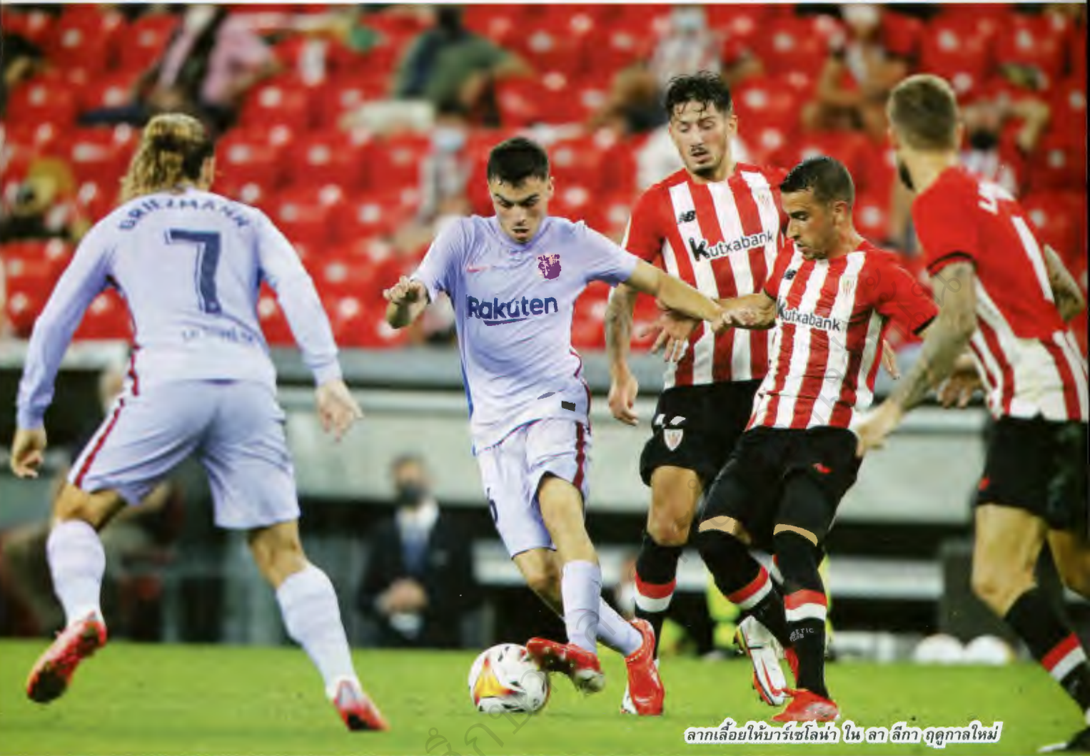
ลากเลื้อยให้บาร์เซโลน่า ใน ลา ลีกา ฤดูกาลใหม่