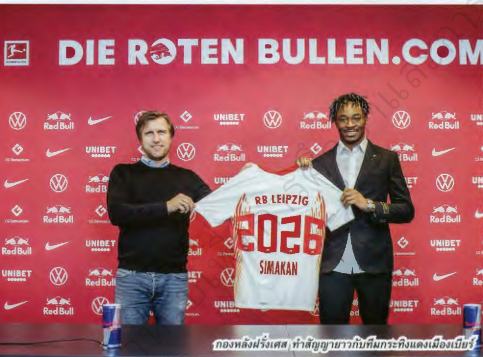
กองหลังฝรั่งเศส ทำสัญญายาวกับทีมกระทิงแดงเมืองเปียร์