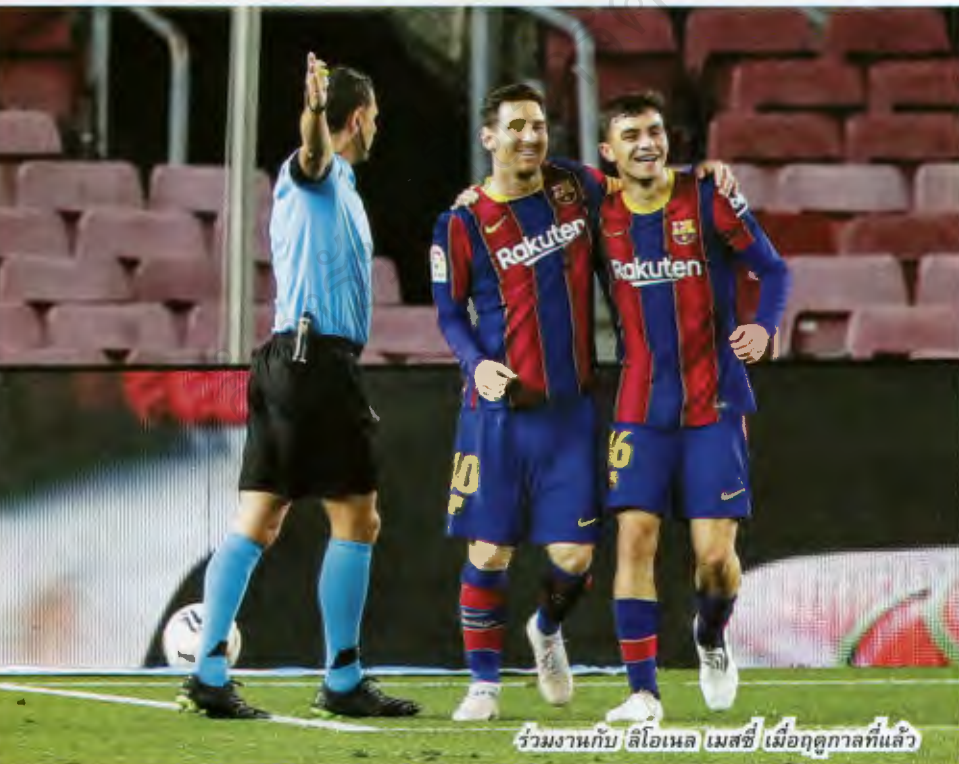
ร่วมงานกับ ลิโอเนล เมสซี เมื่อฤดูกาลที่แล้ว

เปเป้ เมล ก็รับฟังความเห็นของรูอาโน้ และลงเอยด้วยการเห็นด้วยหนักกว่า เปตรี ซึ่งเก็บตัวช่วงปรีซีซั่นกับลาส บัลมาส ชุดใหญ่ ไม่ได้กลับมาไปชุดเล็กอีกเลย และตอนนี้อย่าว่าแต่ชุดเล็กหรือชุดใหญ่ของลาส บัลมาส ฤดูกาล 2020/21 ที่ผ่านมา เขาลงเล่นในลา ลีกา ให้บาร์เซโลน่า ไป 37 นัด (3 ประตู) ต่อด้วยการเป็นตัวหลักของทีมชาติสเปนในศึกยูโร 2020 ที่เขากลายเป็นเจ้าของสถิติผู้เล่นอายุน้อยที่สุดที่ลงเล่นให้ลา โรฆา ในฟุตบอลชิงแชมป์แห่งชาติยุโรปด้วยวัยเพียง 18 ปี 6 เดือน กับอีก 18 วัน ตอนถูกส่งลงสนามในนัดเจอสวีเดน (0-0, 14 มิ.ย. 2021)