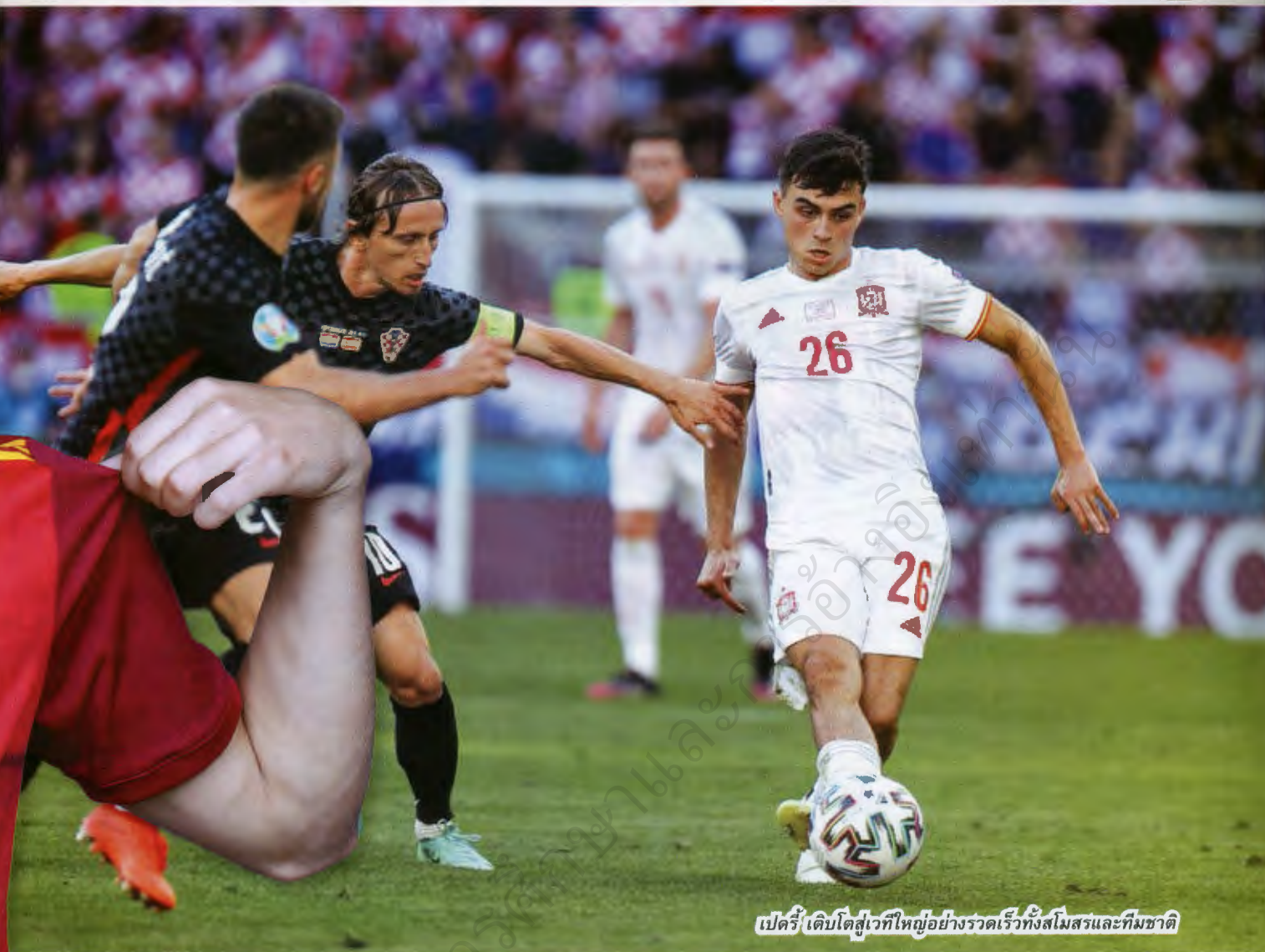
เปดรี เด็บโคสเวทียุ่อย่างรวดเร็วจนสโมสรและทีมชาติ

อาจแฉงเกิดที่บาร์เซโลนาไม่ได้ สองขาของเปดรีต้องใหญ่พอที่จะแบกรับความกดดันในการเป็นนักเตะบาร์เซโลนาด้วย