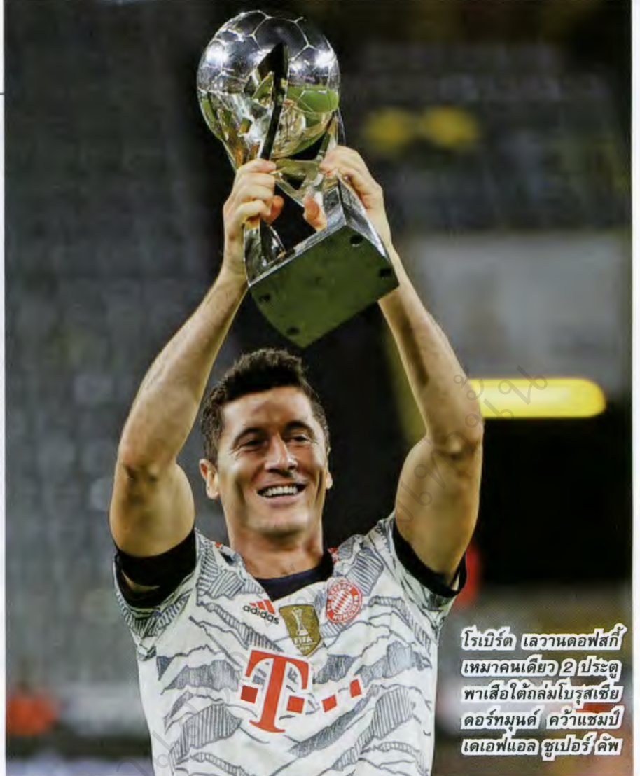
โรเบิร์ต เลวานดอฟสกี เหมาคนเดียว 2 ประตู พาเสือใต้ถล่มโบรุสเซีย ดอร์ทมุนด์ คว่ำแชมป์ เดเอฟแอล ซูเปอร์ คัพ

โบรุสเซีย ดอร์ทมุนด์ ทำท่ามาดีด้วยฟอร์มที่ร้อนแรงจัดจ้าน แต่ครั้งเมื่อมาเจอกับบาเยิร์น มิวนิค ในเกมแข่งขันสนามจริงศึกเดเอฟแอล ซูเปอร์คัพ ซึ่งเป็นการชนกันระหว่างแชมป์บุนเดสลีกา กับแชมป์เดเอฟเบ โพคาล ฤดูกาลล่าสุดนั้น ปรากฏว่าลูกทีมของเทรนเนอร์ มาร์โค โรเซ่ พยายามที่จะบุกกดดันตั้งแต่ต้น แต่ก็ไม่สามารถฝ่าแนวป้องกันที่เทรนเนอร์ ยูเลียน นาเกิลส์มันน์ ชิงตักนั้นได้ แถมยังมีจุดผิดพลาดที่ทำให้ทีมเสือใต้มีโอกาสเข้ายิงประตู และ โรเบิร์ต เลวานดอฟสกี เหมายิงคนเดียว 2 ประตู เดิมอีก 1 ประตู ของ โรมัส มุลเลอร์ ซึ่งก็ได้โอกาสจากการแฮตทริกของ โรเบิร์ต เลวานดอฟสกี นั้นเช่นเดียวกัน จึงกลายเป็น 3 ประตู ที่โบรุสเซีย ดอร์ทมุนด์ ไม่สามารถที่จะแก้ไขสถานการณ์กลับมาได้ แม้ว่า มาร์โค รอยส์ กัปตันทีม จะยิงประตูสุด