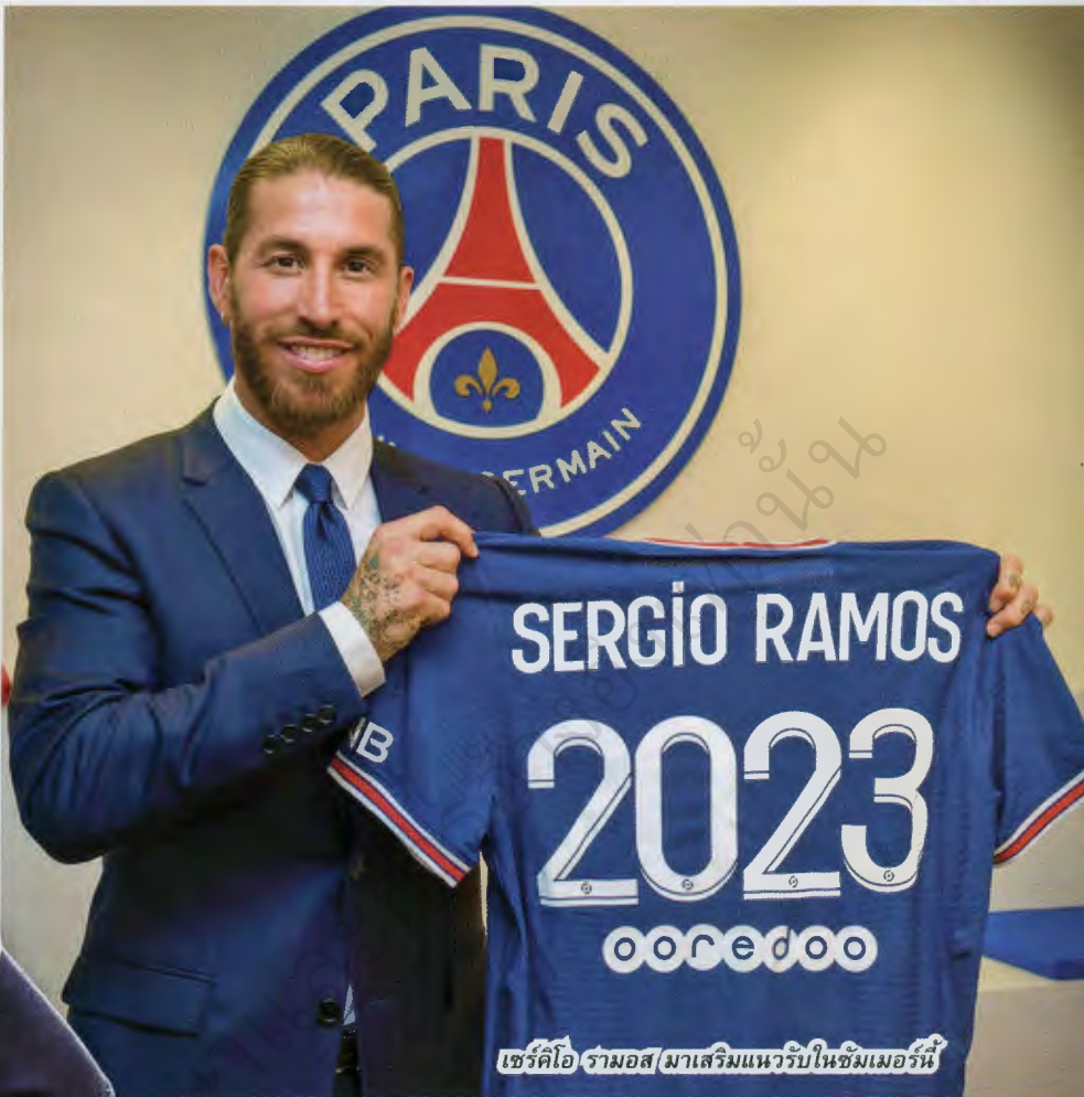
เซร์คิโอ รัมอส มาเสริมแนวรับในซิมเมอร์นี่

จนกระทั่งปีต่อมา เขาได้เซ็นสัญญาถาวรกับสโมสร ในราคาค่าตัว