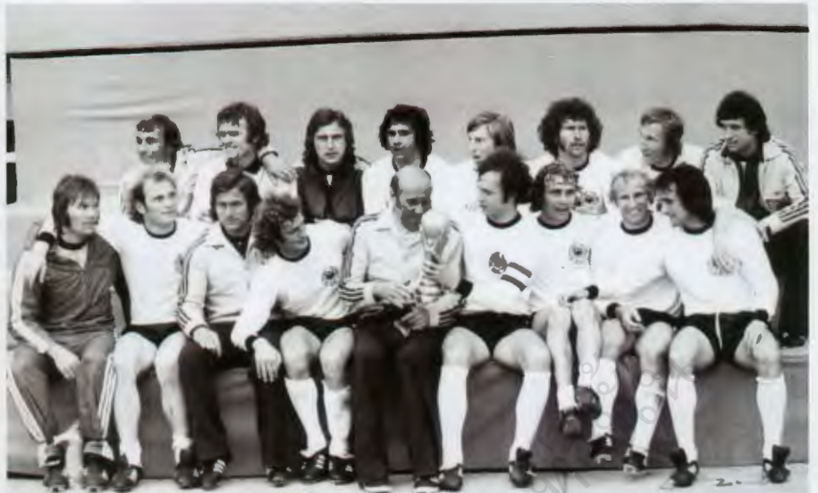
แกร์ด มุลเลอร์ (แถวหลัง) คี้นแมนในชุดแชมป์โลก 1974

เช่นเดียวกับบุคคลที่ให้ความหมายของแกร์ด มุลเลอร์ ผู้จากไปได้อย่างชัดเจนที่สุด เขาผู้นั้นคือ “แดร์ โทเซอร์” ฟรันทซ์ เบ็คเคนบาเออร์ เพื่อนร่วมทีมที่อยู่เคียงข้างกันเกือบตลอดเส้นทางความสำเร็จทั้งสโมสรและทีมชาติ “ถ้าไม่มี แกร์ด มุลเลอร์ เอฟซี บาเยิร์น มิวนิคของเราคงไม่มีทุกวันนี้ หากไม่มี แกร์ด เรายังคงนั่งอยู่ในกระท่อมน้อยที่แซเบเนอร์ สตราสเซ่ ดังเช่นที่เราเริ่มต้นในปี 1960 นั่นละ”