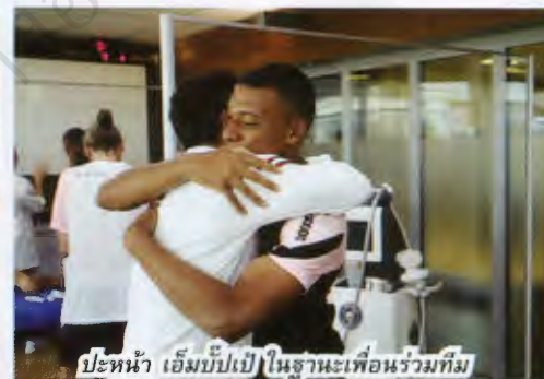
ปะหน้า เอ็มบีเป่ ในฐานะเพื่อนร่วมทีม

การแยกทางของเมสซี่จึงยังไม่ใช้ทางออกสุดท้ายของปัญหา ทว่าเป็นเพียงหนึ่งในทางแก้ไข วิกฤติการเงินของสโมสรที่มีหนี้สินถึง 1.35 พันล้านยูโร หลังกลั่นใจตัดเมสซี่ ออกจากวงโคจรไป โจน ลาปอร์ตา ยังต้องหาทางขายนักเตะในทีมอีกหลายคน รวมถึงต่อรองเพื่อขอลดเงินเดือนนักเตะที่เป็นแกนนำของทีม รับค่าเหนื่อยแพง ๆ ทั้งหลายต่อไป มิฉะนั้นจะลงทะเบียนนักเตะใหม่ไม่ได้ด้วย