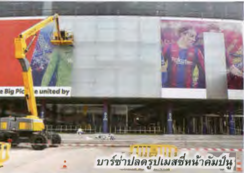
บาร์ซ่าปลดรูปเมสซีหน้าคิมป์นู