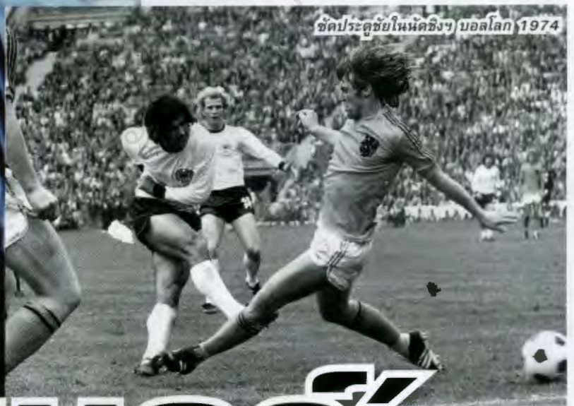
ชดประตูลูกชัยในนัดชิงฯ บอลโลก 1974