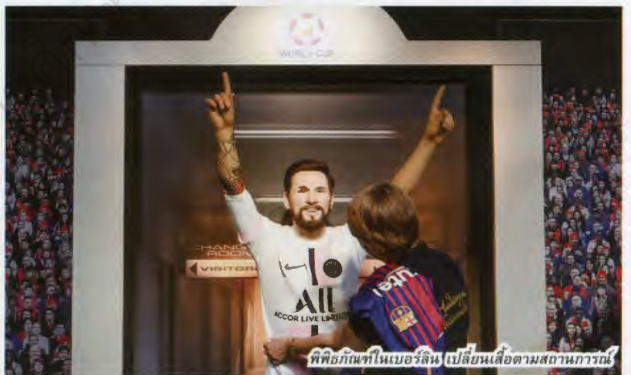
ทิ่อกันทีในเบอร์ลิน เปลี่ยนเสื้อตามสถานการณ์

ความคึกคักบังเกิดแก่สาวกปารีสเซียงอย่างต่อเนื่องตั้งแต่ที่ได้เห็น อาซาราฟ ฮาคิมิ, จอร์จินโญ ไวนัลดูม, เซร์คิโอ รามอส กับ จานลุยจิ ดอนนารุมมา พาเหรดกันมาเปิดตัวในฐานะผู้เล่นใหม่ของเปแอสเช เทียบเป็นการติดอาวุธ ทั้ง 4 คืออาวุธ