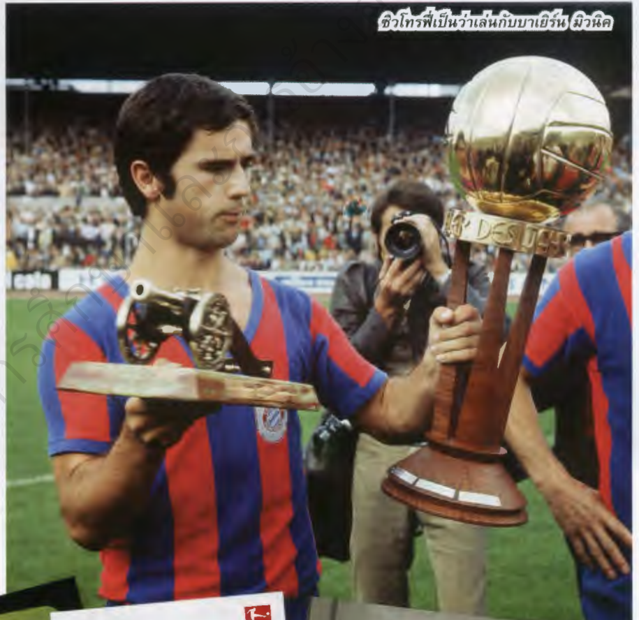
ชีวิตโรพีเป็นว่าเล่นกับบาเยิร์น มิวนิค