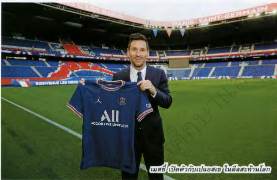
เมสซี เปิดตัวกับเปแอสเช ในดิลสะทั่วโลก

ใหญ่อย่าง CNN ของสหรัฐฯ ซึ่งไม่ใช่ชาติที่กีฬา “ซอคเกอร์” เป็นอันดับหนึ่ง ก็ขึ้นเบรกถึง นิวส์ และรายงานการย้ายทีมของเขาเช่นกัน