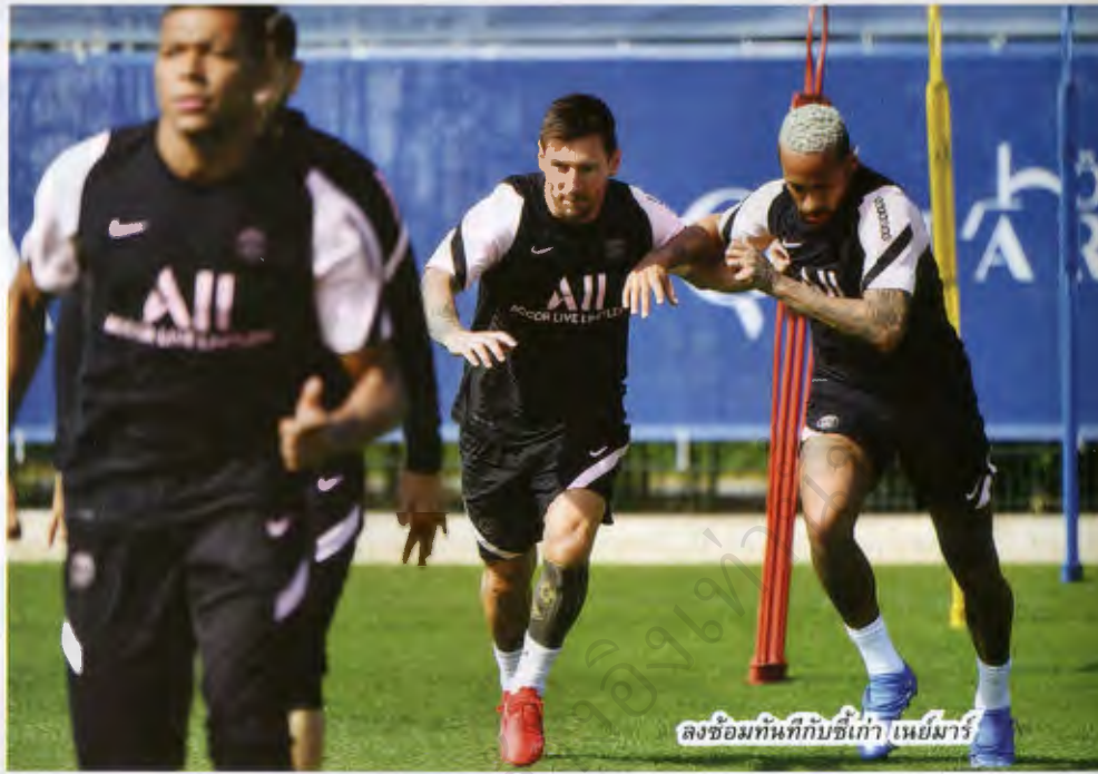
ลงซ้อมทันทีกับซีเกา เนย์มาร์

“ผมมีความสุขมากและภูมิใจมากที่ได้มานะนำ เลโอ เมสซี สู่เปแอสเช” อัล-เคลฟี กล่าวเปิดงานแถลงข่าว “มันเป็นวันที่เหลือเชื่อวันประวัติศาสตร์สำหรับสโมสร สำหรับโลกฟุตบอลเป็นช่วงเวลามหัศจรรย์ ทุกคนรู้จักเขาดี เขาเป็นผู้เล่นคนเดียวที่ได้บัลลง คอว์ 6 ครั้ง เขาทำให้