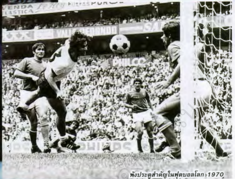
ทั้งประตูสำคัญในฟุตบอลโลก 1970