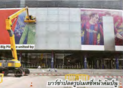
บาร์ซ่าปลดรูปเมสซีหน้าคัมป์นู