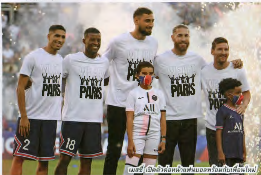
เมสซี่ เปิดตัวต่อหน้าแฟนบอลพร้อมกับเพื่อนใหม่