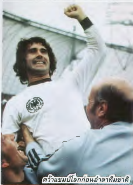
คว้าแชมป์โลกก่อนอำลาทีมชาติ