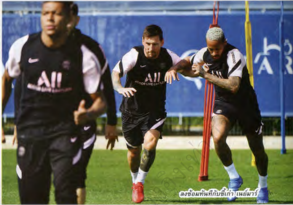
ลงซ้อมทันทีกับซีเกา เนย์มาร์

“ผมมีความสุขมากและภูมิใจมากที่ได้มานะนำ เลโอ เมสซี ซูเปออสเซ” อัล-เคไลฟี กล่าวเปิดงานแถลงข่าว “มันเป็นวันที่เหลือเชื่อ วันประวัติศาสตร์สำหรับสโมสร สำหรับโลกฟุตบอล เป็นช่วงเวลามหัศจรรย์ ทุกคนรู้จักเขาดี เขาเป็นผู้เล่นคนเดียวที่ได้บัลลง ดอร์ 6 ครั้ง เขาทำให้