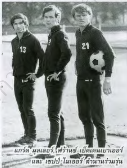
แกร์ด มุลเลอร์, เฟรานซ์ เบ็คเคนเบาเออร์ และ เซปป์ ไมเออร์ ตำนานร่วมรุ่น