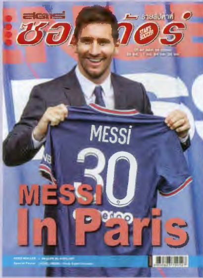
ภาพปก - ลิโอเนล เมสซี