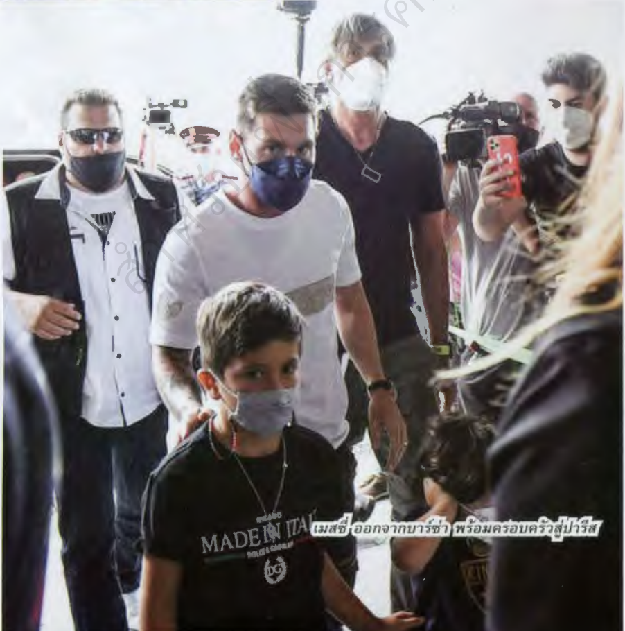
เมสซี ออกจากบาร์ซ่า พร้อมครอบครัวสู่ปารีส

และสมาชิกใหม่ของครอบครัวเปแอสเชก็เปิดเผยว่า “ผมมีความสุขมาก ทุกคนรู้ว่าการออกจากบาร์เซโลน่าของผมมันหนักแค่ไหน เป็นเรื่องยากต่อการคิดถึงเปลี่ยนแปลงหลังระยะเวลาอันยาวนาน แต่ยังไม่ทันมาถึงที่นี่ผมก็มีความกระตือรือร้นมากแล้ว”