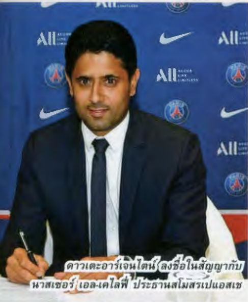
ดาวเตะอาร์เจนไตน์ ลงชื่อในสัญญาฉบับใหม่กับสโมสร ปารีส แซงต์-แชร์กแมง

เมสซีก็ยังรักอยู่ เข้าสู่ “ยุคหลังเมสซี” โดยไม่มีใครทันตั้งตัวทั้งสิ้น