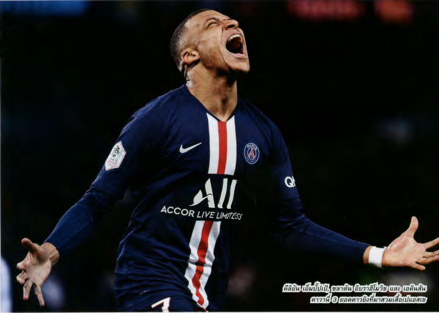
คิลิยัน เอ็มเบปเป้, ซลาตัน อิบราฮิโมวิช และ เอเดนสัน คาวานี่ 3 ยอดดาวยิงที่มาสวมเสื้อเปแอสเช

เมสซี มีสัญญากับ เปแอสเช จนถึงวันที่ 30 มิถุนายน 2023 เจ้าตัวจะได้รับเงินค่าเหนื่อย 35 ล้านยูโรต่อปี (ประมาณ 1,365 ล้านบาท) โดย