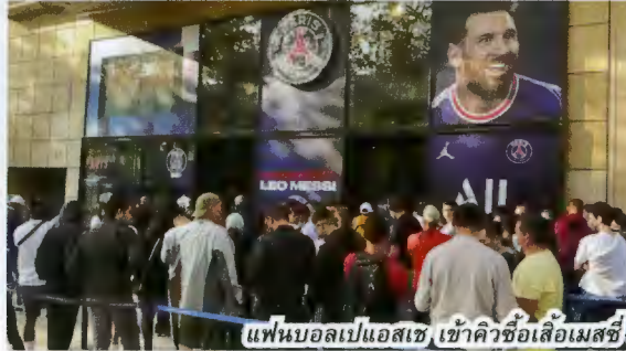
แฟนบอลเปแอสเช เข้าคิวซื้อเสื้อเมสซี

ในทางตรงกันข้าม สิ่งที่เกิดขึ้นเหมือนความผันที่หวานสุด ๆ กลางฤดูร้อนสำหรับกองเชียร์ปารีสแซงต์-แชร์กแมง ที่ตื่นเต้นไปจนถึงแตกตื่นกับการมาแห่งปรากฏการณ์