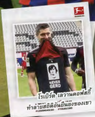
โรเบิร์ต เลวานดอฟสกี ทำลายสถิติอันยิ่งใหญ่ของเขา