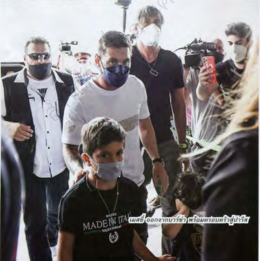
เมสซี ออกจากบาร์ซ่า พร้อมกับครอบครัวสู่ปารีส