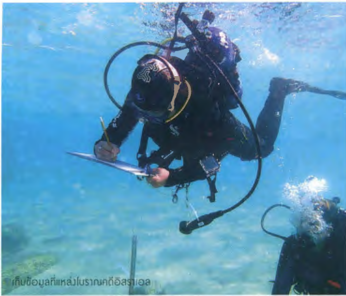
เก็บข้อมูลทะเลในโบราณคดีอิสราเอล