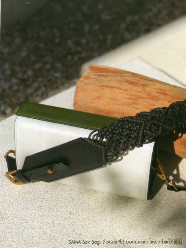
SAMA Box Bag: กล้วยไม้ที่ปลูกออกมาและขายหมดตัวเกือบสิบล้าน