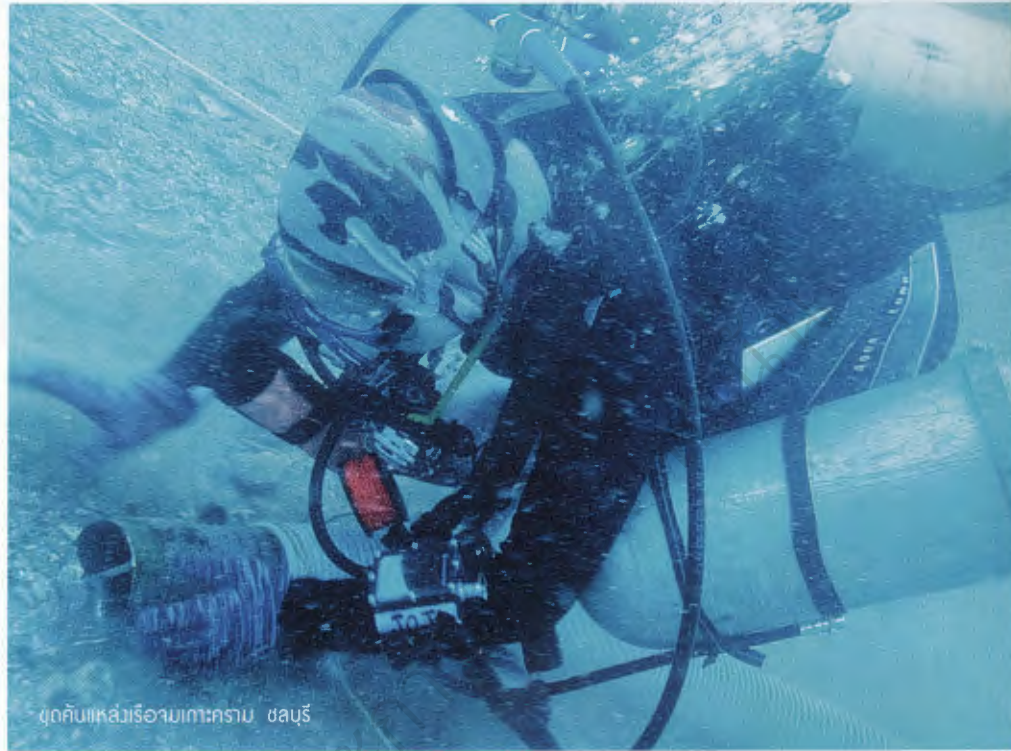
ผูกกับแห่เรืออวกาศโบราณ ชลบุรี

เมื่อใจรักและทุ่มเทหาความรู้เต็มที แต่เส้นทางสู่การเป็นนักโบราณคดีได้นำ