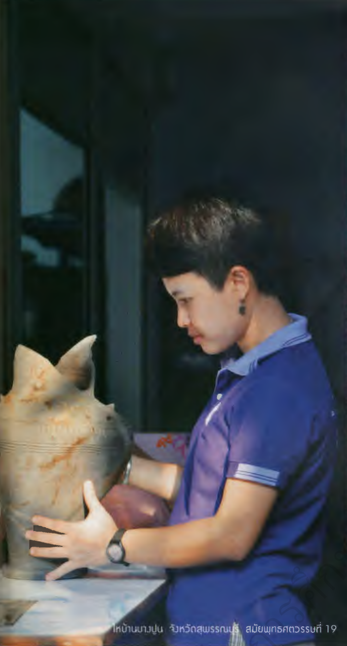
โหลบ้านบางปูน จังหวัดสุพรรณบุรี สมัยพุทธศตวรรษที่ 19