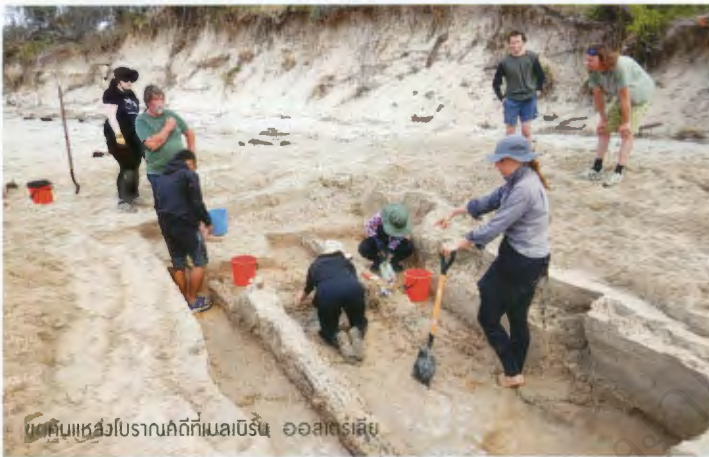
ขุดค้นแหล่งโบราณคดีที่เมลเบิร์น ออสเตรเลีย

“นักโบราณคดีจึงเป็นทั้งนักสืบและนักต่อจิ๊กซอว์ เพราะนักโบราณคดีหนึ่งคนไม่สามารถขุดค้นได้หมดทั้งโลก แต่นักโบราณคดีทั่วโลกจะนำจิ๊กซอว์แต่ละตัวที่ต่างคนต่างพบมาต่อกันจนออกมาเป็นภาพใหญ่ เช่น ที่ผ่านมามีเอกสารทางประวัติศาสตร์เขียนไว้ชัดเจนว่ายุครุ่งเรืองด้านการค้ามาก ๆ มีการแล่นเรือสำเภาขายของป่าและส่งออกเครื่องถ้วยไทยไปต่างประเทศ แต่เราไม่มีวัตถุเป็นหลักฐาน เราเจอแต่ของบนบก ไม่เจอในน้ำ จนวันหนึ่งที่เราไปพบเรือครามเมื่อปี พ.ศ. 2517 ซึ่งในนั้นก็มีทุกสิ่งทุกอย่างที่ยืนยันข้อมูลทางประวัติศาสตร์ ทั้งเครื่องถ้วยไทย อุปกรณ์การกินอาหารของคนเรือ ทำให้มีภาพใหญ่ขึ้นมาครบว่าเรามีทั้งของต้นทาง คือเครื่องถ้วย ณ แหล่งผลิต มีของกลางทางเป็นเครื่องถ้วยที่อยู่ในเรือจมกลางทะเล และมีของปลายทาง คือมีการพบเครื่องถ้วยไทยที่ฟิลิปปินส์และอินโดนีเซีย แสดงให้เห็นว่าเราทำการค้าขายกับประเทศในภูมิภาคนี้ เป็นต้น