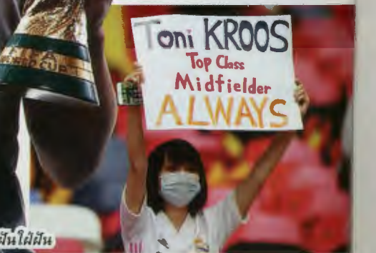
โครส (และแชมป์ฟุตบอลโลกที่ทุกฝืนฝืน)