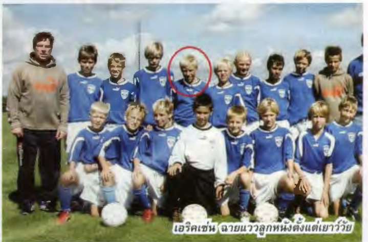
เอริกเซน ฉายแววลูกหนังตั้งแต่วัยวัย