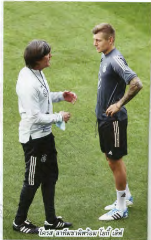
โครส ลาทีมชาติพร้อมโยก เลิฟ

"ผมอยากจะขอบคุณ โทนี่ สำหรับช่วงเวลาอันแสนวิเศษนี้ ผมเข้าใจกับการตัดสินใจของเขา แต่