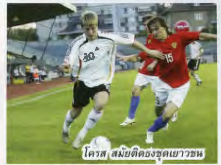
โครส สมัยติดธงชุดเยาวชน

การจากไปของ โครส ทำให้ อันซี ฟลิค สามารถมอบโอกาสให้กับพลัดงานคลื่นลูกใหม่ที่