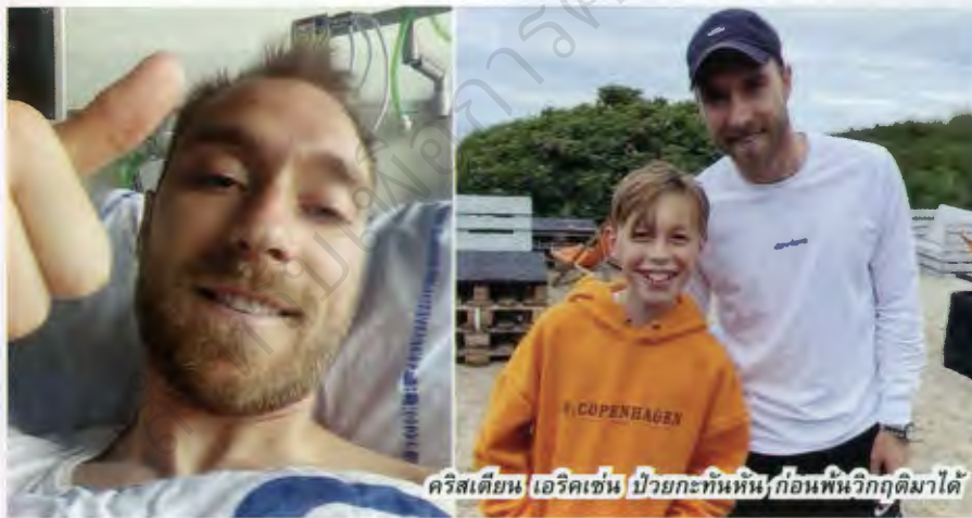
คริสเตียน เอริกเซ่น ป่วยกะทันหัน ก่อนพันวิฤตมาได้

12 มิ.ย. 21) ซึ่งเกิดขึ้นในวันที่สองของทัวร์นาเมนต์ยูโร 2020 เท่านั้น ถือเป็นเรื่องชวนช็อก ไม่เฉพาะแต่สำหรับผู้คนในโลกลูกหนัง และมันยังทำให้ทุกสิ่งที่เกี่ยวข้องกับเขาเป็นที่สนใจไปหมดรวมไปถึงมิดเดิลฟาร์ท เมืองเล็กๆ ทางตะวันออกริมฝั่งเกาะฟูเน่น หรือเกาะฟินในภาษาเดนิช ซึ่งเป็นเมืองบ้าน