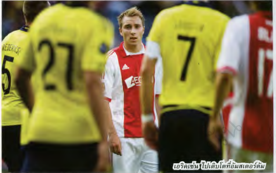
เอริกเซน ไปเคปโตที่อัมสเตอร์ดัม

คริสเตียน เอริกเซน ไปต่อที่ไอนด์เฮงส์ (2005-2009) ตอนอายุ 13 ขวบ จากนั้นเขาข้ามมาโตในวงการฟุตบอลดัตช์กับอะคาเดมี่ของอาแจกซ์ อัมสเตอร์ดัม ซึ่งขึ้นชื่อเรื่องการปั้นนักฟุตบอลอยู่แล้ว เขายู่ในศูนย์ฝึกเยาวชนของอาแจกซ์ 2 ปีก่อนขึ้น