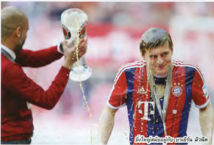
ยิ่งใหญ่สมัยอยู่กับ บาเยิร์น มิวนิค