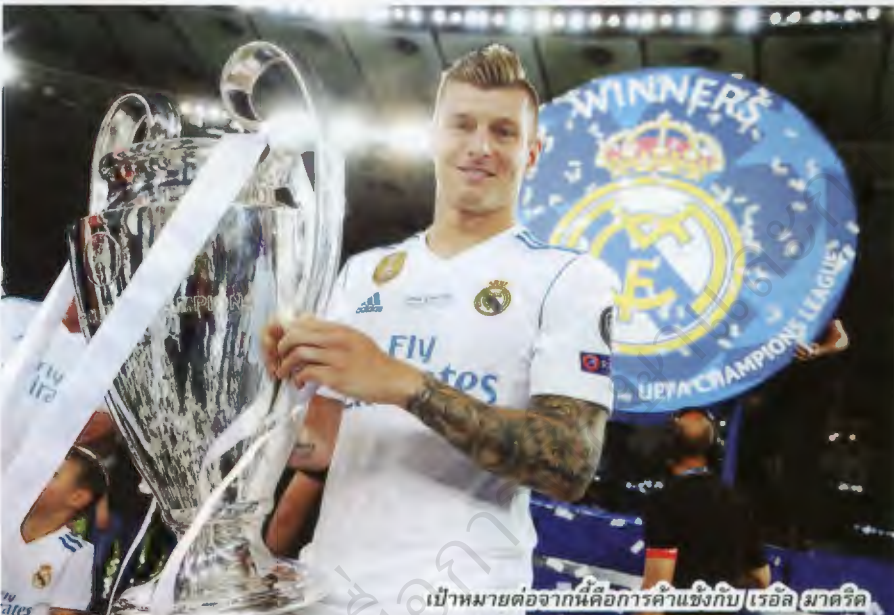
เป้าหมายต่อจากนี้คือการค้าแข้งกับ เรอัล มาดริด

ผมก็อดเสียตายไม่ได้ เพราะ โทนี โครส ถือนักเตะที่ยิ่งใหญ่ ที่กำลังจะอำลาทีมชาติไปแล้ว”