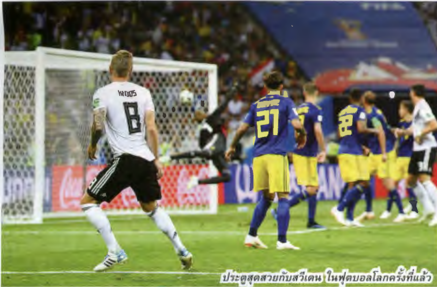
ประตูล่าสุดสวยกับสวีเดน ในฟุตบอลโลกครั้งที่แล้ว

เกม และแชมป์ใหญ่รายการนั้น, ยูโรเปียน แชมป์เป็นชีพ ควรถูกเติมเต็มเข้ามา ผมตัดสินใจที่จะเลิกเล่นหลังทัวร์นาเมนต์นี้มานานแล้ว ผมชัดเจนกับตัวเองว่า ผมจะไม่เล่นทัวร์นาเมนต์ที่ กาดาร"