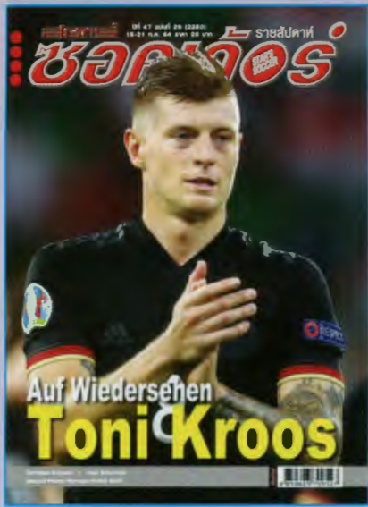
ภาพปก - โทนี โครส