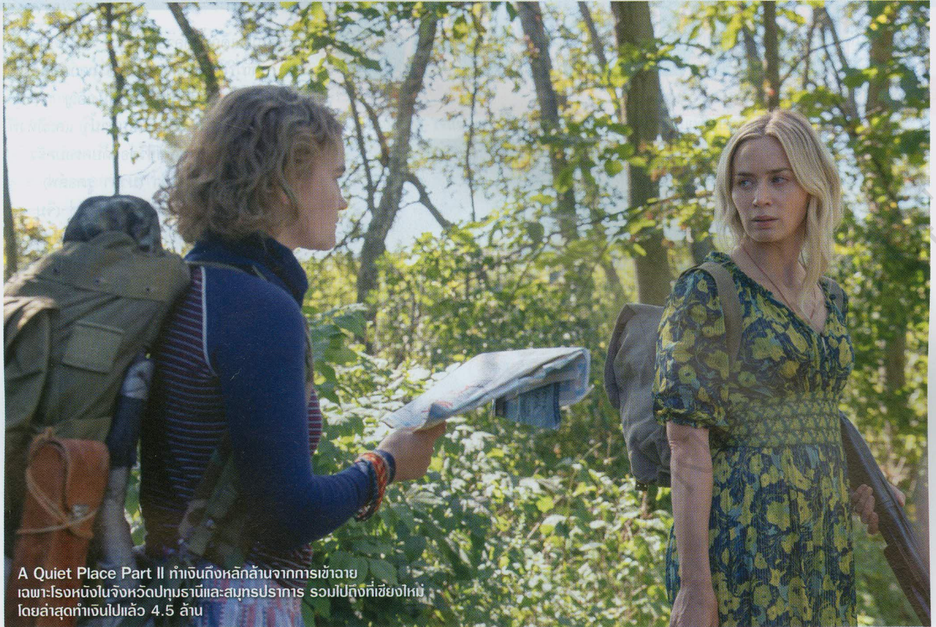
A Quiet Place Part II ทำเงินถึงหลักล้านจากการเข้าฉาย เฉพาะโรงหนึ่งในจังหวัดปทุมธานีและสมุทรปราการ รวมไปถึงที่เชียงใหม่ โดยล่าสุดทำเงินไปแล้ว 4.5 ล้าน