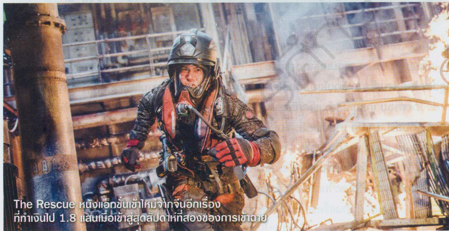
The Rescue หนึ่งแอ็กชันเข้าใหม่จากจีนอีกเรื่อง ที่ทำเงินไป 1.8 แสนเยื่อเข้าสู่สตูดิโอเก่าที่สองของกาสิโน

ที่มันควรจะเกินกว่า 10 ล้านไปแล้ว ก็เลยกลายเป็นอย่างที่เห็น โดยที่ทำอะไรไม่ได้มากไปกว่าต้องยอมรับในชะตากรรมของหนังเรื่องนั้นๆกันไป เพราะถ้าคิดที่จะเข้าฉายในช่วงเวลาที่สถานการณ์ยังไม่เป็นปกติแบบนี้ แกรมส์สอเค้าว่าจะมีแต่หนักขึ้น ก็คงต้องเผื่อใจล่วงหน้าในเรื่องของรายได้ไว้ก่อนเลย เพราะหนังไม่มีทางทำเงินเหมือนตอนที่สถานการณ์เป็นปกติซักร้อยยี่กว่าซักร้อยสำหรับหนังเข้าใหม่ที่เพิ่งเข้าฉายเป็นครั้งแรก นอกจาก A Quiet Place Part II แล้วก็ยังยี่มี The Rescue หนึ่งแอ็กชันจาก