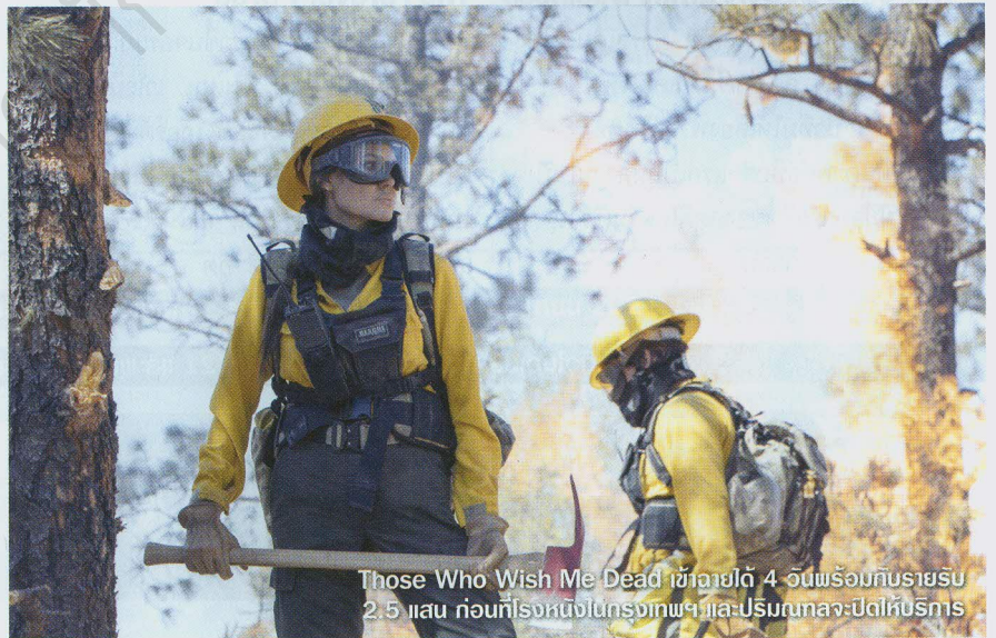
Those Who Wish Me Dead เข้าฉายได้ 4 วันพร้อมกับรายรับ 2.5 แสน ก่อนที่โรงหนังในกรุงเทพฯ และปริมณฑลจะปิดให้บริการ

โดยที่ถึงแม้ตัวเลขรายได้ของทั้งสาม สัปดาห์ในนี้ที่จะมาจากการเข้าฉายใน โรงหนังเขตปริมณฑลสองจังหวัดคือปทุมธานี และสมุทรปราการ รวมไปถึงที่เชียงใหม่ แต่เพียงเท่านั้น ส่วนโรงหนังในกรุงเทพฯ และ นนทบุรียังคงไม่ได้รับการปลดล็อกยาว แต่ก็ ยังมีหนังที่ทำรายได้ถึงหลักล้าน ถึงจะมีอยู่แค่ เรื่องเดียว ซึ่งก็เป็นทางด้านของหนังดราม่า สยองขวัญไซ-ไฟภาคต่อที่หลายคนรอดอย A Quiet Place Part II ที่เข้าฉายในสัปดาห์ แรก 17-20 มิ.ย. พร้อมกับรายรับราว 2.5