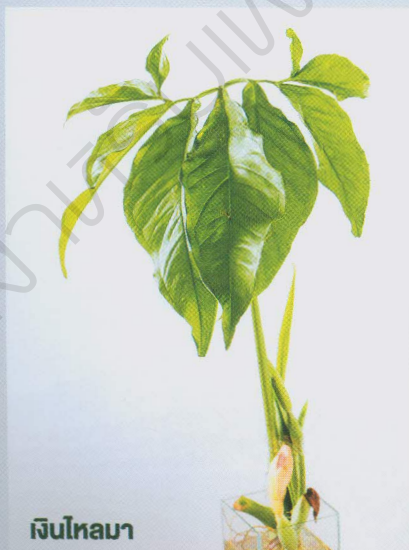
เงินไหลมา