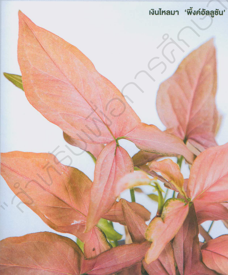
เงินไหลมา 'พังก์อัลลูชัน'

เงินไหลมา 'พังก์อัลลูชัน' หรือ ออมนาค ชื่อวิทยาศาสตร์ว่า S. podophyllum 'Pink Allusion' แผ่นใบสีชมพู