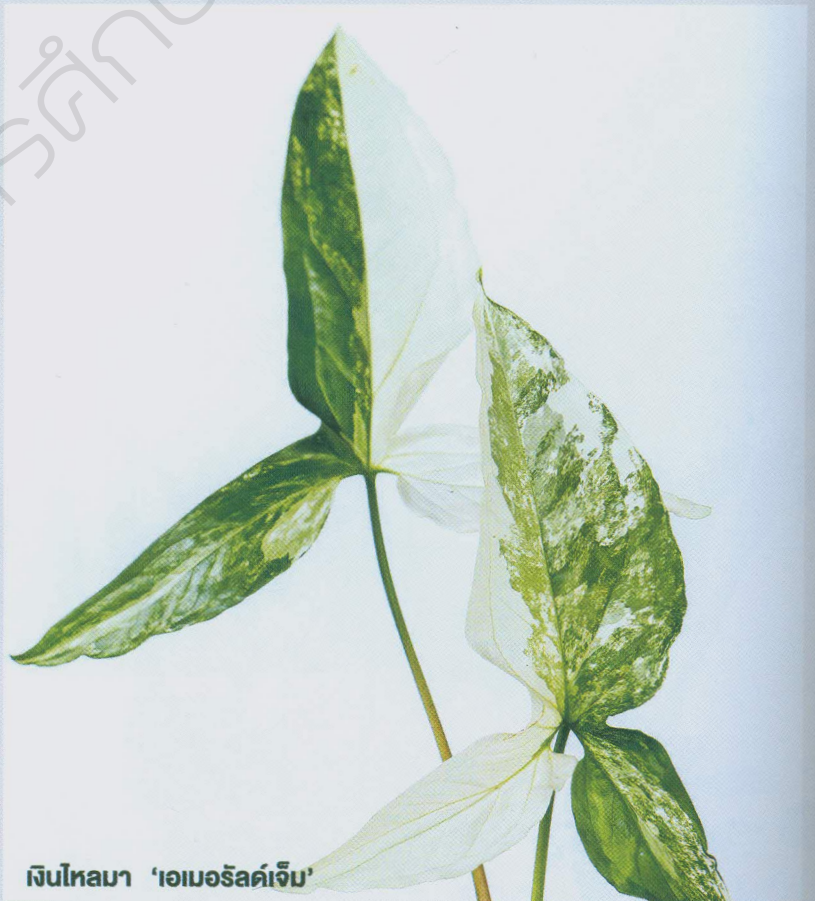
เงินไหลมา 'เอมอริลด์จีบ'