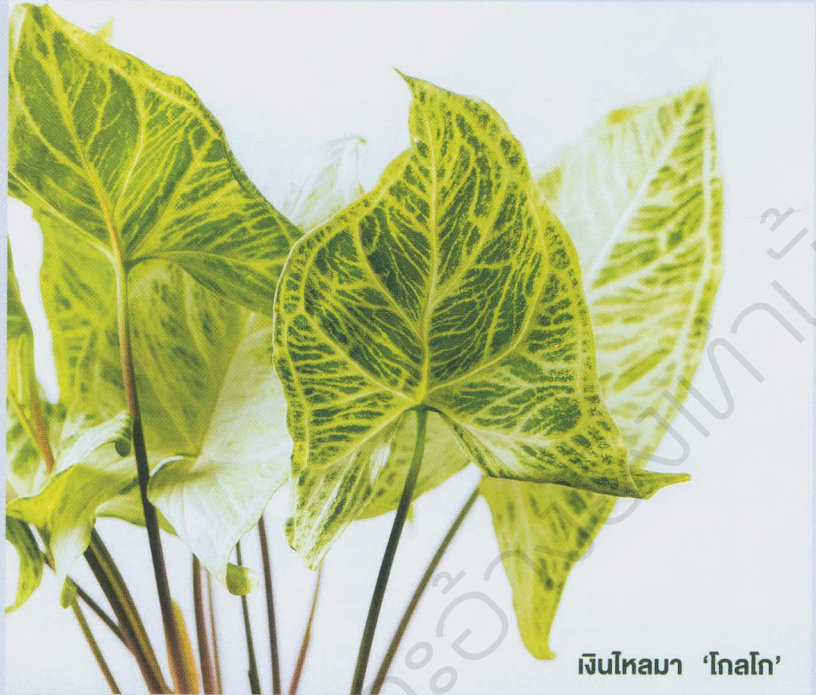
เงินไหลมา 'ไกลโก'

เงินไหลมา 'เอมอรัลด์เจม' หรือ ทองไหลมา ชื่อวิทยาศาสตร์ว่า S. podophyllum 'Emerald Gem' แผ่นใบสีเขียวอ่อนถึงเขียวเข้ม มีด่างสีขาว