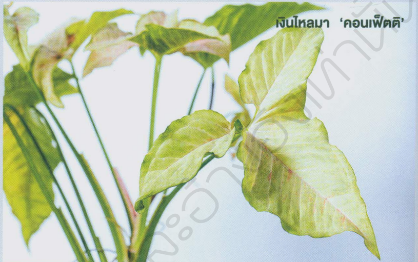
เงินไหลมา 'คอนเฟ็ตตี'

เงินไหลมา ชื่อวิทยาศาสตร์ว่า Syngonium podophyllum Schott เป็นชิงโกเนียมชนิดแรกๆ ที่นำมาปลูกประดับ เมื่อยังเล็กใบรูปหัวใจ ปลายใบเรียว เมื่อโตเต็มที่ใบหักเว้าเป็นรูปฝ่ามือ แผ่นใบใหญ่กว่า 30 เซนติเมตร ทนแสงแดดจัดได้