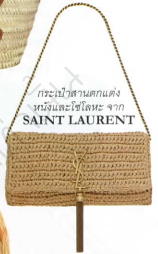
กระเป๋าสานตกแต่ง หนังและโซลิตะ จาก SAINT LAURENT