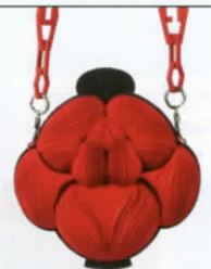
กระเป๋าสะพายขึ้นรูป ด้วยเทคนิคการพิมพ์ 3 มิติ จาก JULIA DAVIY