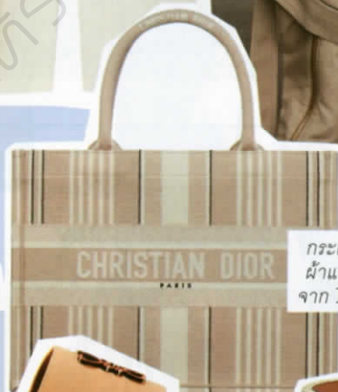
กระเป๋าสาน ผ้าแคนวาส จาก DIOR