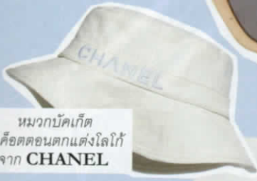
หมวกบักเก็ต ผ้าคอตตอนตกแต่งโลโก้ จาก CHANEL