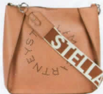
กระเป๋าครอบสบอดีหนังสังเคราะห์ สายสะพายวัสดุรีไซเคิล จาก STELLA McARTNEY