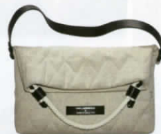
กระเป๋าครอบสบอดี ผ้ารีไซเคิลตกแต่งเชือก จาก KARL LAGERFELD