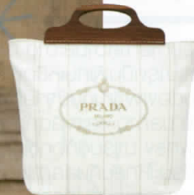
กระเป๋าคanvas ตกแต่งหูจับไม้ จาก PRADA