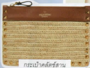
กระเป๋าคลัทช์สาน ตกแต่งหนังและหมุดโลหะ จาก VALENTINO