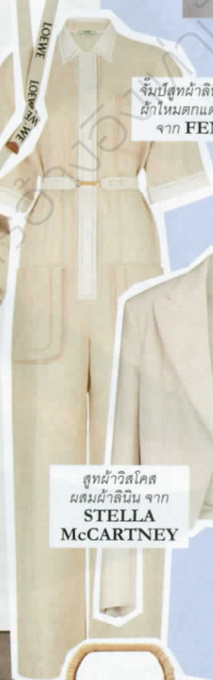
สูทผ้าวิสโคส ผสมผ้าลินิน จาก STELLA McCARTNEY