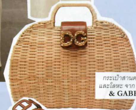
กระเป๋าสานตกแต่งหนังและโลหะ จาก DOLCE & GABBANA