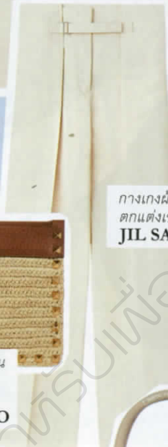
กางเกงผ้าคอตตอน ตกแต่งเข็มขัด จาก JIL SANDER