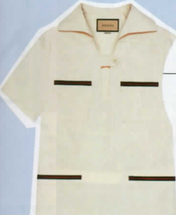
ชุดกระโปรงผ้าคอตตอน ตกแต่งริบบิ้นและป้ายโลโก้ จาก GUCCI