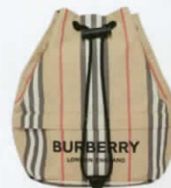
กระเป๋าควอร์ตสตรีนผ้าไนลอน รีไซเคิล Econyl ทอลายตาราง จาก BURBERRY