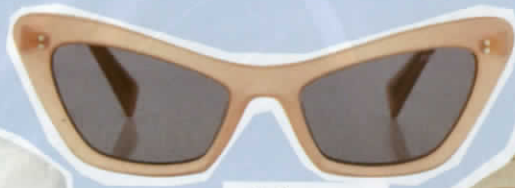
แว่นกันแดด จาก MIU MIU