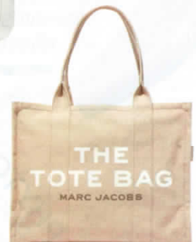
กระเป๋าคanvas จาก MARC JACOBS