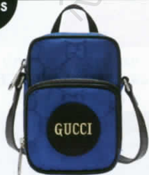
กระเป๋าครอบสบอดีผ้าไนลอน รีไซเคิล Econyl ทอลายโลโก้ ตกแต่งหนังฟอก จาก GUCCI