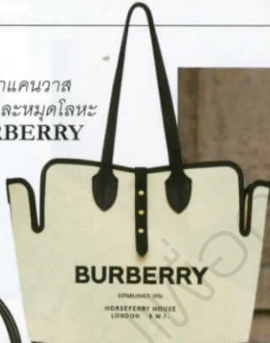
กระเป๋าคanvas ตกแต่งหนังและหมุดโลหะ จาก BURBERRY