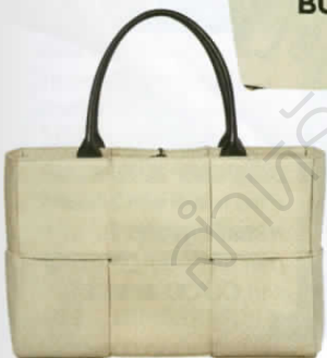
กระเป๋าคanvas สานตกแต่งหนัง จาก BOTTEGA VENETA