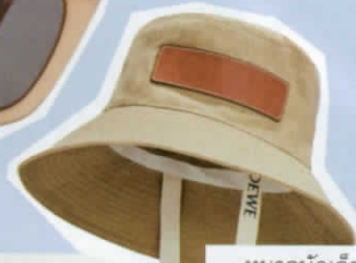
หมวกบักเก็ต ผ้าแคนวาสตกแต่งหนังและสายรัด จาก LOEWE