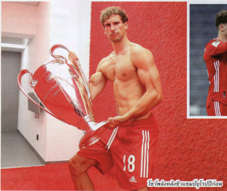
โชว์พลังหลังชีวแชมป์ยุโรปปีก่อน