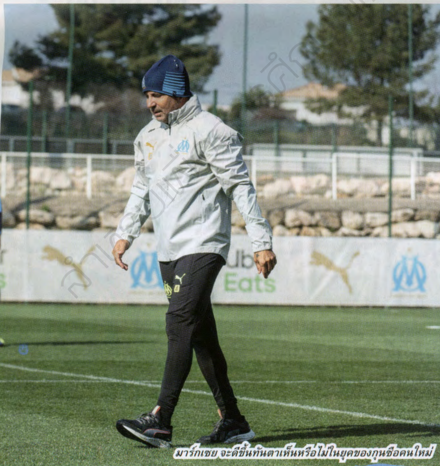
มาร์กเชย จะดีขึ้นทันตาเห็นหรือไม่ในยุคของกุนซือคนใหม่

เมื่ออยู่ด้วยกันไม่ได้ และโอลิมปิก มาร์กเชย ส่งสัญญาณไป ชามปาโอลี ก็ไม่รีรอให้เสียเวลา เขาไปรยาหาหมิ่นแฟน ๆ โอเอเอ็มได้ปลื้มตั้งแต่มาถึงว่า “ตลอดชีวิตมีคนบอกผมว่าโอเอเอ็มคือความคลั่งไคล้ ว่าสตาดี เวโลโดรม จะสว่างไสวเมื่อทีมมาถึงสนาม มาร์กเชยคือสโมสรของประชาชน และตัวผมก็รู้สึกได้ถึงความร่าร้อนนี้ เราไม่ได้มาอยู่ตรงนี้เพื่อหลบซ่อนตัว เราจะเล่นอย่างหนัก ตอนผมได้รับข้อเสนอนี้ ผมฝันว่าจะสามารถจัดงานฉลองในเมืองได้ ในโลกนี้มีพื้นที่แห่งที่เจียบสงบและสถานที่ที่เราใจ ผมต้องการแบบหลังและผมตอบรับโดยไม่ลังเลเลย สโมสรนี้มีจิตวิญญาณ และเพราะเหตุนี้เราจึงมาอยู่ตรงนี้เราพร้อมแล้ว...”