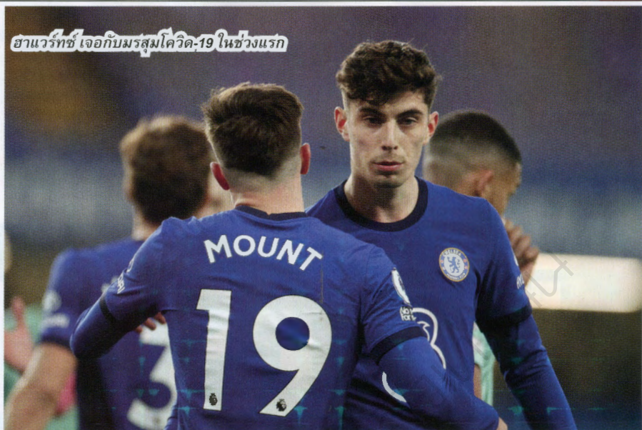
ฮาแวร์ทซ์ เจอกับมรสุมโควิด-19 ในช่วงแรก

แม้ทุเคิลจะเป็นนายเก่าที่เคยให้เขาประเดิมสนามที่โปรตุเกส ดอร์ทมุนด์ ก็ตาม