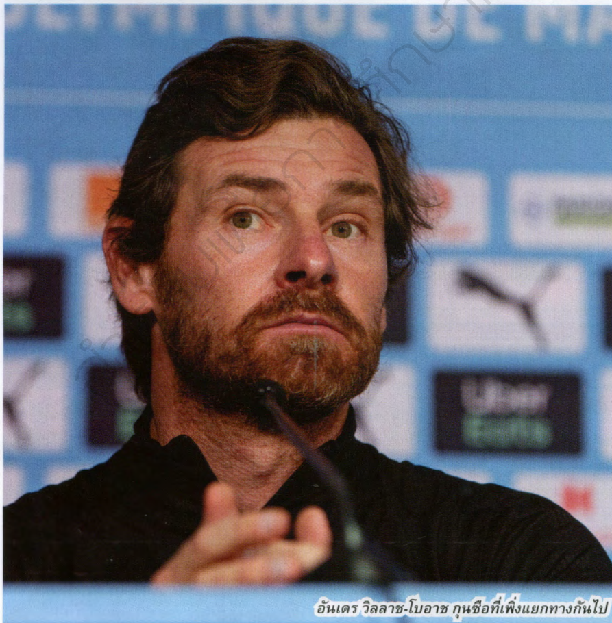
อังเดร วิลลาซ-โบอาซ กุนซือที่เพิ่งแยกทางกันไป

ระหว่างรอคอยการมาของชามปาโอลีที่ ปาโบล ลองโกเรีย เป็นผู้เลือกตั้งแต่ยังอยู่ในตำแหน่งเดิม โอแอ็มให้ นาสแซร์ ลาร์กเก้ต์ ผู้อำนวยการศูนย์ฝึกเยาวชนของสโมสร คุมทีมชั่วคราวที่พหุและเขาก็นำความสงบกลับสู่ทีมได้ดีในระดับหนึ่งขณะที่ผลงานก็ไม่ได้เลวเกินนัก เพียงแต่นัดสุดท้ายที่เขาได้คุมทีมชุดใหญ่ของสโมสรอยู่ข้าง