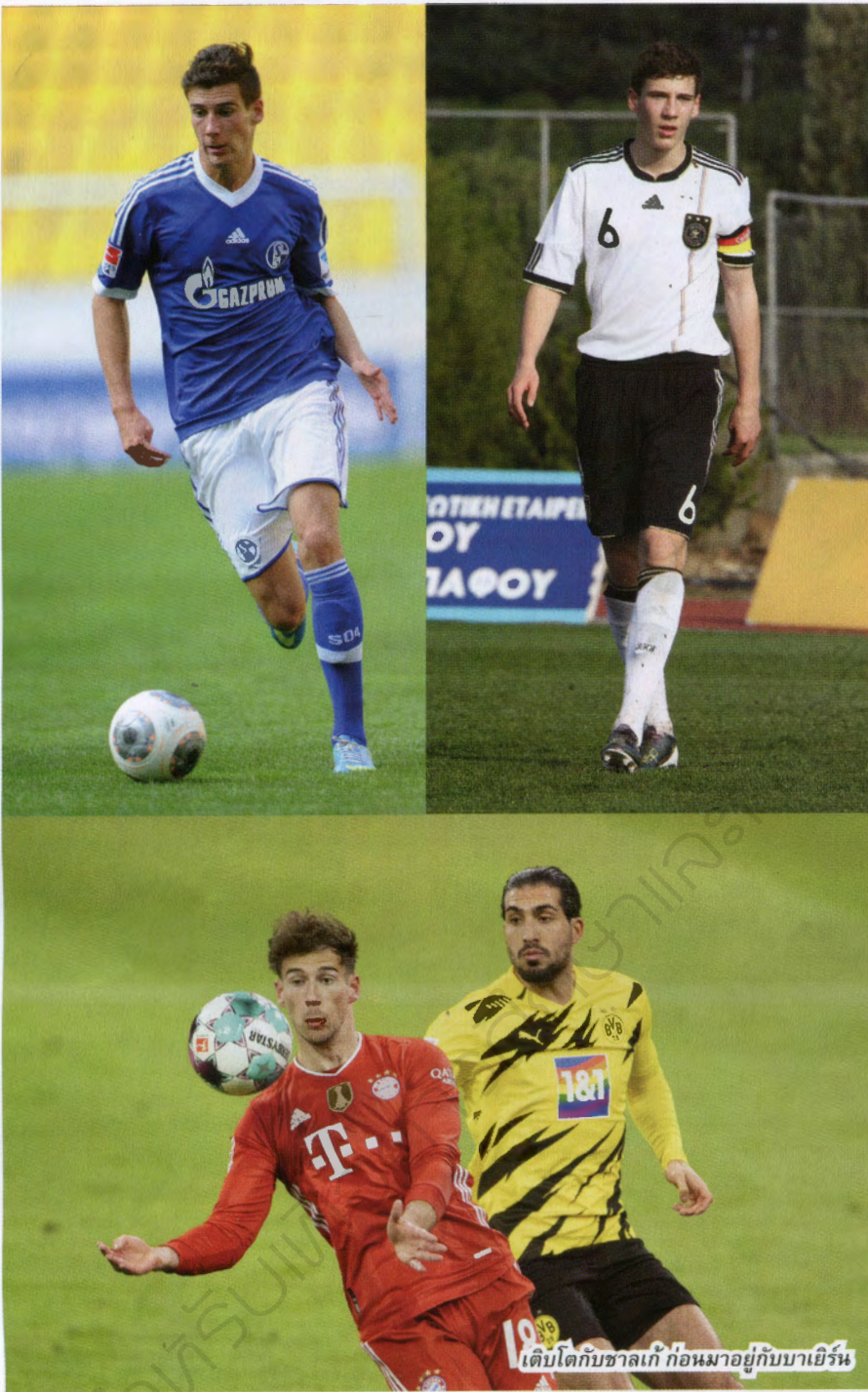
เติบโตกับซาลเก้ ก่อนมาอยู่กับบาเยิร์น

การรับมือเกมใต้จากฝั่งตรงข้าม วางแผนว่าเราจะเซตเกมกันยังไง จะตอบสนองยังไงกับการเสียบอล ผมพยายามจะใช้แรงขับเคลื่อนของผมเพื่อสร้างความอันตรายให้ฝั่งตรงข้าม เข้าสกัดบอล กำหนดจังหวะการเล่น นั่นคือความรับผิดชอบของผม Q : ฮันซี่ ฟลิค ช่วยคุณพัฒนาเรื่องอะไรบ้าง? A : เราพัฒนาทุกอย่าง ทั้งในส่วนบุคคลและทีม นับตั้งแต่เบรกโควิต เราเดินทางต่อเนื่อง ผมไปได้สวยกับทีมมากขึ้นเรื่อยๆ เรื่องนี้มันเกิดขึ้นเพราะความไว้วางใจจาก ฮันซี่ ฟลิค ที่มีต่อตัวผม ให้