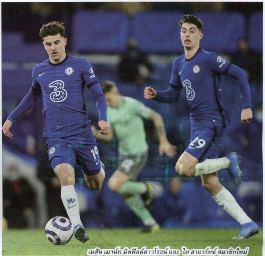
เมสัน เมาท์ มิดฟิลด์ดาวโรจน์ และ โค ฮาแวร์ทซ์ สมาชิกใหม่

ภาพที่ออกมาถือว่าน่าปลื้มใจแทนอะคาเดมี่ของเชลซี เพราะเมาท์ได้ลงสนามทั้ง 9 นัดในพรีเมียร์ลีก ยิงได้ 3 ประตูในวัยหนุ่ม รวมทั้งประตูชัยเหนือลิเวอร์พูล ถึงแอนฟิลด์