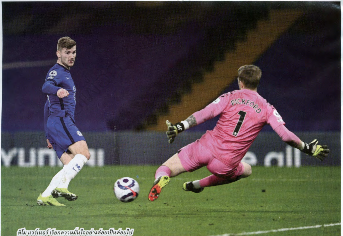
ติโม วีแอร์เรียกความมั่นใจอย่างค่อยเป็นค่อยไป