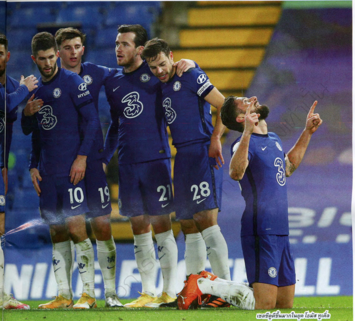
เชลซีดูดีขึ้นมาในยุค โรมัน อูเอเดส