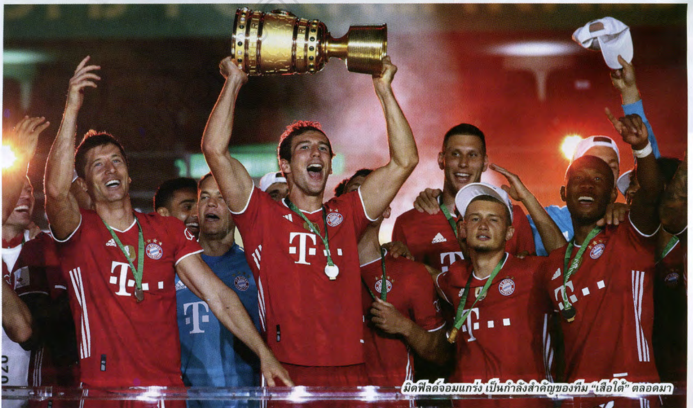
มิดฟิลด์จอมแกร่ง เป็นกำลังสำคัญของทีม "เสือใต้" ตลอดมา

A : ผมและทุกคนพยายามที่จะแสดงจุดแข็งของตัวเองออกมาในสนาม ช่วยกันแสดงมันออกมา นั่นคือสิ่งที่ทำให้ทีมๆ หนึ่งประสบความสำเร็จ ทุกคนมอบสิ่งที่ดีที่สุด และแสดงจุดแข็งของตัวเองออกมา นั่นคือสิ่งที่ผมพยายามทำด้วย มีการพูดถึงการยืนตำแหน่งของผมกับ โย (โยฮัน คิมมิช) มันสำคัญสำหรับการโจมตีของทีม เช่นเดียวกับ