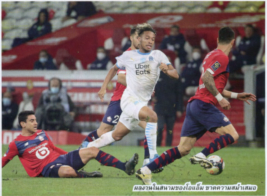
ผลงานในสนามของไอแอม ขาดความสม่ำเสมอ

อดีตผู้จัดการทีมชาติอาร์เจนตินา และทีมชาติชิลี เคยคุมทีมในยุโรปเพียงสโมสรเดียวคือ เซบิยา ในสเปน (2016/17) ที่เหลือเป็นการเดินสายคุมทีมในเปรู, ชิลี, เอกวาดอร์ และบราซิล