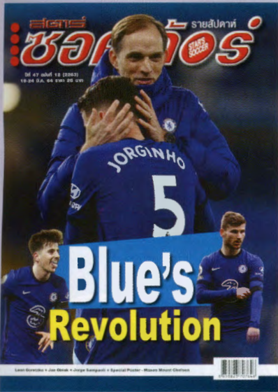
ภาพปก - เชลซี