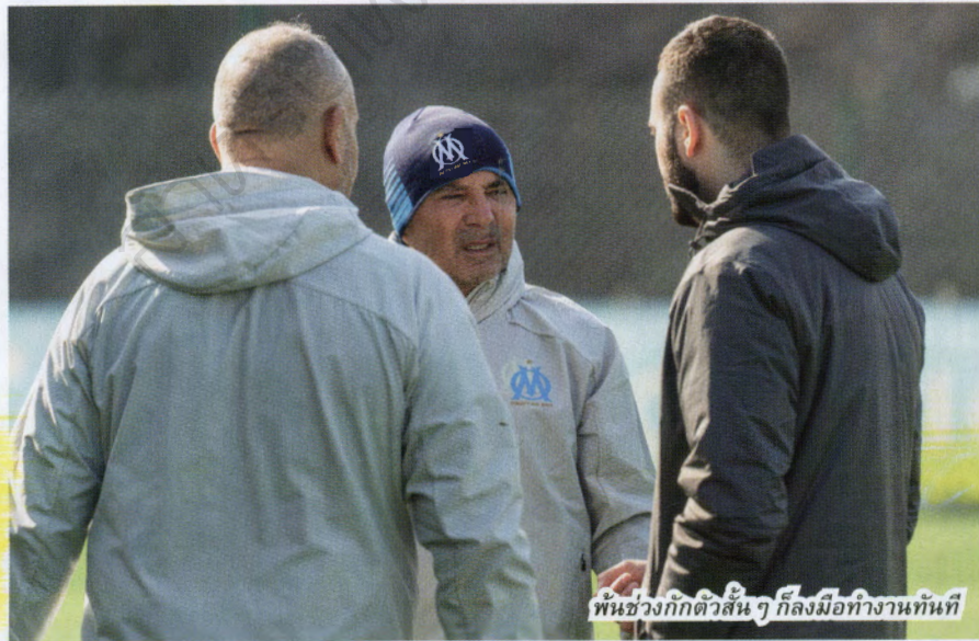
ในช่วงกักตัวสั้นๆ ก็ลงมือทำงานทันที

โอลิมปิก มาร์กเซย เซ็นสัญญากับเขาถึงปี 2023 แต่ขั้นต้นอยู่ด้วยกันให้ตลอดรอดฝั่งในฤดูกาลนี้เสียก่อนเพราะงานที่นั่นไม่เคยง่าย ไอแอมในยุคที่มีเจ้าของเป็นอเมริกัน คือ แฟรงค์ แม็คคอร์ธ ยังคงอยู่ด้วยนโยบายรัดเข็มขัด การจะทุ่มซื้อดาวดังค่าตัวแพง ค่าเหนื่อยสูงๆ ไม่อยู่ในวิสัย กระนั้น รับการมาของกุนชือคนใหม่ ปาโบล ลองโกเรีย ก็สัญญา