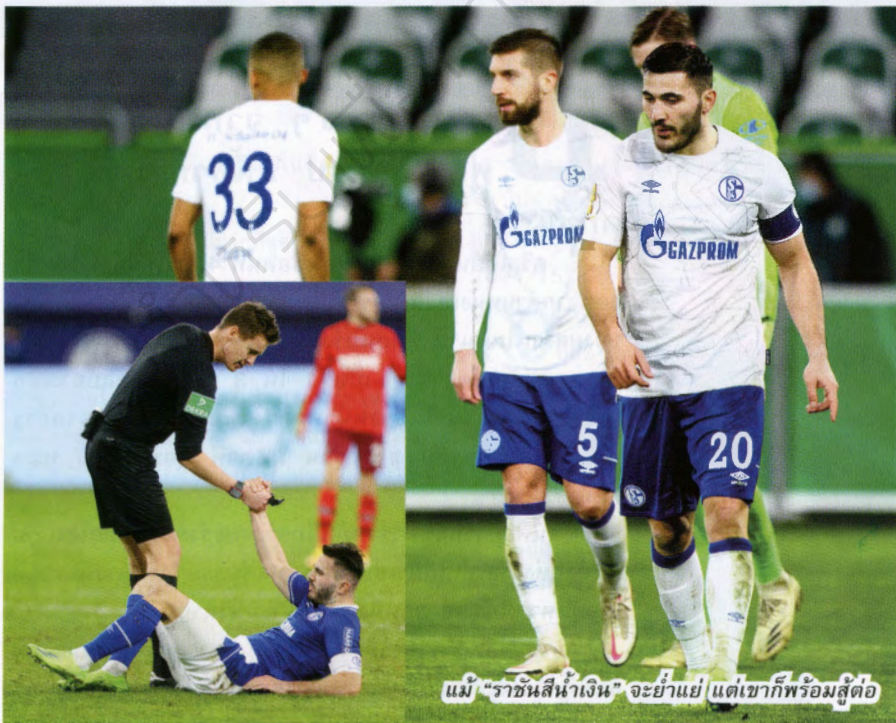
แม้ "ราชันสีน้ำเงิน" จะแย่ แต่เขาก็พร้อมสู้ต่อ

A : โชคเป็นส่วนหนึ่งเสมอ เรายุ่สึกมั่นใจในสนาม และเรารู้สึกว่าเรากำลังเล่นได้เหนียวแน่นและเป็นรูปทรงกว่าเดิม นี่เป็นสิ่งสำคัญ และเราจะสร้างโชคให้กับตัวเองด้วยการทำงานหนักในทุกๆ