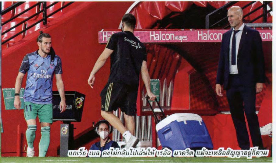
แกเร็ธ เบล คงไม่กลับไปเล่นให้ เรอัล มาดริด แม้จะเหลือสัญญาอยู่ก็ตาม