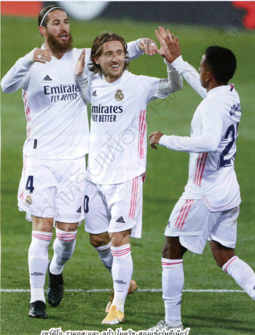
เชร์คีโอ รัมอส และ ลูกา โมดริช สองแข้งรุ่นซีเนียร์