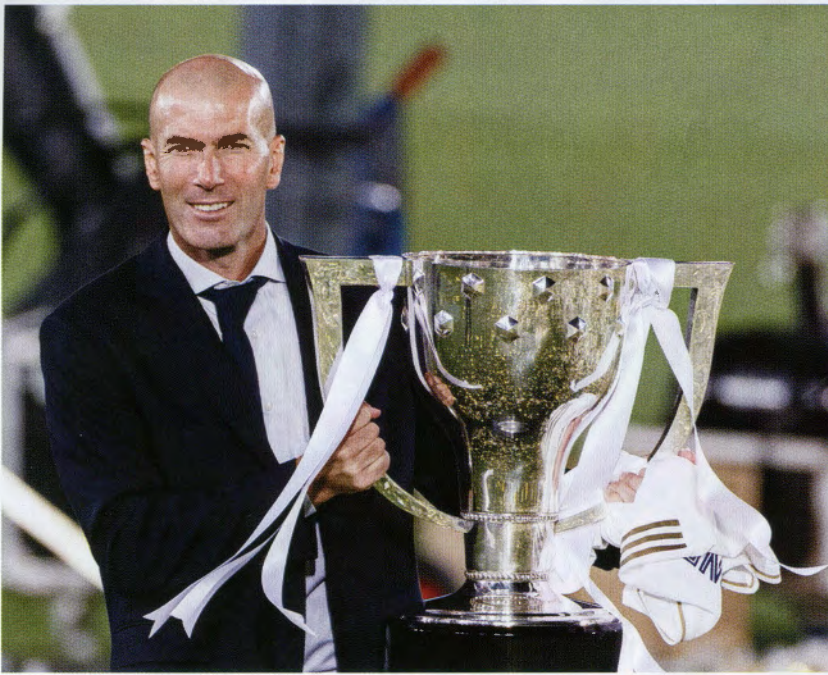
ยุคของซิดาน กับ เรอัล มาดริด กำลังจะสิ้นสุดลงอีกครั้ง ?