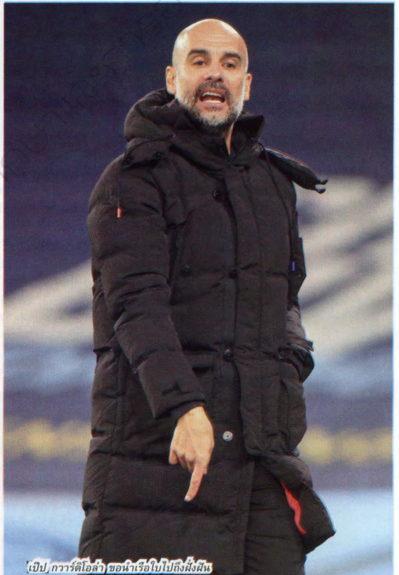
เป๊ป กวาร์ดิโอล่า ขอนำเรือใบไปถึงฝั่งฝัน

เข้า : ไม่มี ออก : เทย์เลอร์ ฮาร์วู้ด-เบลลิส, ดีแรน สลิกเกอร์