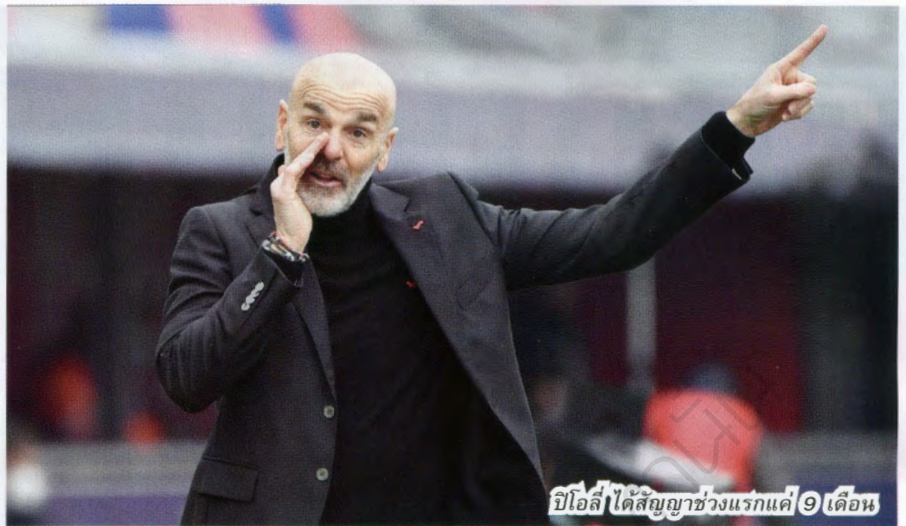
ปิโอลี ได้สัญญาช่วงแรกแค่ 9 เดือน

คงไม่ต้องบอกว่า อิบราฮิโมวิช พอใจการทำงานร่วมกับปิโอลีมากแค่ไหน แมตดอนนี่ “อิบรา” มีอายุ 39 ปีเข้าให้แล้วแต่ก็ยังเป็นคนสำคัญของทีม เป็นดาวยิงตัวหลักของมิลาน ศูนย์หน้าชาวสวีดิชอยู่ในแผนงานของปิโอลีกับของสโมสร และแม้สัญญาจะหมดในฤดูกลางนี้ มิลานก็พร้อมจะต่อสัญญากับเขาหากสภาพร่างกายของเขามองออกเจ้าตัวว่ายังไหวอยู่