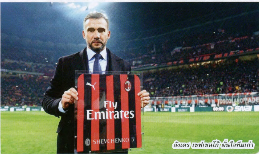
อังเดร เชฟเชนโก้ มั่นใจทีมเก่า