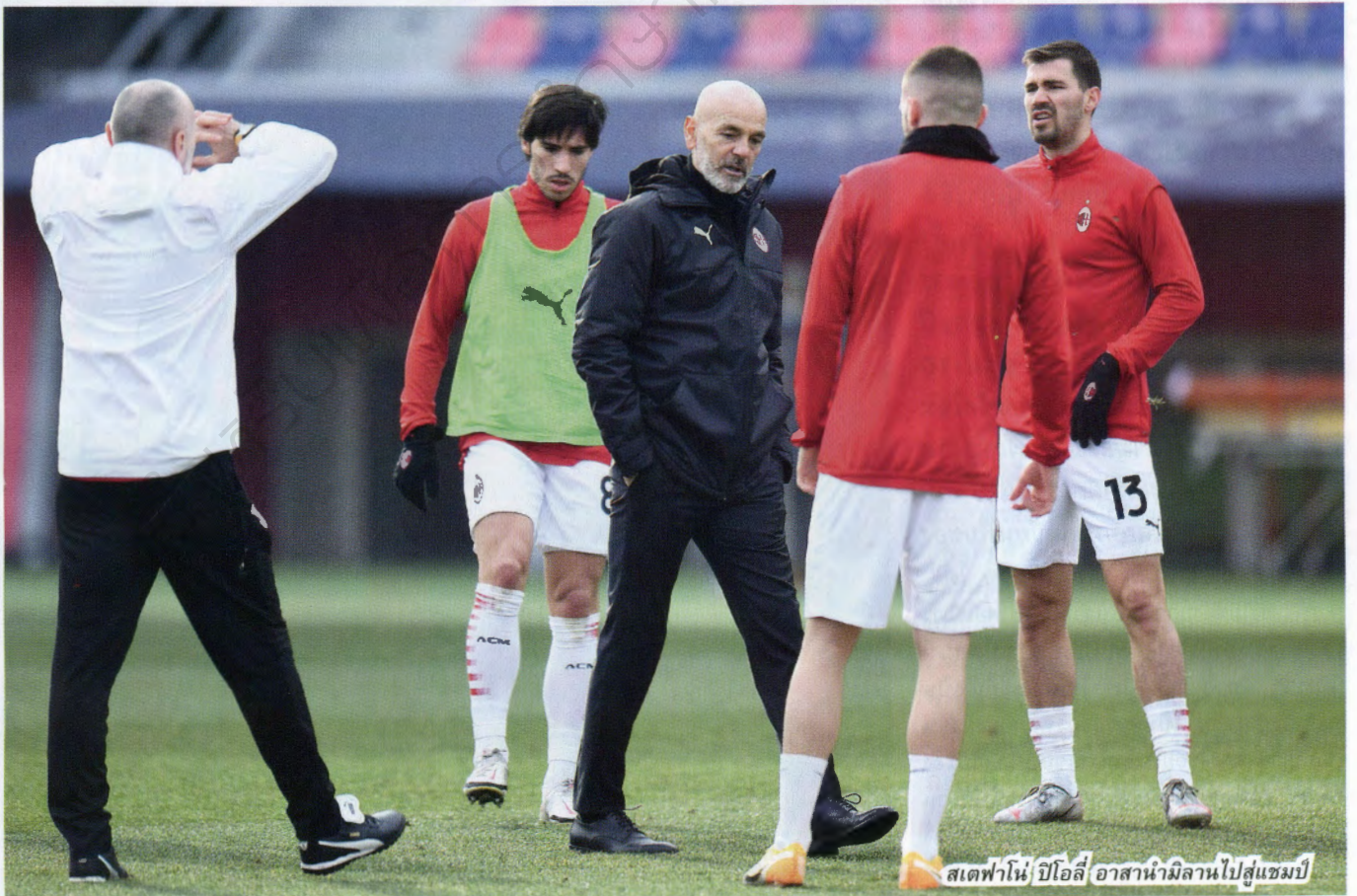
สเตฟาโน่ ปีโอลี อานานำมิลานไปสู่แชมป์

ก่อนหน้านั้นมิลานพยายามทาบทามลูชาโน่ สปัลเลตตี กับทวนหนักถึงอดีตโค้ชของ