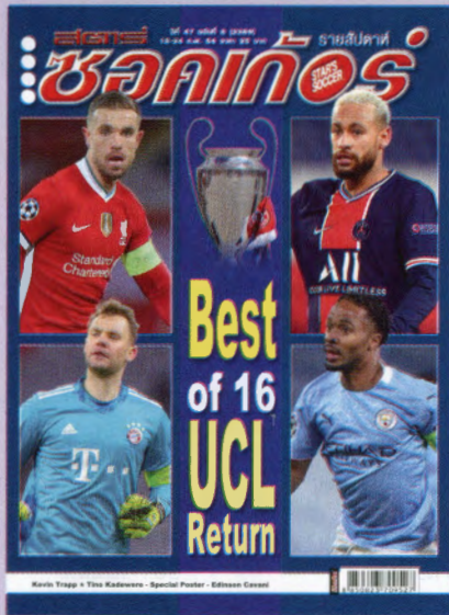
ภาพปก - แชมเปียนส์ ลีก รอบ 16 ทีม

พักกันไปพ้อหอมปากหอมคอ ตึกยูเอฟ่า แชมเปียนส์ ลีก ก็ได้ฤกษ์กลับมา ทวดกันต่อในรอบ 16 ทีมแล้ว