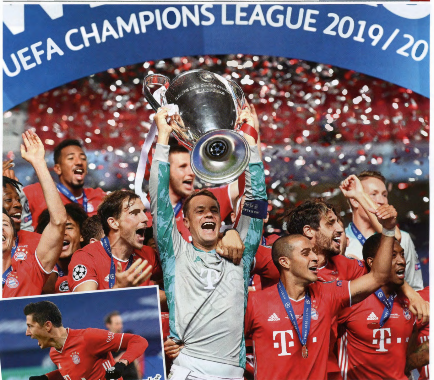
บาเยิร์น มิวนิค กับเป้าหมายป้องกันบัลลงก์