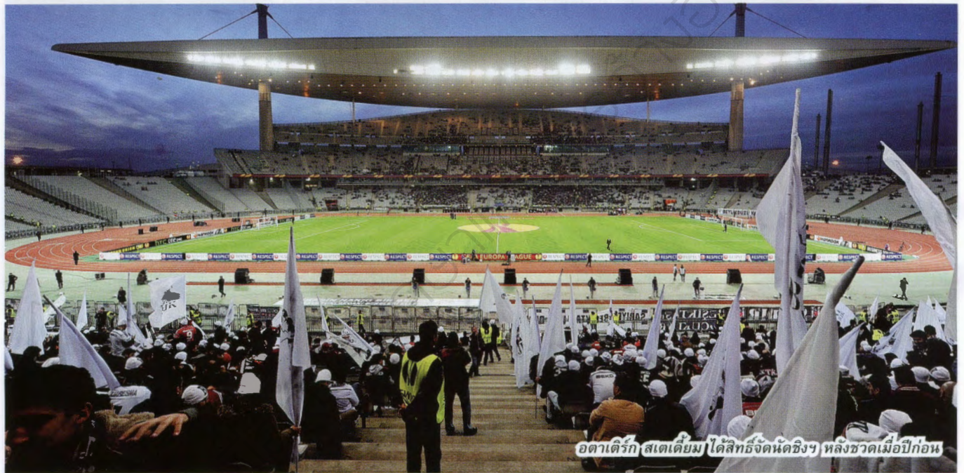
อตาลันต้า สเตเดียม ได้สิทธิ์จัดนัดชิงฯ หลังขาดเมื่อปีก่อน