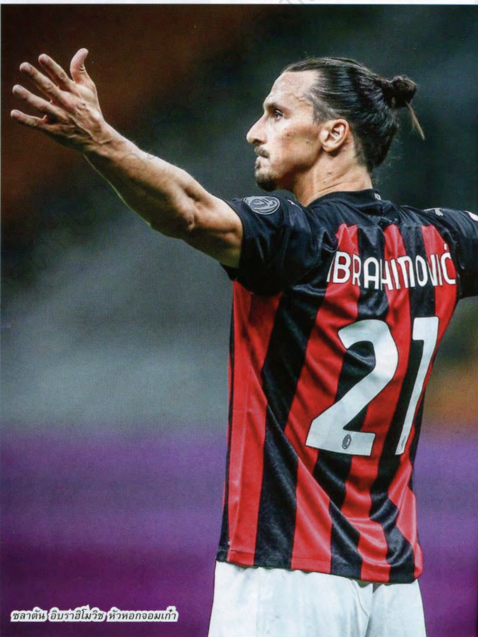
ซลาตัน อิบราฮิโมวิช หัวหอกจอมเก๋า