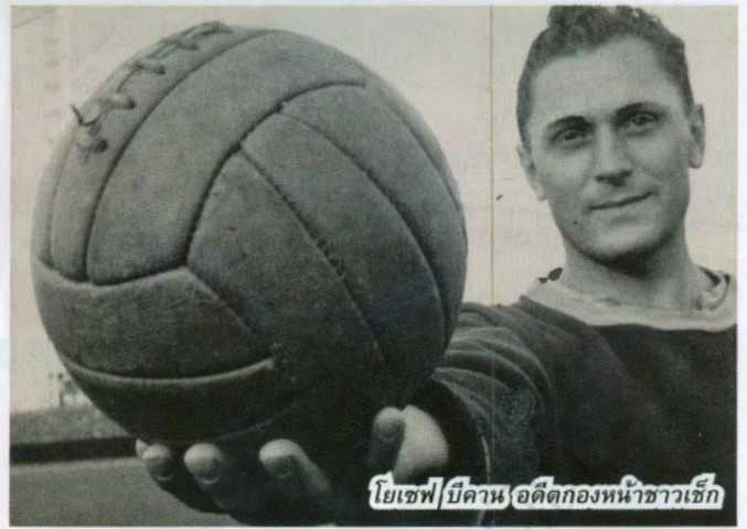
โยเซฟ/มีคานัน อดีตกองหน้าชาวเช็ก

ผลงาน 2 ประตู กับอูดีเนเซ่ ทำให้โรนัลโดแขงหน้าเปเล่ตำนานแข้งชาวบราซิล ที่มีการบันทึกไว้ว่ายิงได้ 757 ประตู ซึ่งแน่นอนว่า การบันทึกสถิติในอดีตของเปเล่ นั้นยังคงคลุมเครือ เช่นเดียวกับมีคานัน เพราะกองหน้าชาวเช็ก ที่ซัดไปทั้งหมด 805 ประตู ในชีวิตอาชีพ แต่แหล่งข่าวใหญ่อย่าง มาร์ก้า เชื่อว่าหลายประตูไม่ได้เกิดในเกมระดับอาชีพ ทั้งที่มท้องถิ่นและทีมสำรองของ ราปิโต เวียนนา ทำให้เหลือเพียง 759 ประตู แบบเดียวกับเปเล่ ตำนานแข้งชาวบราซิลนั่นเอง และเมื่อเทียบกับคู่ปรับบารมีในปัจจุบัน นั่นคือ ลิโอเนล เมสซี ดาวเตะบาร์เซโลน่า ก็เพิ่งทำได้แค่ 718 ประตู ในระดับสโมสรและทีมชาติเท่านั้น