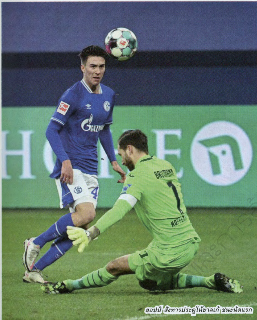
ฮอปป์ สิงหารประตูให้ซาลเก้ ขณะนัดแรก