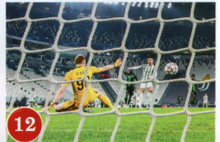
ประตูที่สองกับ กายารี เซ่นเคย