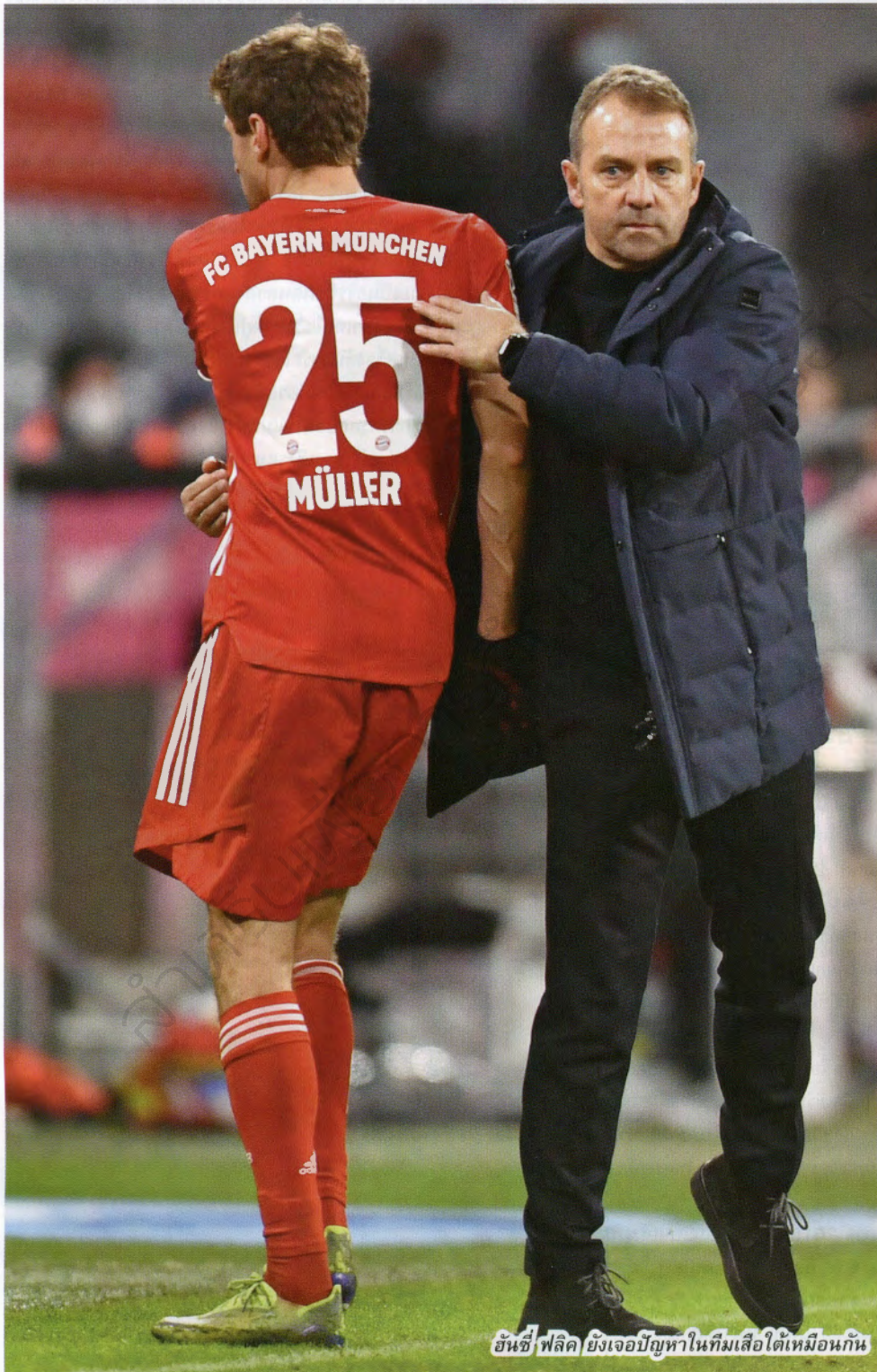
อันซี ฟลิค ยังเจอปัญหาในทีมเสือใต้เหมือนกัน

อันซี ฟลิค ฟันธงชัดเจนว่า หน้าหนาวนี้ บาเยิร์นมิวนิค จะไม่ขยับตัวในตลาดนักเตะอย่างแน่นอน