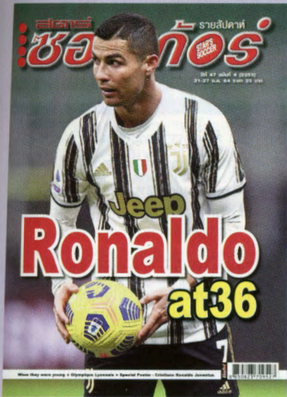
ภาพปก คริสเตียโน่ โรนัลโด้