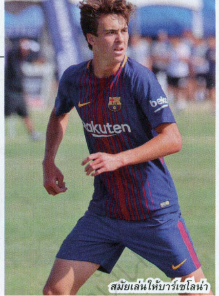
สมัยเล่นให้บาร์เซโลน่า

A : ผมเล่นได้หมดเลยในแดนหน้า แต่ที่ผมอยาก