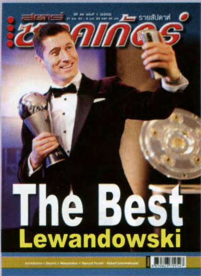
ภาพปก โรเบิร์ต เลวานดอฟสกี