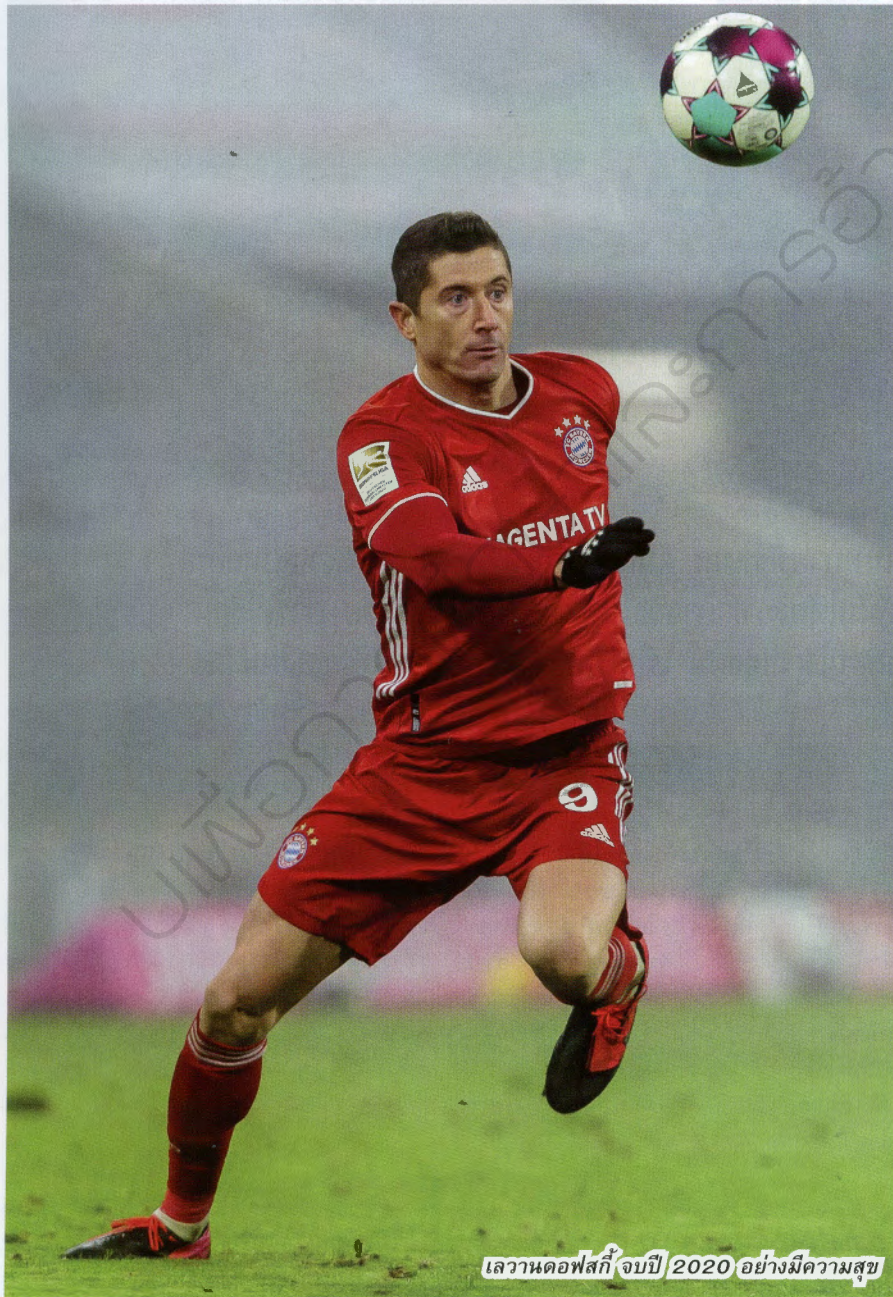
เลวานดอฟสกี จบปี 2020 อย่างมีความสุข

เลวี: เมสซี กับ โรนัลโด้ นั่งอยู่ในโต๊ะเดียวกัน อยู่ในจุดสูงสุดมานานมาก และนั่นทำให้พวกเขาไม่สามารถเปรียบเทียบได้ ดังนั้น การจะตอบคำถามของคุณ ผมไม่ได้จินตนาการว่าอยู่เคียงข้างพวกเขาในแง่มุมนี้ ที่นี้ถ้าคุณดูตัวเลขต่าง ๆ ในปีที่และแม้แต่ปีก่อนหน้า ผมเชื่อว่าผมไม่เล่นหนักในแง่ผลงานโดยรวมกับประตูที่ยิงได้ ด้วยความที่ไม่ได้อยู่ร่วมโต๊ะเดียวกับ เมสซี และ โรนัลโด้ ผมคิดว่าผมสามารถเชิญพวกเขามาทานที่โต๊ะของผมได้ (หัวเราะ)