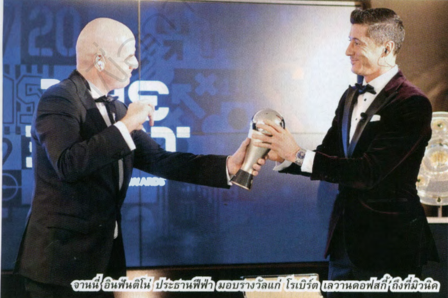
จานนี อินฟานติโน่ ประธานฟีฟ่า มอบรางวัลแก่ โรเบิร์ต เลวานดอฟสกี ถึงที่มิวนิค

เลวี: สำหรับกองหน้าก็เหมือนกับคนเป็นผู้รักษาประตู สมาธิเป็นเรื่องสำคัญมาก สำหรับเราแล้วปฏิบัติยากต้องทันและโดยธรรมชาติ เราไม่มีเวลาคิด ไม่มีเวลาบอกตัวเองว่า "ฉันจะทำแบบนี้หรือแบบนี้" หรือเวลาในการวิเคราะห์ มีข้อมูลมากมายที่