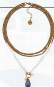
โซ้กเกอร์โซ้โลหะ ชุบทองรมดำตกแต่งมุก และหิน จาก DIOR