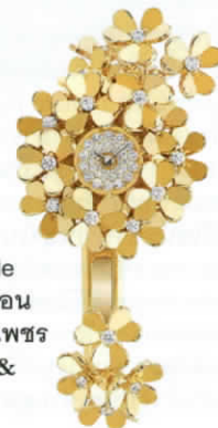
นาฬิกาดอกไม้ 'Frivole Secrète Watch' ตัวเรือน เยลโลว์โกลด์ประดับเพชร จาก VAN CLEEF & ARPELS