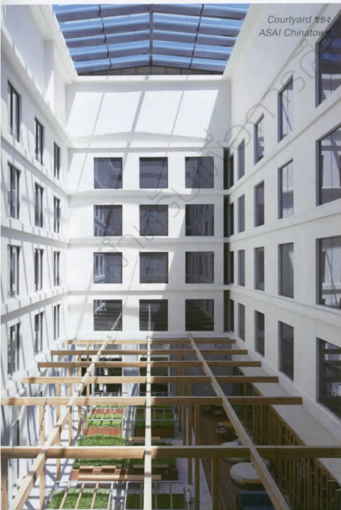
Courtyard ของ ASAI Chinatown