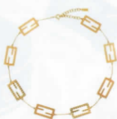
โซ้กเกอร์โซ้โลหะ ชุบทอง จาก FENDI