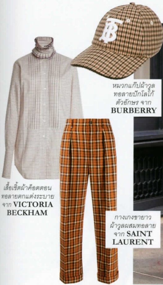
หมวกแก๊ปผ้าวูล ทอลายบิกโลโก้ ตัวอักษร จาก BURBERRY