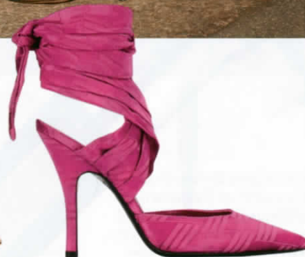
รองเท้าส้นสูงผ้าไหมผูกข้อ จาก THE ATTICO