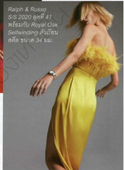
Ralph & Russo S/S 2020 ชุดที่ 41 พร้อมทั้ง Royal Oak Selfwinding ตัวเรือน สตีล ขนาด 34 มม.

ของ Ralph & Russo เพื่อให้ทั้งสองแบรนด์ต่างเป็นกระจกสะท้อนถึงกันทั้งในเรื่องภูมิปัญญาสร้างสรรค์และความเป็นเลิศในทิศทางเฉพาะตัว