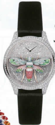
นาฬิการูปผึ้ง 'Dior Grand Soir Reine des Abeilles' ตัวเรือน ไวต์โกลด์ประดับเพชร อัญมณีหลากชนิด ไปจนถึงขนนก จาก DIOR