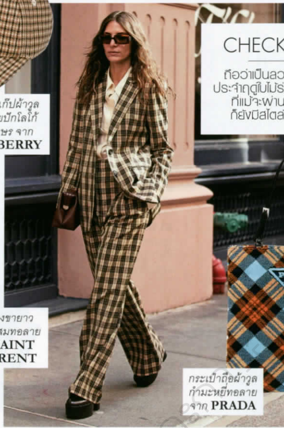
กางเกงขายาว ผ้าวูลผสมทอลาย จาก SAINT LAURENT