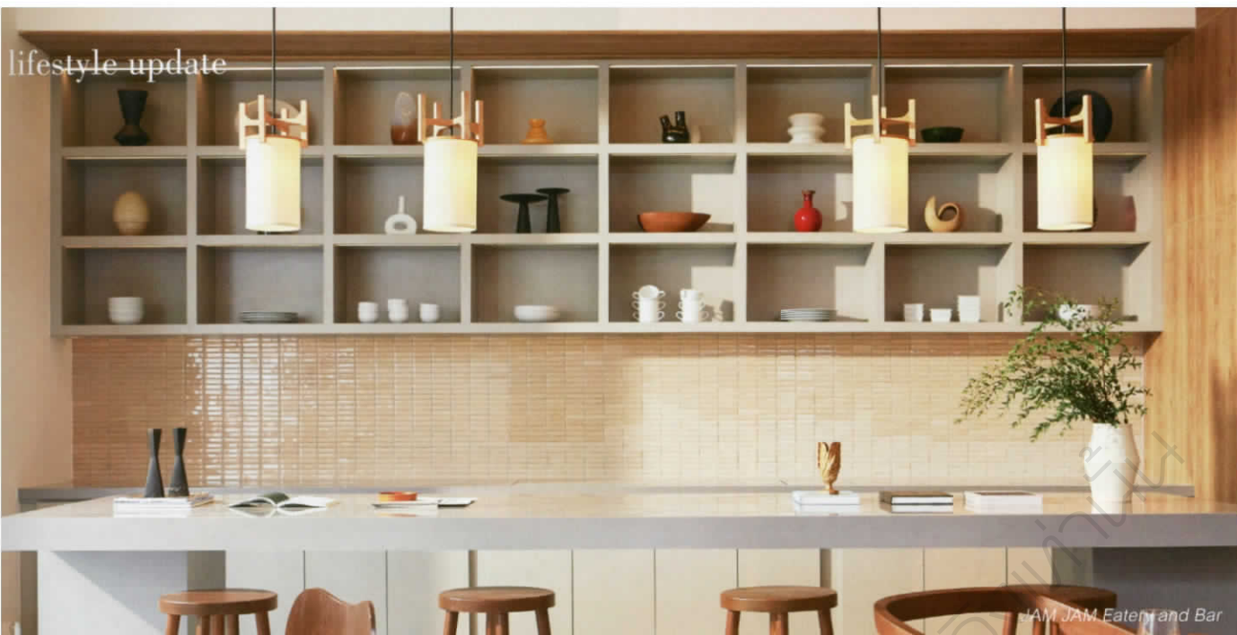
JAM JAM Eatery and Bar