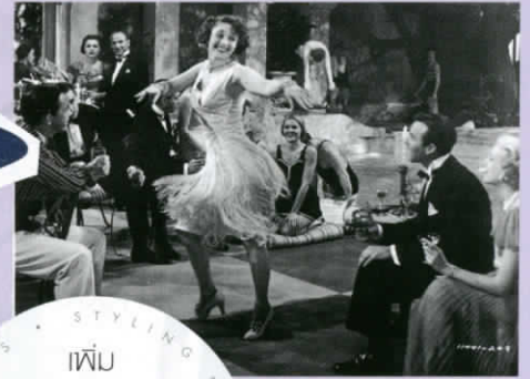
INSPIRATION The Great Gatsby (1949)

เพ็ญ เครื่องประดับ โทนสีทองที่ให้ กลิ่นอายวินเทจ จะช่วยคอบพลัดลุค ได้อย่างมีสไตล์