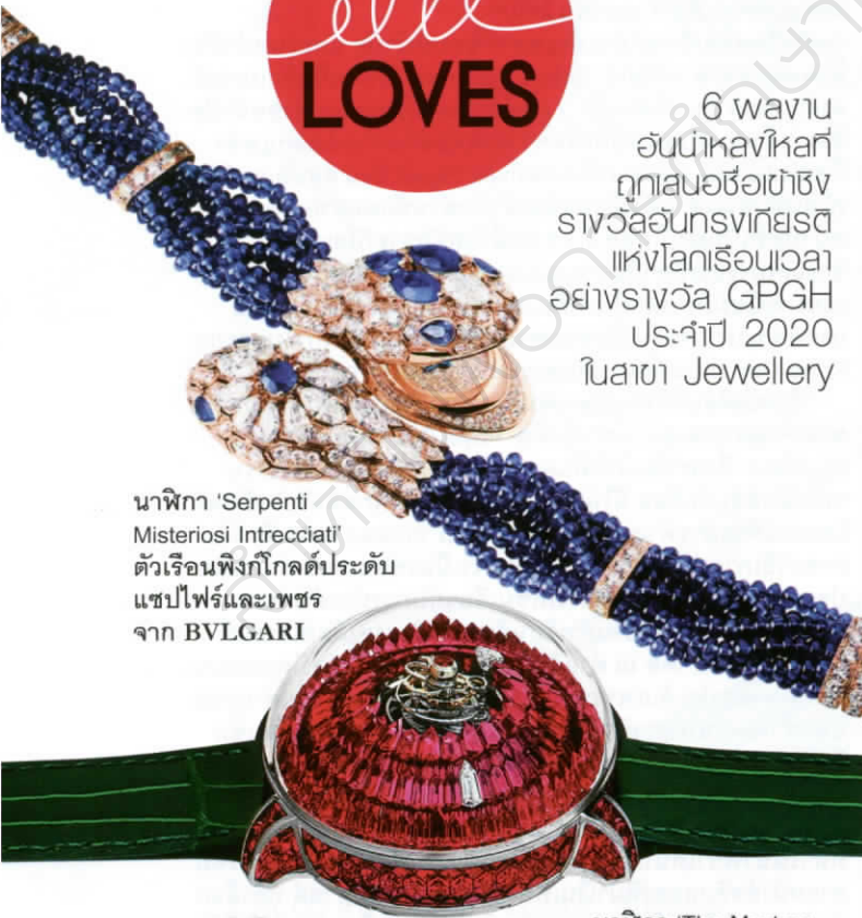
นาฬิกา 'Serpenti Misteriosi Intrecciati' ตัวเรือนฟิงก์โกลด์ประดับ แซปไฟร์และเพชร จาก BVLGARI