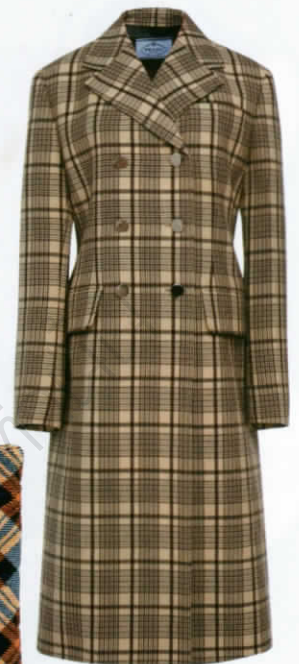
โค้ทผ้าวูลทอลาย จาก PRADA