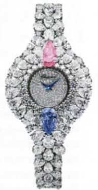
นาฬิกา 'Magari' ตัวเรือนไวต์โกลด์ ประดับเพชร เพชรแฟนซีสีฟ้า และชมพู จาก CHOPARD