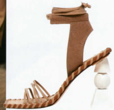
รองเท้าส้นสูงหนังรัดข้อตัดต่อ ผ้าแคนวาส จาก JACQUEMUS