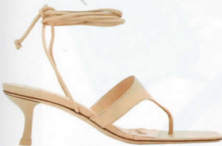
รองเท้าส้นเตี้ยหนังผูกข้อ จาก CULT GAIA