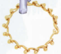
โซ้กเกอร์ โลหะชุบทอง จาก LOEWE