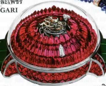
นาฬิกา 'The Mystery Tourbillon Full Ruby' ตัวเรือนเกรย์โกลด์ ประดับทับทิมทั่วทั้งเรือน จาก JACOB & CO.

6 ปรากฏ อันน่าทึ่งใหลก็ ถูกเสนอชื่อเข้าชิง รางวัลอันกรทียธรี แห่งโลกเรือนเวลา อย่างรางวัล GPGH ประจำปี 2020 ในสาขา Jewellery