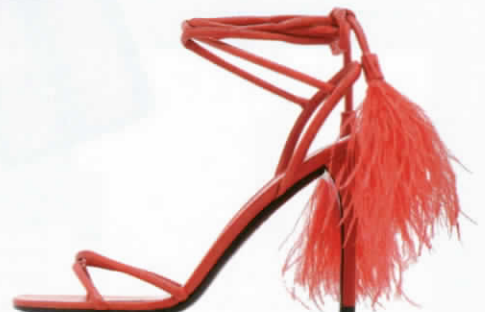
รองเท้าส้นสูงหนังผูกข้อตกแต่งขนนก จาก VALENTINO