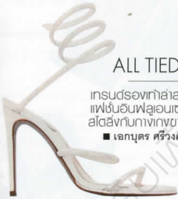
รองเท้าส้นสูงหนังรัดข้อตกแต่งคริสตัล จาก RENÉ CAOILLA

เทรนด์รองเท้าล่าสุดจากเหล่า แฟชั่นนิสต์ฟลูออเนชันเซอร์ที่ดึง สไตล์กับกางเกงขายาวเท่านั้น ■ เอกบุตร ศรีวงศ์อุดมสิน