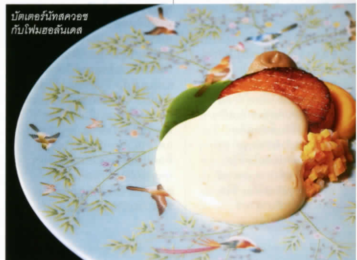
บัตเตอร์นัทสควอชกับโคมฮอลันเดส

■ กษิดิศ ศรีวิสัย 📍 IGNIV Bangkok by Andreas Caminada โรงแรม St. Regis Bangkok เปิดให้บริการวันพุธ-อาทิตย์ เวลา 12.00-15.00 น. และ 18.00-23.00 น. โทร 0-2207-7822