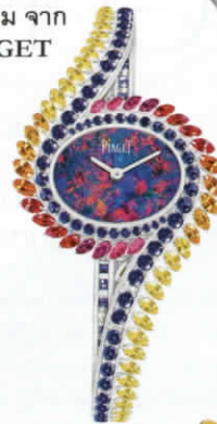
นาฬิกา 'Limelight Gala High Jewellery Black Opal' ตัวเรือน ไวต์โกลด์ หน้าปัด ประดับแบล็กโอปอล ล้อมด้วยแซปไฟร์ ไล่เฉดและ ทับทิม จาก PIAGET

6 ปรากฏ อันน่าทึ่งใหลก็ ถูกเสนอชื่อเข้าชิง รางวัลอันกรทียธรี แห่งโลกเรือนเวลา อย่างรางวัล GPGH ประจำปี 2020 ในสาขา Jewellery