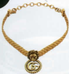
โซ้กเกอร์โลหะ ชุบทองรมดำ จาก GUCCI