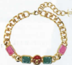
โซ้กเกอร์โซ้โลหะ ชุบทองลงยา จาก CHANEL