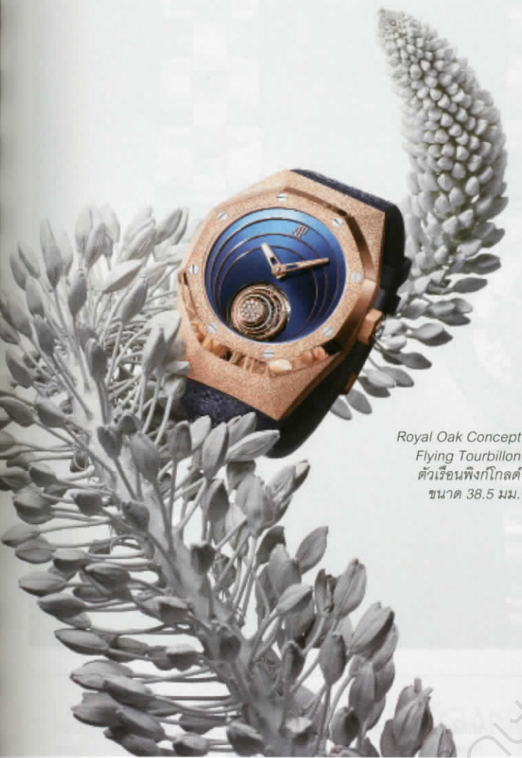
Royal Oak Concept Flying Tourbillon ตัวเรือนฟังก์โกลด์ ขนาด 38.5 มม.