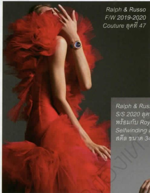
Ralph & Russo F/W 2019-2020 Couture ชุดที่ 47