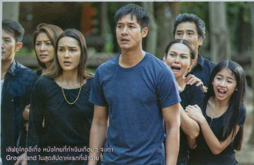
เลิฟยูโคกอีเก็ง หนึ่งไทยที่ทำเงินเกือบๆ จะเท่า Greenland 1 สุดสัปดาห์แรกที่เข้าฉาย

ไว้กับตลาดต่างจังหวัดเป็นสำคัญเสียแล้ว โทนๆ ละครวิหคหมอชิตก็มีแฟนๆ ในต่างจังหวัดติดตาม กันเยอะ เมื่อว่าจะเรียกแฟนๆ ในต่างจังหวัด ให้มาดูหนังเรื่องนี้ด้วย ตอนเป็นละครก็เรตติ้งดี ชะขนาดนั้น