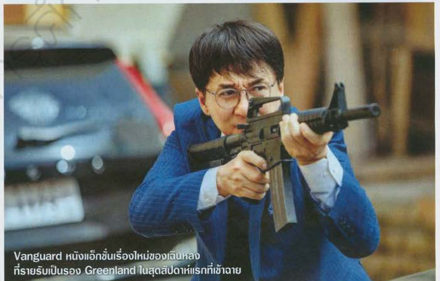
Vanguard หนังแอ็กชันเรื่องใหม่ของเงินหลง ที่รายรับเป็นรอง Greenland ในสัปดาห์แรกที่เข้าฉาย

ซึ่งนอกเหนือจาก Vanguard แล้ว หนังใหม่ เรื่องอื่นๆ ที่เพิ่งเข้าฉายทั้งหนังเกาหลีแอ็กชัน อาชญากรรม Deliver Us from Evil แล้วก็หนัง ดราม่าสงคราม The Last Full Measure ก็เป็นเหมือนแค่ไม้ประดับหรือประกอบฉาก ให้ตามโรงหนังดูมีตัวเลือกมากขึ้นสำหรับ