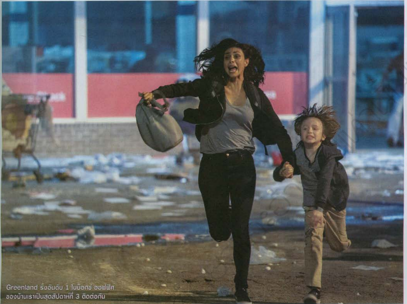
Greenland ริงอันดับ 1 ในบ็อกซ์ ออฟฟิศ ของบ้านเราเป็นสุดสัปดาห์ที่ 3 ติดต่อกัน