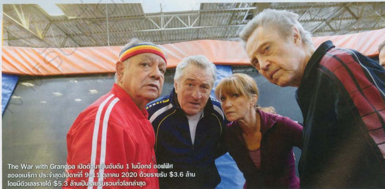
The War with Grandpa เปิดตัวมาเป็นอันดับ 1 ในบ็อกซ์ ออฟฟิศของอเมริกา ประจำสัปดาห์ที่ 9-11 ตุลาคม 2020 ด้วยรายรับ $3.6 ล้าน โดยมีตัวเลขรายได้ $5.3 ล้านเป็นรายรับรวมทั้งโลกล่าสุด