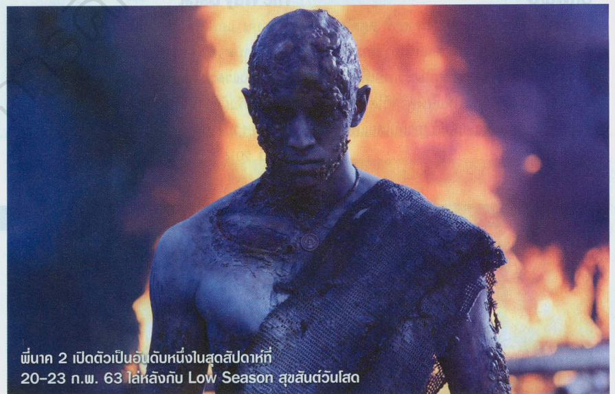
พีนาค 2 เปิดตัวเป็นอันดับหนึ่งสุดสัปดาห์ที่ 20-23 ก.พ. 63 ใกล้เคียงกับ Low Season สุขสันต์วันโสด

สัปดาห์เดียวกับที่ Low Season เข้าฉาย Parasite หนังเกาหลีที่สร้างหน้าประวัติศาสตร์เป็นหนังจากเอเชียเรื่องแรกที่เป็นเจ้าของรางวัลออสการ์ในสาขาหนังยอดเยี่ยมก็กลับมาฉายใหม่หลังจากที่ลงโรงฉายครั้งแรกไปเมื่อ 25 ก.ค. ปีที่ผ่านมา ซึ่งเมื่อนับรวมกับรายได้จากการเข้าฉายครั้งแรกที่หนังจบโปรแกรมด้วยตัวเลขราว 28.7 ล้านบาท ล่าสุดก็เท่ากับหนังเป็นเจ้าของ