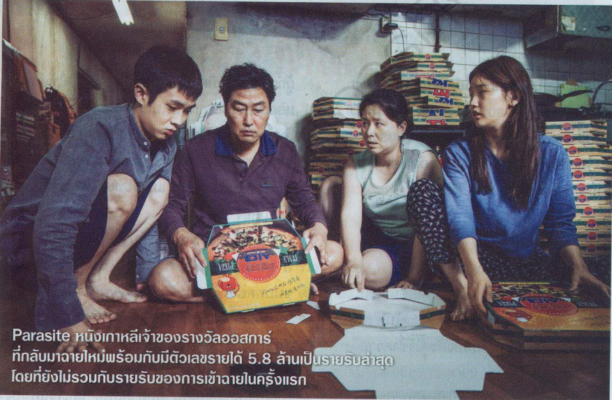
Parasite หนึ่งเทศกาลเจ้าของรางวัลออสการ์ ที่กลับมาฉายใหม่พร้อมกับมีตัวเลขรายได้ 5.8 ล้านเป็นรายรับล่าสุด โดยที่ยังไม่รวมกับรายรับของการเข้าฉายในครั้งแรก

อันนี้หนักกว่า เพราะเข้าฉายได้สัปดาห์เดียว สุดสัปดาห์ถัดมาก็หายจ้อยไปจากบ็อกซ์ ออฟฟิศ ซะแล้ว ขณะที่สถานการณ์ในสุดสัปดาห์ถัดมา 20-23 ก.พ. 63 อันเป็นสุดสัปดาห์ล่าสุดในที่นี้ หนึ่งไทย ภาคต่อที่มีทั้งคอมมิวต์มีทั้งฝีมือด้วยเต็มๆ พื้นที่ 2 ซึ่งภาคแรกนั้นถือได้ว่าเป็นหนึ่งในหนังไทยที่สร้าง เซอร์ไพรส์ในปีที่ผ่านมา ทำเงินตลอดทั้งโปรแกรม