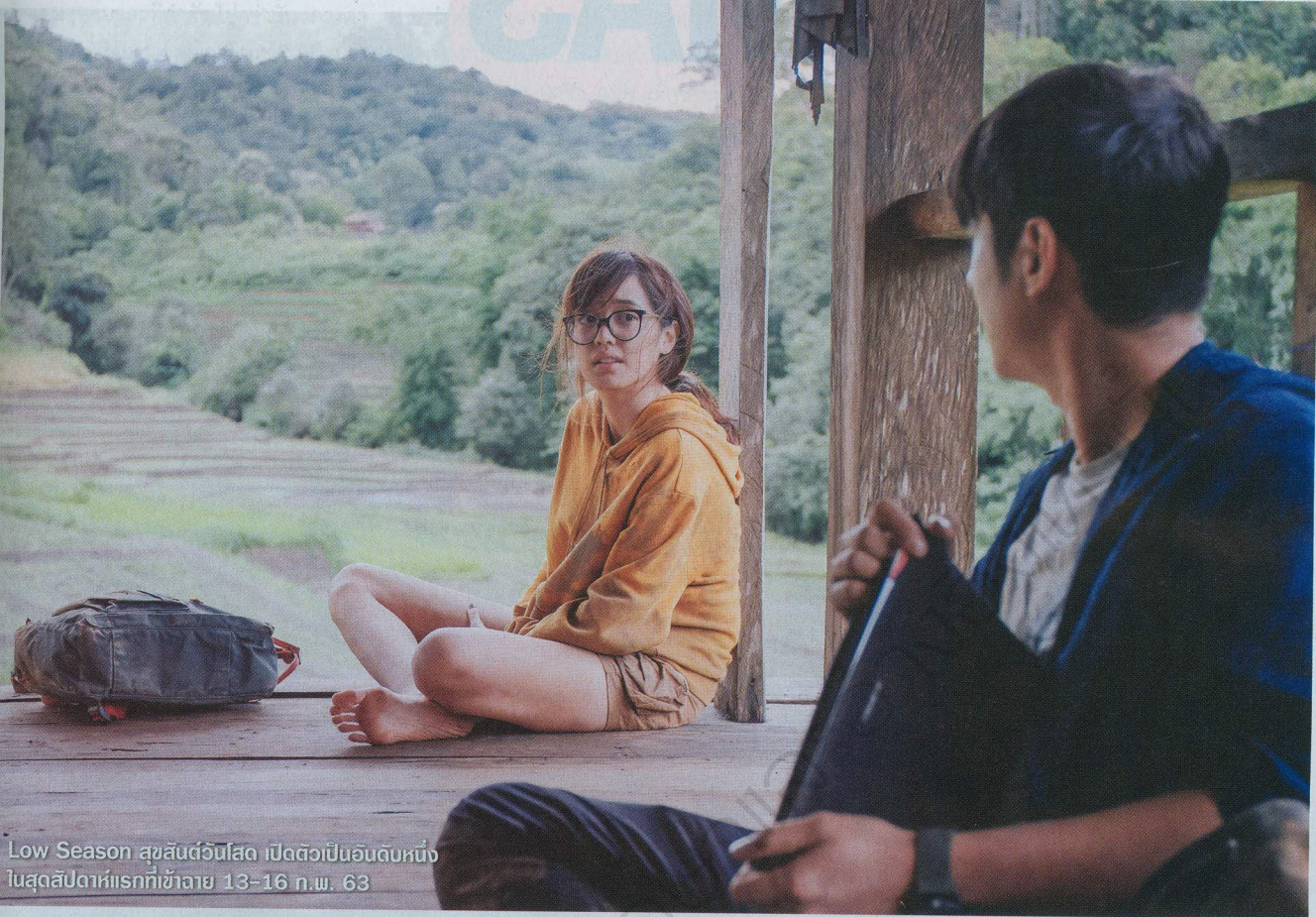
Low Season สุขสันต์วันโสด เปิดตัวเป็นอันดับหนึ่งในสุดสัปดาห์แรกที่เข้าฉาย 13-16 ก.พ. 63