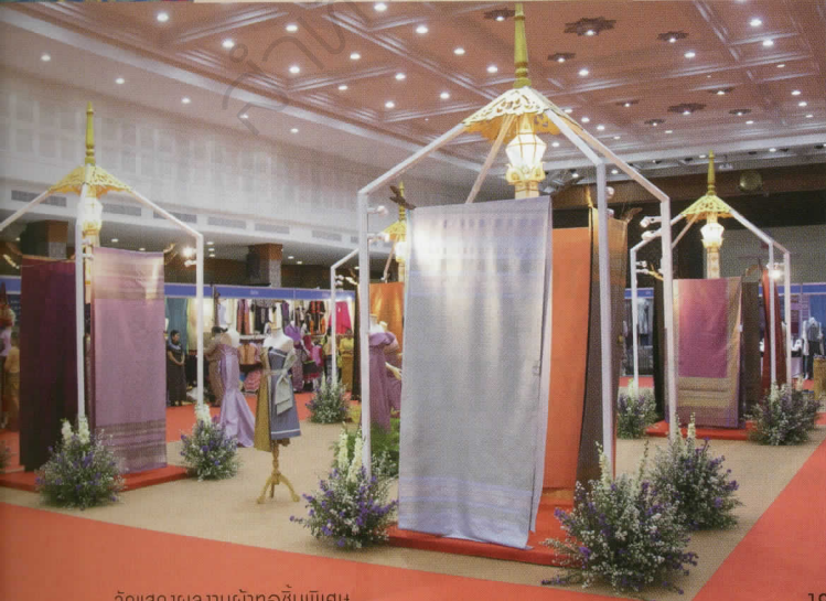
จัดแสดงผลงานผ้าทอขึ้นพิเศษ

“ท่านหญิงมีความตั้งใจมากที่จะไปตลาดผ้าทอลำพูนในครั้งนี้นี้ เพราะอยากเห็นผ้าทอ อยากเห็นลายหรือเทคนิคต่าง ๆ ซึ่งเคยเห็นมาเมื่อ 5 - 6 ปีที่แล้ว ซึ่งมีความน่าสนใจมาก เรารู้ว่าผ้าไหม ผ้ายกดอกลำพูนอย่างไรก็ขายได้ แต่ไม่ยากให้ตัดแปลงวิธีที่ต่างจากของดั้งเดิม เราต้องการความเป็นคุณภาพ ความเป็นโบราณ ความสวยด้วยตัวเขาเองจริง ๆ เชื่อว่าพวกเขาสามารถทำได้สวยมากกว่านี้ ไปได้ไกลกว่านี้ ท่านหญิงไม่ต้องการให้ใช้ทางลัดหรือคิดว่อย่างไรรก็ขายได้ในตลาดทั่วไป ต้องสมราคา สมน้ำสมเนื้อ สมกับกาลเวลา เทคนิคหลายเทคนิคหายไป การนุ่งซิ่นก็หายไป กลายเป็นผ้าฝ้ายแทน