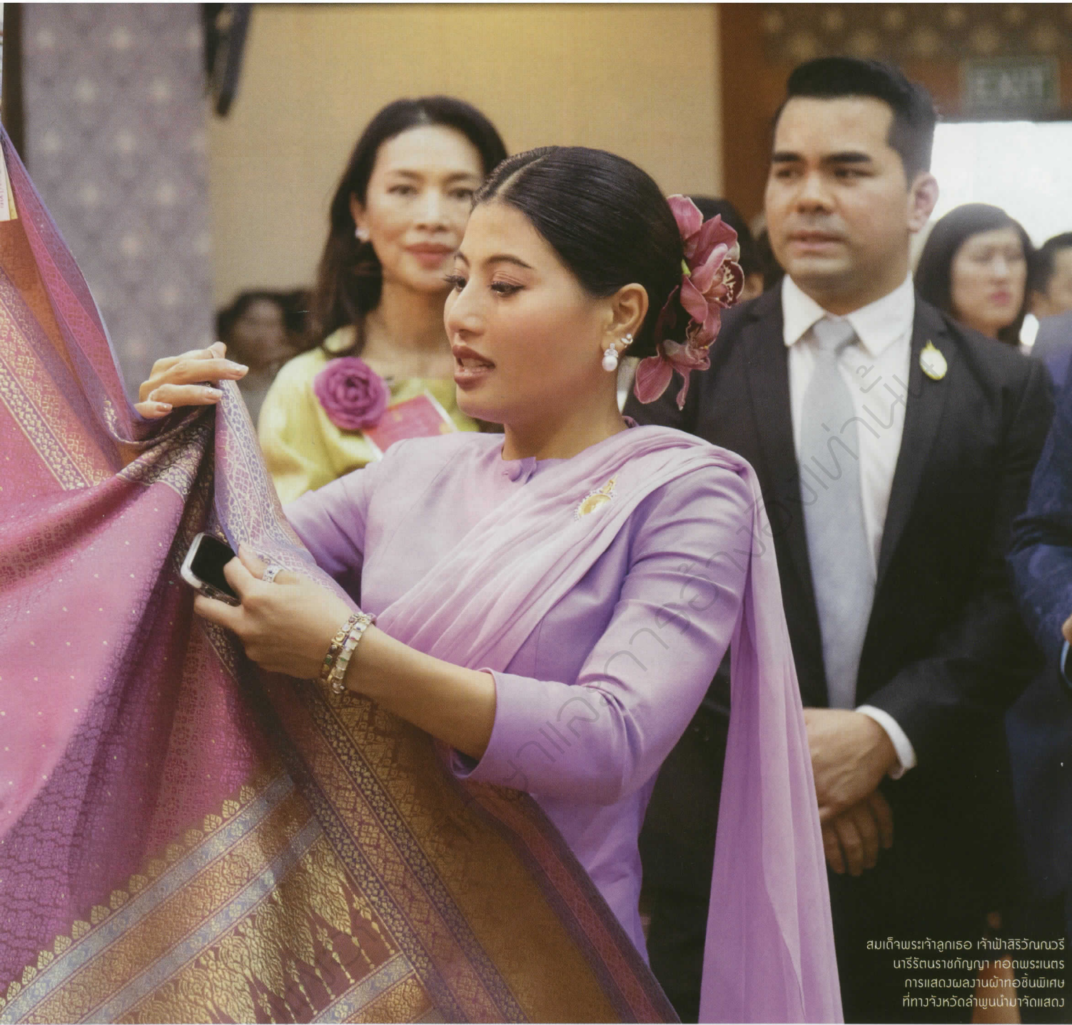
สมเด็จพระเจ้าลูกเธอ เจ้าฟ้าสิริวัณณวรี นารีรัตนราชกัญญา ทอดพระเนตร การแสดงผลงานผ้าทอชิ้นพิเศษ ที่ทางจังหวัดลำพูนนำมาจัดแสดง