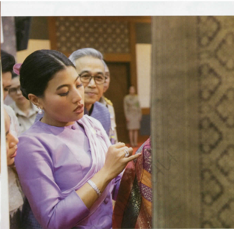
ทอดพระเนตรการทอผ้าทอที่โรงทอผ้ายกดอกที่สถาบันผ้าทอมือศรีบุญชัย