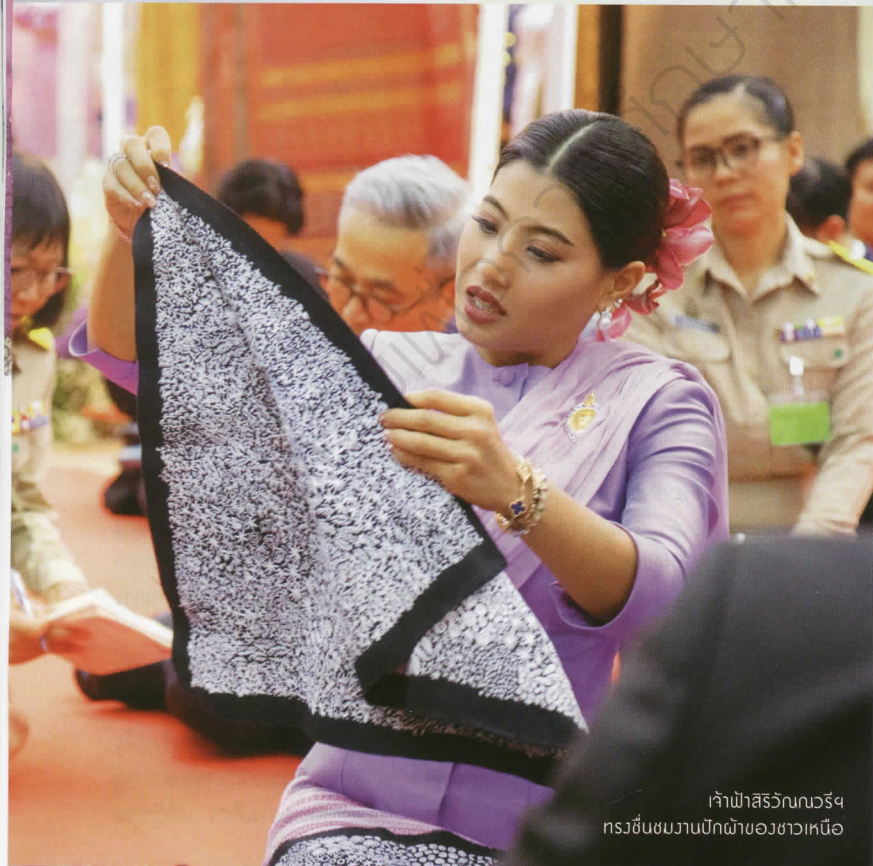
เจ้าฟ้าสิริวัณณวรีฯ ทรงชื่นชมบ้านปักผ้าของชาวเหนือ

ต้นเหตุของปัญหาดังกล่าวเริ่มต้นจากจำนวนช่างฝีมือชั้นครูที่สามารถทอผ้าไหมลำพูนได้มีจำนวนน้อยลง อีกทั้งเด็กรุ่นใหม่ก็มิได้สนใจการทอผ้าไหมเพื่อเป็นอาชีพ ดังนั้นอุตสาหกรรมการทอผ้าไหมในลำพูนจึงแคบอยู่แค่เฉพาะกลุ่ม ทำให้การผลิตผ้าไหมลดจำนวนลงไปด้วย ขณะที่ความต้องการของตลาดที่มีต่อผ้าไหมลำพูนยังคงเพิ่มขึ้น จึงทำให้ผ้าไหมลำพูนราคาสูง ส่งผลให้ช่างรับทอผ้าเพื่อให้ทันกับการจำหน่าย จึงทำให้ความประณีตในการทอผ้าลดน้อยลง และต้องใช้กรรมวิธีต่าง ๆ ที่เป็นการข้ามขั้นตอนการทอผ้าไหมแบบดั้งเดิม เพื่อให้ผลิตผ้าไหมได้เร็วและได้จำนวนมากขึ้น ซึ่งโดยเฉลี่ยแล้วผ้าไหมลำพูน 1 ผืนใช้ระยะเวลาในการทอประมาณ 2 เดือน