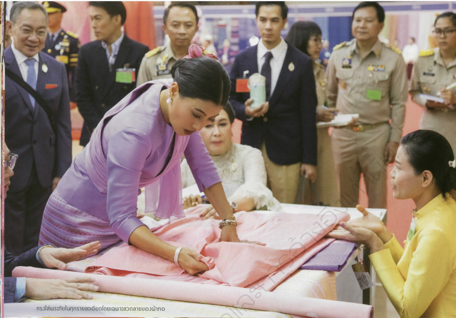
ทรงใส่พระทัยในทุกรายละเอียดโดยเฉพาะลวดลายของผ้าทอ