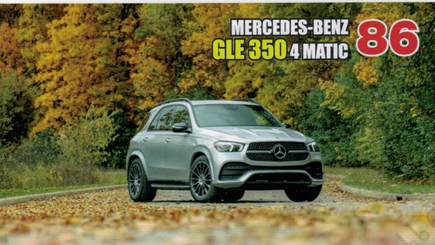
MERCEDES-BENZ GLE 350 4MATIC 86