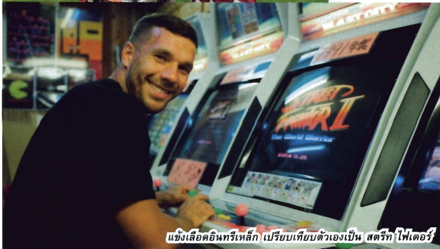
แข้งเลือดอินทรีเหล็ก เปรียบเทียบตัวเองเป็น สตรีท ไฟเตอร์

เส้นทางค้าแข้งของเขาหักเหไปอยู่กับอาร์เซนอล นาน 3 ฤดูกาล ท่ามกลางความหวังของแฟนบอลปืนใหญ่ ตามด้วยจังหวะพเนจรไปอิตาลี, ญี่ปุ่น ก่อนหวนกลับมาตุรกีเป็นคำรบสอง