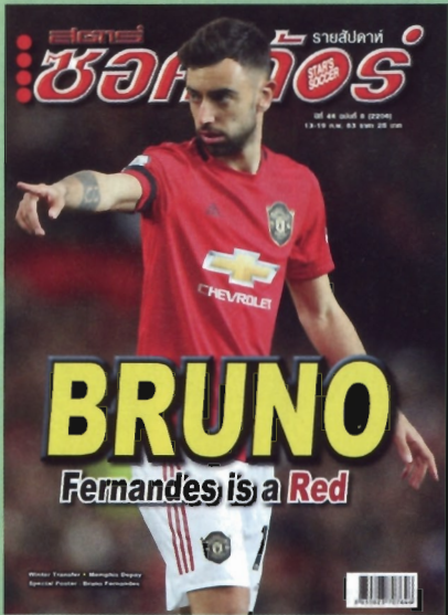
ภาพปก : บรูโน่ แฟร์นันด์ส