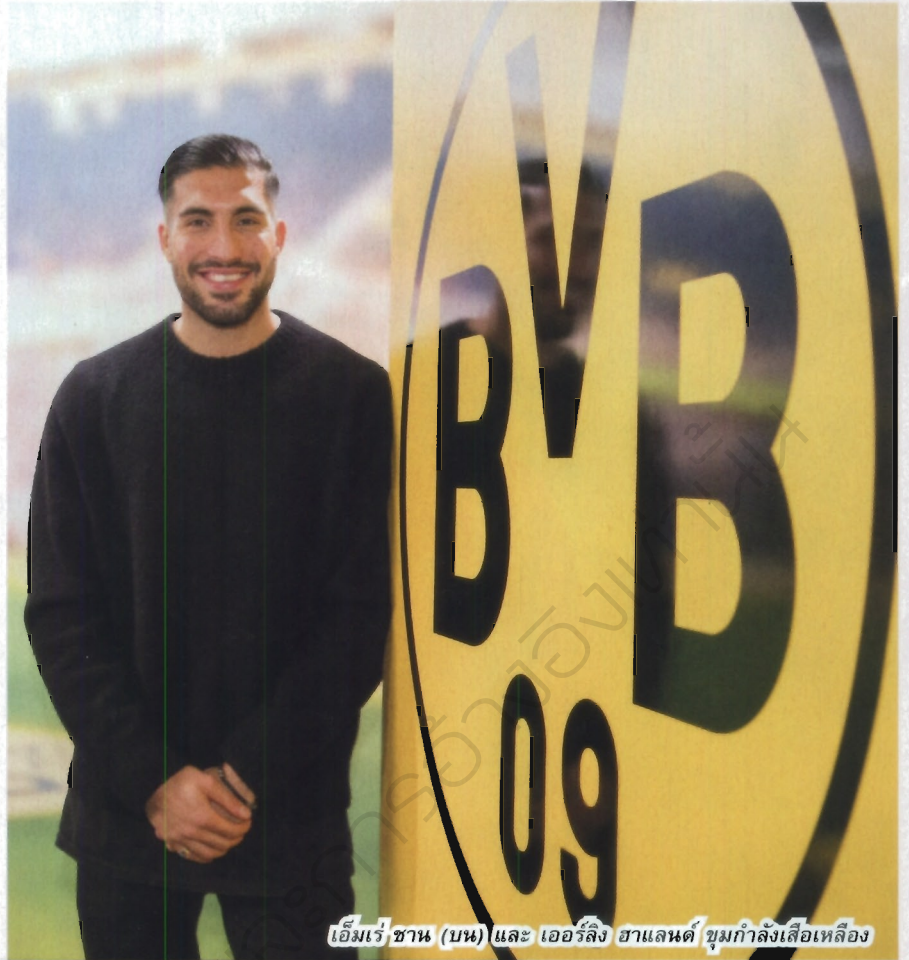
เอ็มเร่ ซาน (บน) และ เออร์ลิง ฮาแลนด์ ชุมกำลังเสือเหลือง