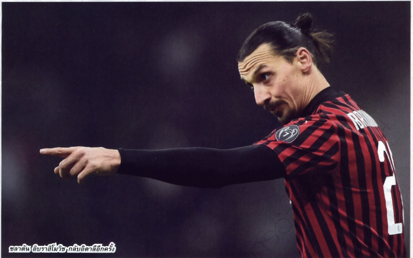
ซลาตัน อิบราฮิโมวิช, กลับอิตาลีอีกครั้ง