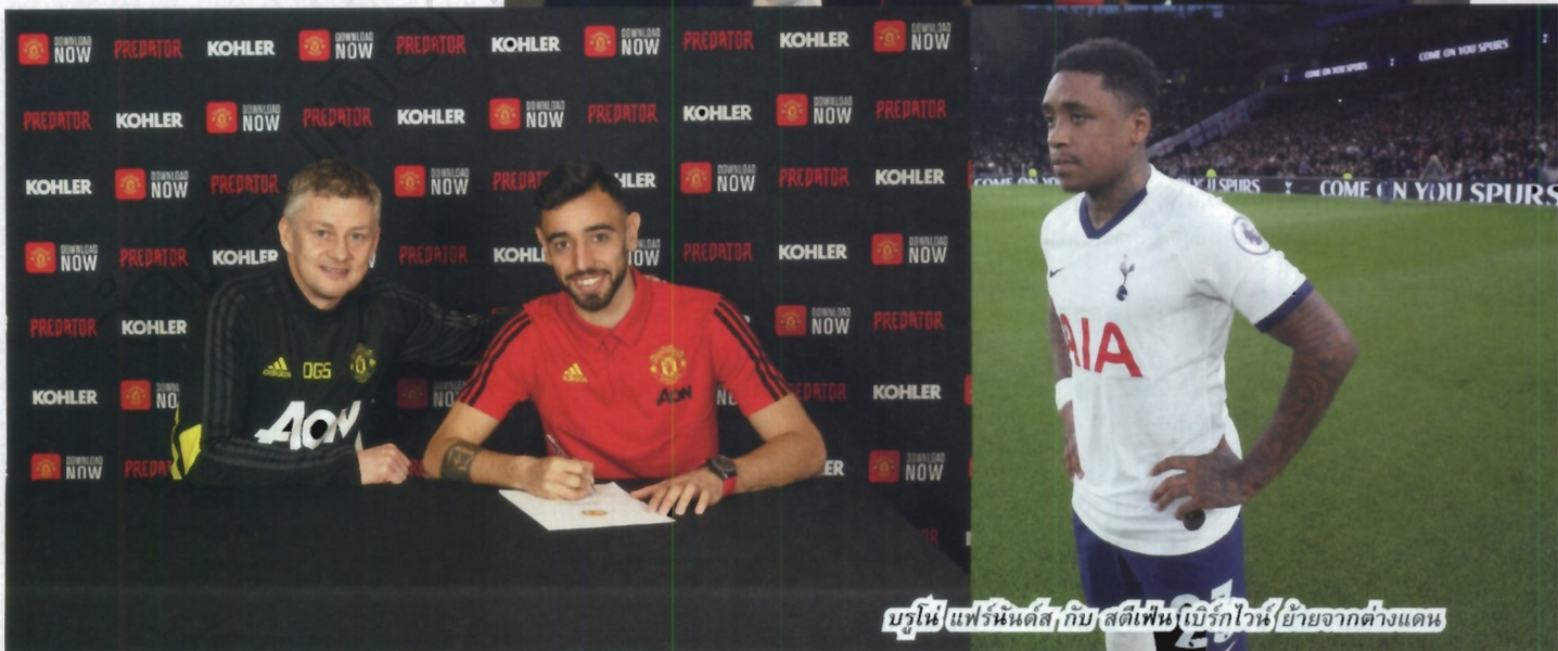
บรูโน่ แฟร์นันด์ส กับ สตีเฟ่น เบิร์กไวท์ ย้ายจากต่างแดน