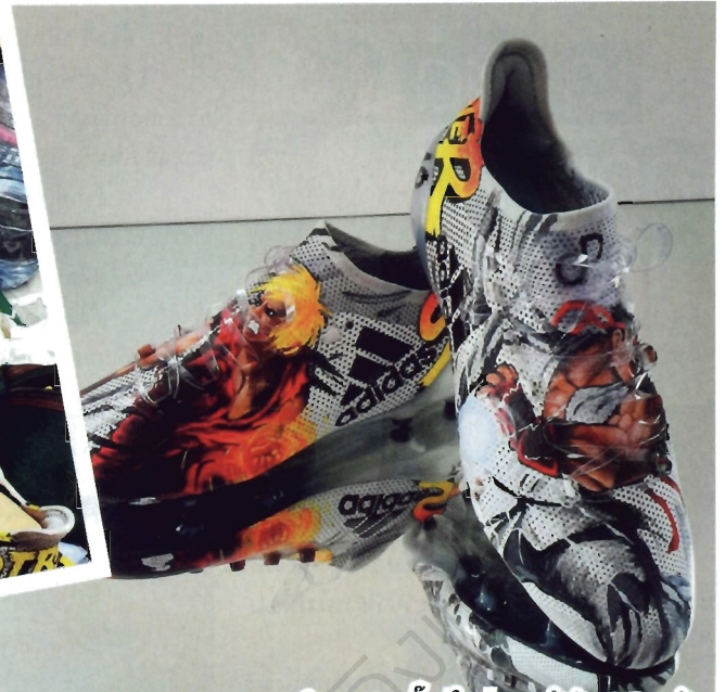
“ริว-เคน” สตั๊ดคู่มือของแข้งวัย 34 กระรัต

ลูคัส โปดอลสกี อดีตหัวหอกทีมชาติเยอรมนี ชุดแชมป์โลก 2014 ออกเดินทางบนถนนลูกหนังอีกครั้ง ด้วยการกลับไปตุรกี ชบ อันตัลยาสปอร์ หลังหมดสัญญากับ วิสเซล โกเบ ในเจลีก นี่เป็นการกลับมาสู่ฟุตบอลเดิร์กอีกครั้งของ “โพลดี” หลังจากเคยค้าแข้งกับ กาลาตาซาราย และเป็นที่รักของแฟนบอลเดิร์กมากมาย ทว่าการมาอยู่กับทีมท้ายตารางแทนที่จะเป็นยักษ์ใหญ่ของลีก ถือเป็นเรื่องที่แตกต่างกันออกไปอย่างสิ้นเชิง และมันคือส่วนหนึ่งในการค้าแข้งของเขา นับแต่ยุคแรกเลยทีเดียว