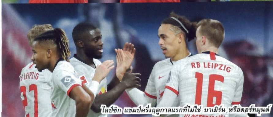
ไลป์ซิก แชมป์ครั้งแรกที่ไม่ใช่ บาเยิร์น หรือคอร์ทมนต์

เพียง 32 ปี ยังแรงเรื่องทำสถิติไม่แพ้ใครในทุก รายการ 12 นัดติด นับเป็นผลงานระดับสุดยอดของ ไลป์ซิกโดยแท้