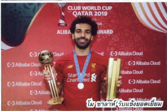
โมฮาล่าห์/รับรางวัลยอดเยี่ยม