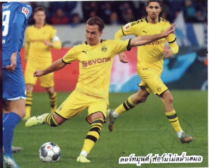
คอร์ทมนต์ ฟอร์มไม่สม่ำเสมอ