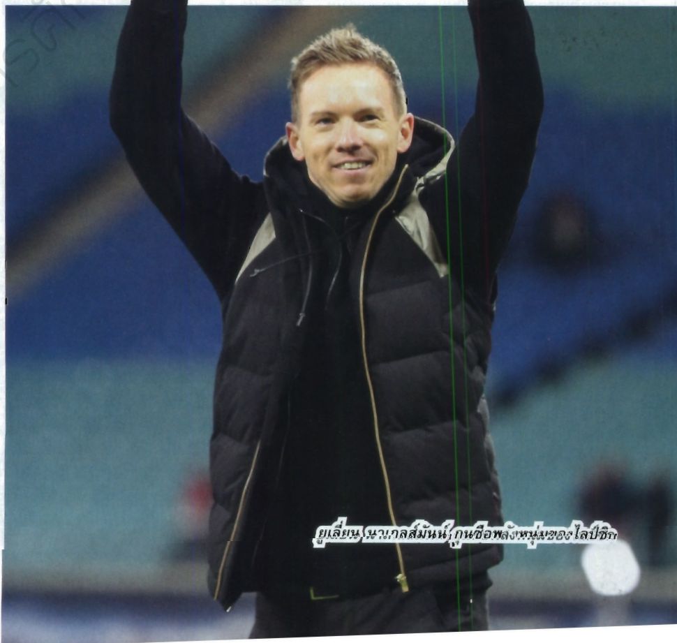
ยูเลียน นาเกิลส์มันน์ กุนซือพลังหนุ่มของไลป์ซิก