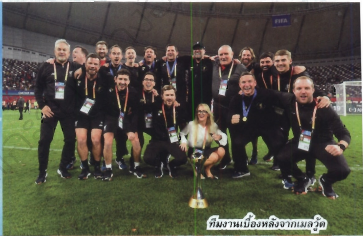
ทีมงานเบื้องหลังจากเมลเบิร์ด