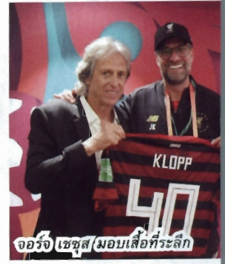
จอร์จ/เชอวส์/มอบเสื้อที่ระลึก