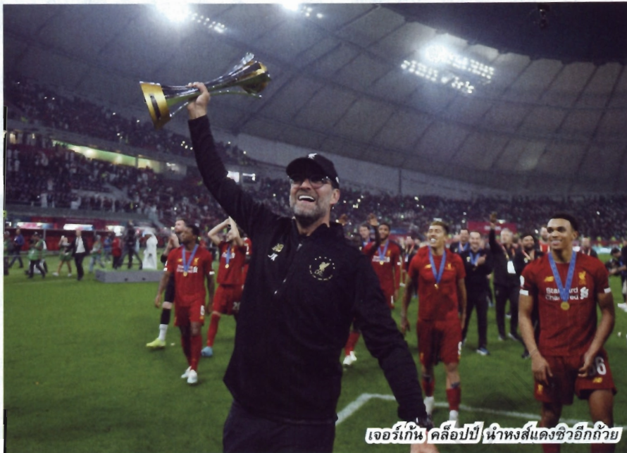
เจอร์เก็น/คล็อบบี้/นำธงสีแดงขวักถ้วย