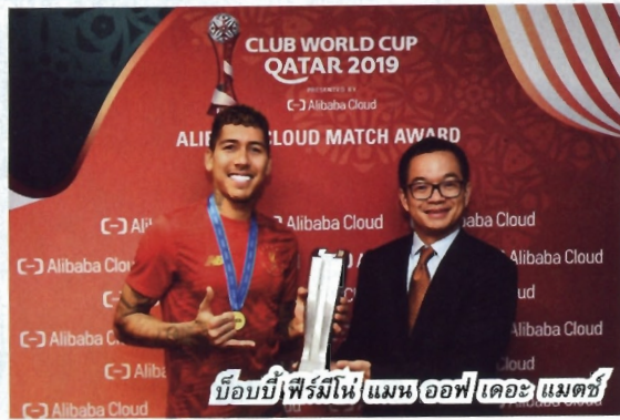
บ็อบบี้/ฟีร์มีโน่/แมนออฟเดอะแมตช์