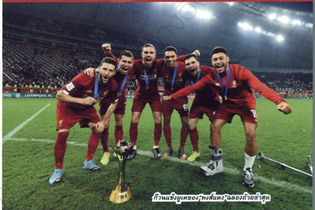
ก๊วนแข้งยูเคของ ‘หงส์แดง’ ฉลองถ้วยล่าสุด

“การได้เป็นแชมป์โลกคือเรื่องเหลือเชื่อมาก ๆ มันเป็นความรู้สึกที่พิเศษสุด การได้ติดตราแชมป์โลกในปีหน้าถือเป็นสิ่งสุดยอดจริงๆ” หัวหอก