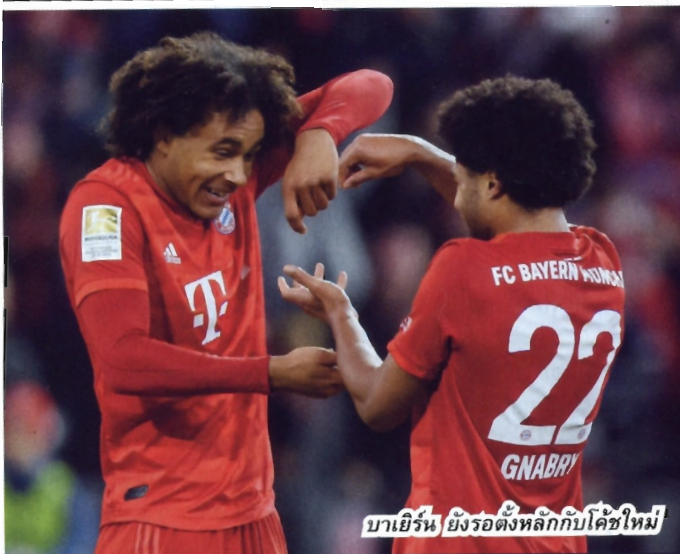
บาเยิร์น ยังรอดังหลักกับโค้ชใหม่