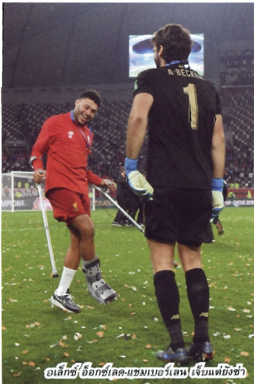
อเล็กซ์/อ็อกซ์เลด-แซมเบอร์เลน/จับมัตยั้งซ่า