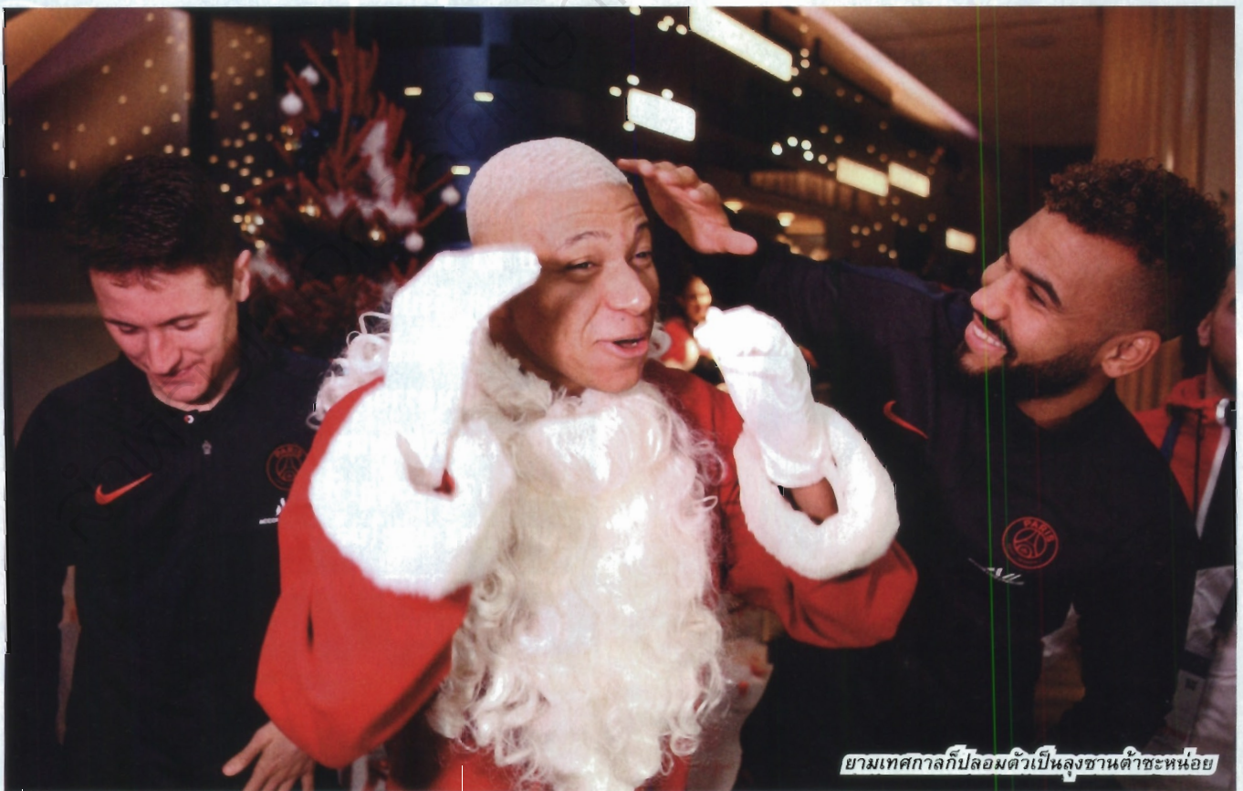
ยามเทศกาลก็ปลอมตัวเป็นลุงซานต้าซะหน่อย