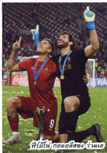
ฟีร์มีโน่/กอดคอสีทอง/ร่วมเย