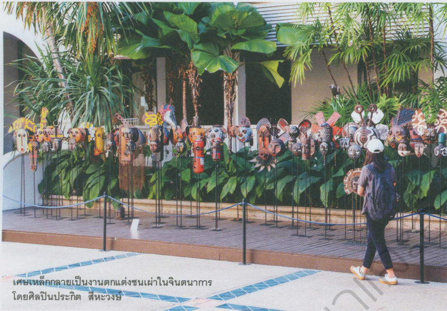
เศษเหล็กกลายเป็นงานตกแต่งชนเผ่าในจินตนาการ โดยศิลปินประภิต สีหะวงษ์