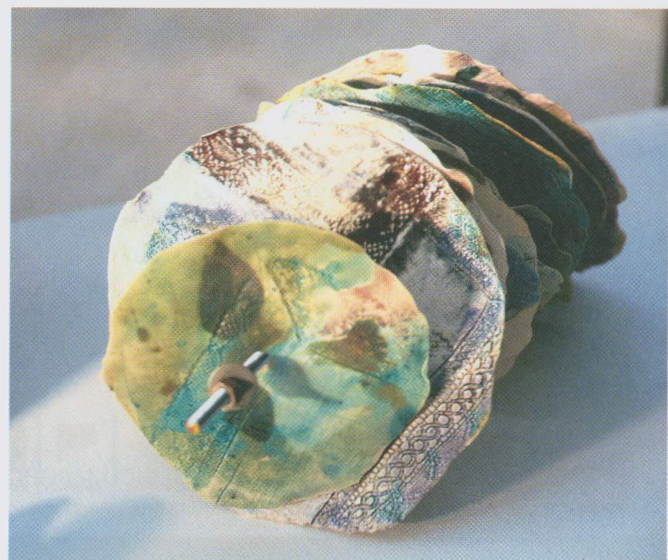
(ขวา) บางส่วนของผลงานในโครงการ Chiang Mai Claytivate ที่มีศิลปินเซรามิก 10 ชชาติมาทำงานร่วมกัน