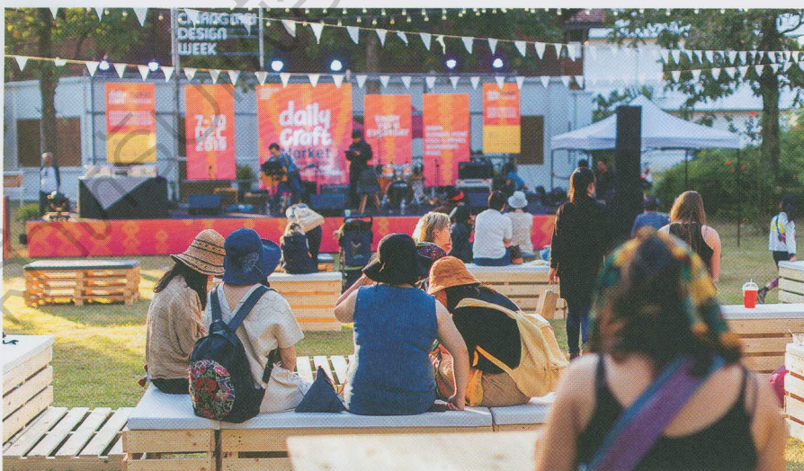
งานออกร้าน Daily Craft Market พร้อมลานกิจกรรมมีในวันที่ 7-10 ธันวาคม 2562 บริเวณโรงงานยาสูบ นอกจากนี้ยังมีงาน Pop Market ออกร้านอีกงานในวันที่ 12-15 ธันวาคม 2562 ที่ TCDC เชียงใหม่

นอกเหนือจากงานที่แสดงในโซนอนุสาวรีย์สามกษัตริย์แล้ว ยังมีงานต่างๆ กระจายอยู่รอบเมือง โดยมีการกระจายสาขาออกไปหลายรูปแบบ อาทิ งานแสดงดนตรี เวิร์คชอปด้านอาหาร งานสัมมนาเพื่อพัฒนาผู้ประกอบการ รวมไปถึงการออกร้านผลิตภัณฑ์กันไป เพื่อให้เมืองมีแรงขับเคลื่อนจากหลายๆ ทาง โดยแม้งานใหญ่ของเทศกาล Chiang Mai Design Week 2019 อย่าง TCDC เชียงใหม่ ได้ตั้งใจให้มีโครงการต่างๆ ต่อเนื่องเป็นระยะๆ ไม่ได้เฉพาะแค่งานปลายปีเท่านั้น ตามแผนงานเศรษฐกิจสร้างสรรค์ที่มีพื้นฐานจากงานหัตถกรรมอันรุ่งเรืองของเชียงใหม่