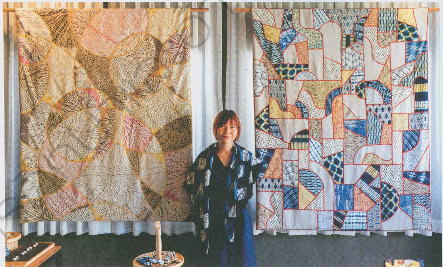
ผลงานชุดใหม่โชว์ในงาน Chiang Mai Design Week ด้วยเทคนิคมัดย้อมและแพตช์เวิร์คจาก slowstitch ร้านในโหล่งฮิมคาว อีกพื้นที่ที่แยกไปจากจุดแสดงหลักของงาน