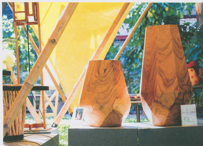
(บน) ท็อปโต๊ะจากงานต่อไม้ โดย Nakkid Design Studio

งานที่น่าสนใจอีกกลุ่มหนึ่งคืองานแสดงจากไต้หวันที่มีทั้งของชิ้นเล็กอย่างภาชนะต่างๆ ที่แสดงให้เห็นถึงแนวคิดในการผลิต ซึ่งพัฒนาขึ้นจากความร่วมมือของช่างฝีมือและนักออกแบบ และงานอีกส่วนที่ว่าด้วยเรื่องการผลิตงานกราฟฟิตี้ อย่างเครื่องจักสานจากวัตถุดิบท้องถิ่นให้กลายเป็นของใช้ในชีวิตประจำวัน ในชื่อนิทรรศการว่า Taiwan Daily Living Craft