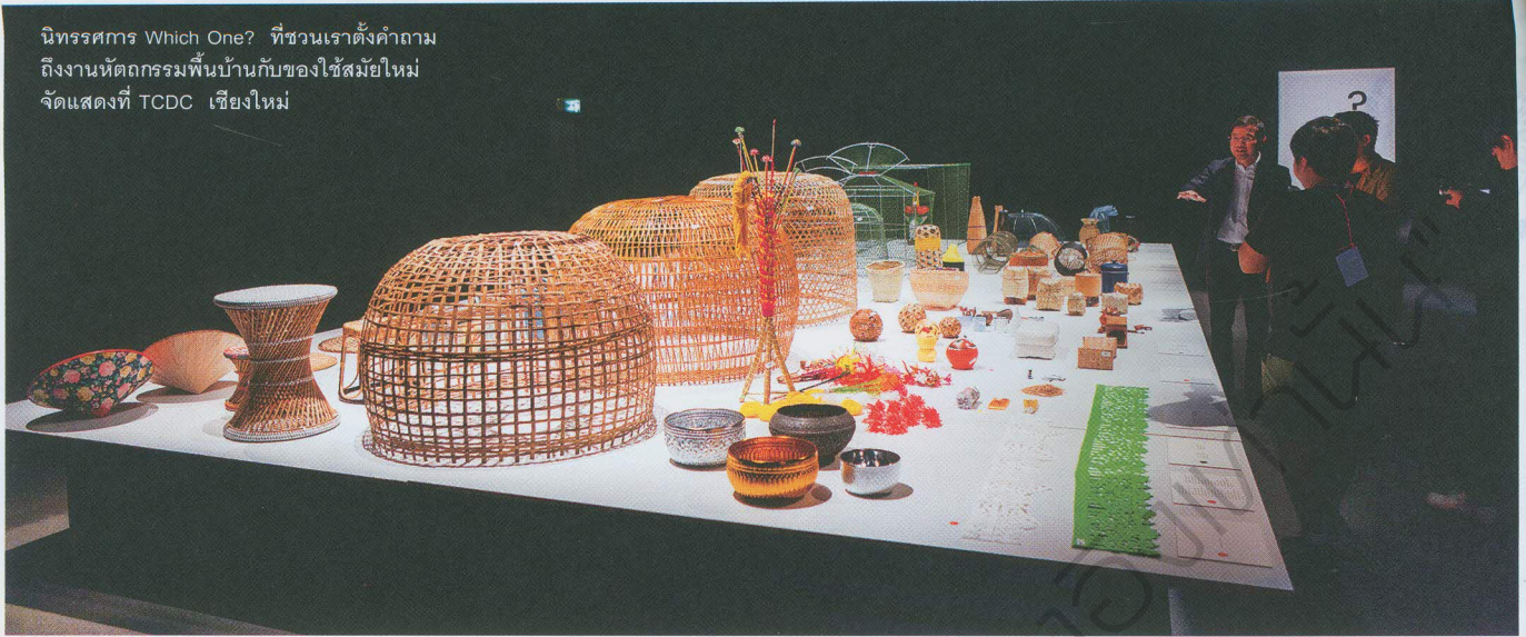
นิทรรศการ Which One? ที่ชวนเรารั้งคำถามถึงงานหัตถกรรมพื้นบ้านกับของใช้สมัยใหม่ จัดแสดงที่ TCDC เชียงใหม่