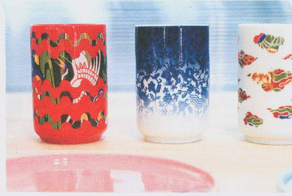
(ซ้าย) นิทรรศการ Taiwan Daily Living Craft ว่าด้วยการทำความเข้าใจกับเทคนิคและวัสดุพื้นถิ่นของไต้หวัน