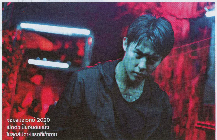
จอมขมังเวทย์ 2020 เปิดตัวเป็นอันดับหนึ่งในสัปดาห์แรกที่เข้าฉาย

ส่วนอันดับหนึ่งของสัปดาห์ก่อนหน้า Frozen II ที่เป็นทางด้านของหนังไทยภาคต่อ ขยายความเป็นแอ็กชันดราม่าแฟนตาซี จอมขมังเวทย์ 2020 ถึงหนังจะเปิดตัวมาเป็นที่หนึ่งด้วยรายรับที่เบียดๆ กันมากกับ Gemini Man หนังแอ็กชันดราม่าไซไฟเรื่องใหม่ของวิล์ด สมิธ แต่ตัวเลขก็ออกมาในระดับกลางๆ จนแทบจะพันๆ ไม่ได้เป็นรายรับที่ปังอะไร