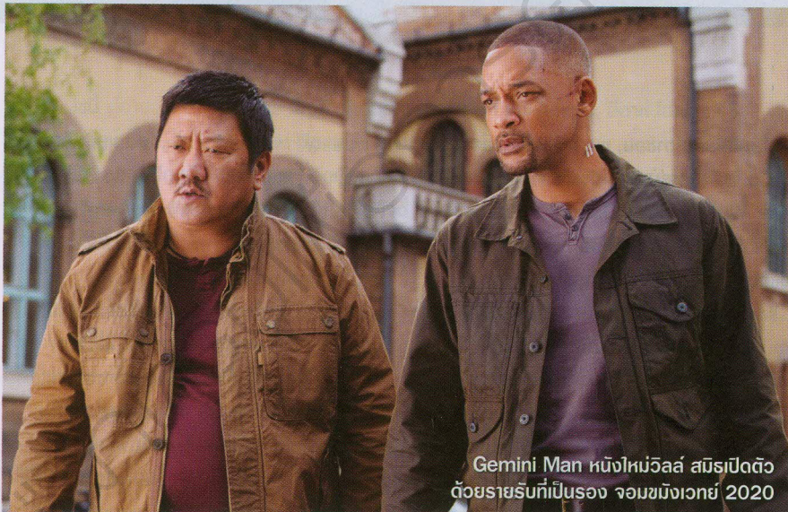
Gemini Man หนึ่งปีมีวีแอล สมิธเปิดตัวด้วยรายรับที่เบีรสอง จอมขมังเวทย์ 2020

รายรับที่ตามหลัง Frozen II สุดลูกหูลูกตา มีหน้าซ้ำ จอมขมังเวทย์ 2020 ยังขนาบข้างมากในอันดับสามด้วยรายรับที่ต่างกันแค่ล้านกว่าๆ ขณะที่หนังจีนแอ็กชันกำลังภายในโรแมนติคแฟนตาซีที่ดอดมาเจียบๆ อย่าง Jade Dynasty เอาจริงๆ จะถือเป็นความเซอร์ไพรส์เล็กๆ ที่น่าจะได้ เพราะนานขนาดไหนแล้วที่ไม่ได้เห็น