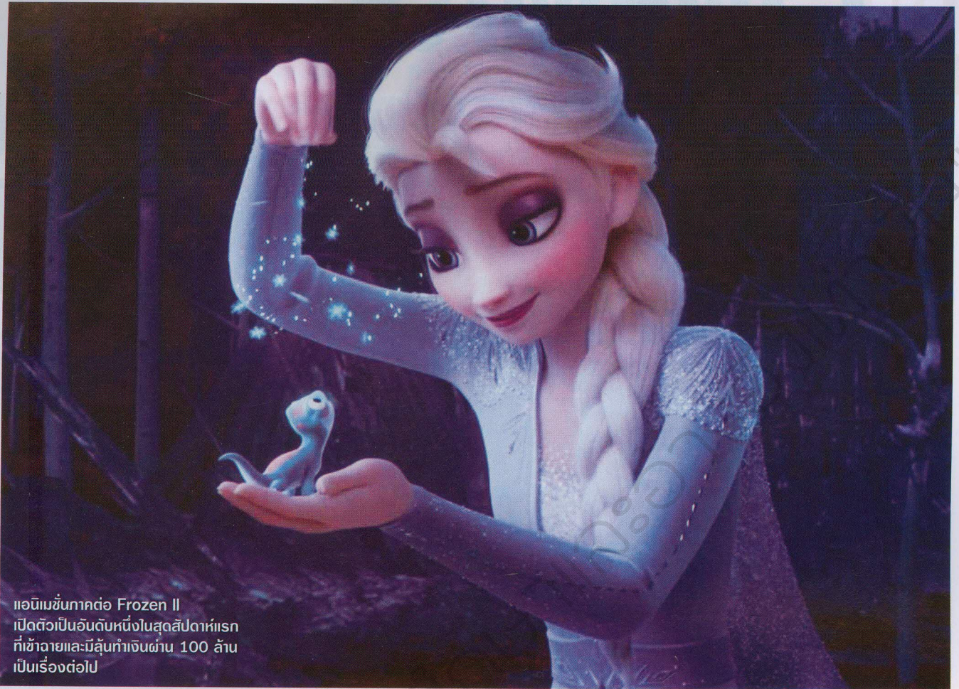
แอนิเมชันภาคต่อ Frozen II เปิดตัวเป็นอันดับหนึ่งในสุดสัปดาห์แรกที่เข้าฉายและมีลุ้นทำเงินผ่าน 100 ล้านเป็นเรื่องต่อไป