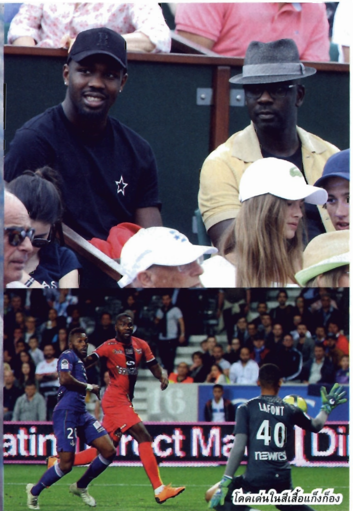
โดดเด่นในสีเสื้อแก๊งก๊อง