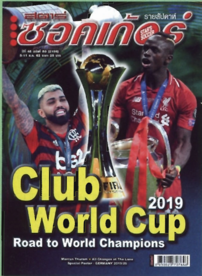
ภาพปก - ฟุตบอล คลับ เวิลด์ คัพ 2019