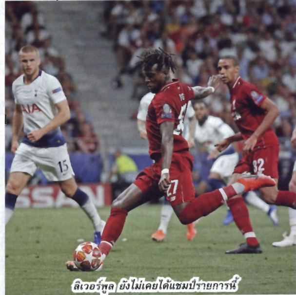
ลิเวอร์พูล ยังไม่เคยได้แชมป์รายการนี้

โอกาสจะสร้างประวัติศาสตร์หน้าใหม่ให้กับสโมสรอีกครั้ง