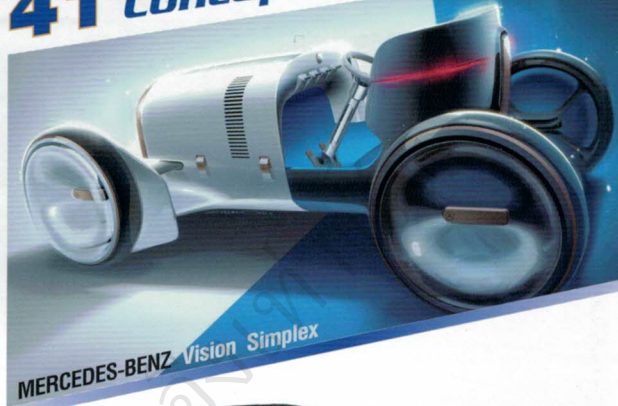
MERCEDES-BENZ Vision Simplex