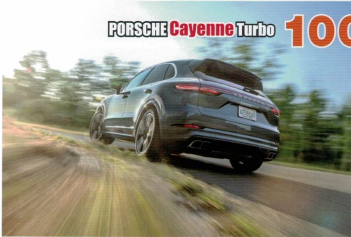
PORSCHE Cayenne Turbo 100

81 อันทหาเรื่อง @ ยานยนต์ รู้จำอันตรายแต่ไม่มีทางเลือก