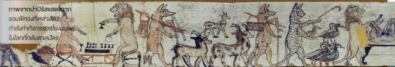
ภาพจากปาปิริสแสดงฉากชวนพิศวงที่เหล่าสัตว์กำลังทำกิจกรรมเหมือนมนุษย์ในโลกที่กลับตาลปัตร

ถึงแม้ว่าภาพศิลปะของชาวอียิปต์โบราณที่เราคุ้นตากันดีจะเป็นภาพที่แสดงออกแบบแข็งๆ มีระเบียบแบบแผนที่ชัดเจน ไร้ซึ่งอารมณ์ใดๆ แต่ก็ต้องบอกว่ามโนคติในการนำเสนอทางงานศิลปะของชาวอียิปต์โบราณจะเป็นจริงตามนั้นเพียงแค่งานที่ “เป็นทางการ” อย่างเช่นภาพสลักบนผนังวิหารหรือสุสานขององค์ฟาโรห์เท่านั้นล่ะครับ นักอียิปต์วิทยาพบว่าภาพ “วาดเล่น” และภาพศิลปะที่ “ผิดขนบ” นั้นมีปรากฏให้เห็นมากมาย และภาพที่นำมาเสนอในครั้งนี้ก็คือนึ่งในภาพที่ผิดแผกแปลกออกไปจากขนบธรรมเนียมการนำเสนอทางศิลปะของชาวอียิปต์โบราณอยู่ไม่น้อย เพราะเป็นภาพของเหล่า “สัตว์” ที่กำลังทำกิจกรรมของมนุษย์ในโลกอันแสนกลับตาลปัตร และนักอียิปต์วิทยาที่เรียกงานปาปิริสเหล่านี้ว่า “ปาปิริสเสียดสี” (Satirical Papyrus) นั่นเองครับ