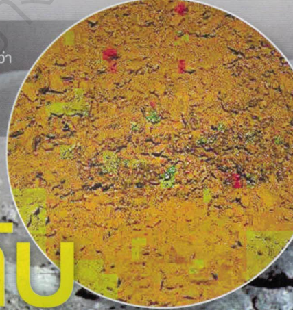
ภาพถ่ายจากยานสำรวจอวี่กู่ ๒ ที่สื่อของจีนเสนอว่ามีลักษณะคล้าย “เจล” แต่แท้ที่จริงแล้วเป็นเพียงอิมแพกไทต์

นั่นหมายความว่าแท้ที่จริงแล้วเรื่องเจลลึกลับบนพื้นผิวของดวงจันทร์นี้ก็ “ไม่ได้มีอะไรในกอไผ่” หรอกครับ นอกจากการค้นพบหลักฐานของหินแก้วอิมแพกไทต์ในแองก์อุกกาบาตบนพื้นผิวด้านไกลของดวงจันทร์ก็เท่านั้นเอง ถึงแม้ว่าหินแก้วเหล่านี้จะไม่ได้แสดงให้เห็นถึงวัตถุพิศวงชนิดที่ปรากฏอยู่บนพื้นผิวดวงจันทร์ของโลกดวงนี้ แต่มันก็เป็นหนึ่งในข้อมูลที่ช่วยให้นักดาราศาสตร์ได้เข้าใจถึงต้นกำเนิดและวิวัฒนาการของดวงจันทร์ได้ดีขึ้นอีกไม่น้อยเลยล่ะครับ