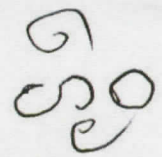
บุญศิริรภา จุจากรทรัพย์ ศิลปินกรม