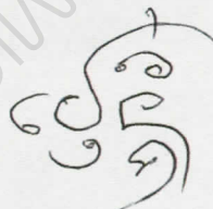
เอกวิวัฒน์ ทองกำ วิดีโอครีเอเตอร์