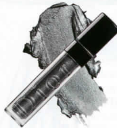
Diorshow Liquid Mono ลิตควิดอายแชโดว์ผสม กลิตเตอร์ (1,350 บาท) จาก DIOR