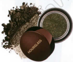
Scattered Light Glitter Eyeshadow อายแชโดว์ เนื้อกลิตเตอร์ละเอียด (1,200 บาท) จาก HOURGLASS