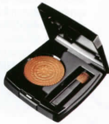
Exclusive Creation Ombre Première อายแชโดว์สีทองเนื้อ แวววาว (ประมาณ 1,500 บาท) จาก CHANEL