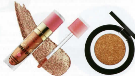
Crystal Whips Long-Wearing Shimmering Eye Shadow Veil อายแชโดว์เนื้อครีม (850 บาท) จาก TOO FACED