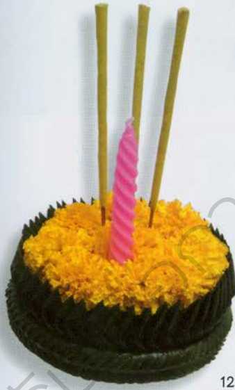
7-9. ประดับดอกดาวเรืองด้านในของกระทง 10-11. ปักธูปเทียนลงในกระทง 12. ภาพชิ้นงานสำเร็จ