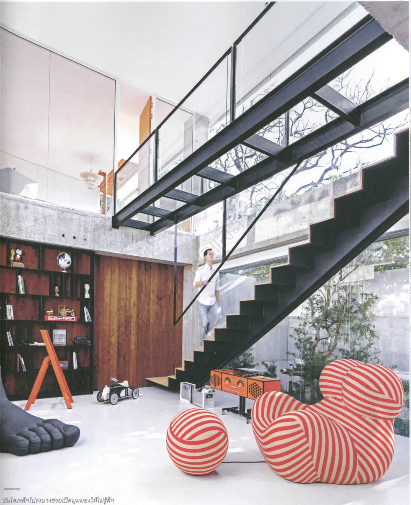
บ้านได้เหล็กโปร่งบางช่วยเปิดมุมมองให้ไม่รู้สึก อึดอัด ประกอบกับผนังกระจกยังช่วยเปิดรับ ทิวทัศน์รอบๆ และแสงจากภายนอกได้อย่างดี