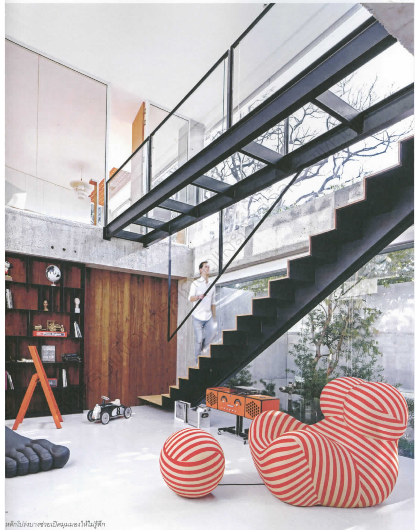
เหล็กโปร่งบางช่วยเปิดมุมมองให้ไม่รู้สึกร ประกอบกับผนังกระจกยังช่วยเปิดรับ น้รอบๆ และแสงจากภายนอกได้อย่างดี