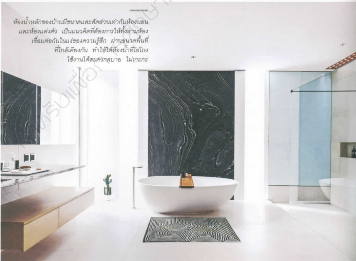
ห้องน้ำหลักของบ้านมีขนาดและสัดส่วนเท่ากับห้องนอน และห้องแต่งตัว เป็นแนวคิดที่ต้องการให้ทั้งสามห้องเชื่อมต่อกันในแง่ของความรู้สึก ผ่านขนาดพื้นที่ที่ใกล้เคียงกัน ทำให้ได้ห้องน้ำที่โอเอียงใช้งานได้สะดวกสบาย ไม่เกะกะ