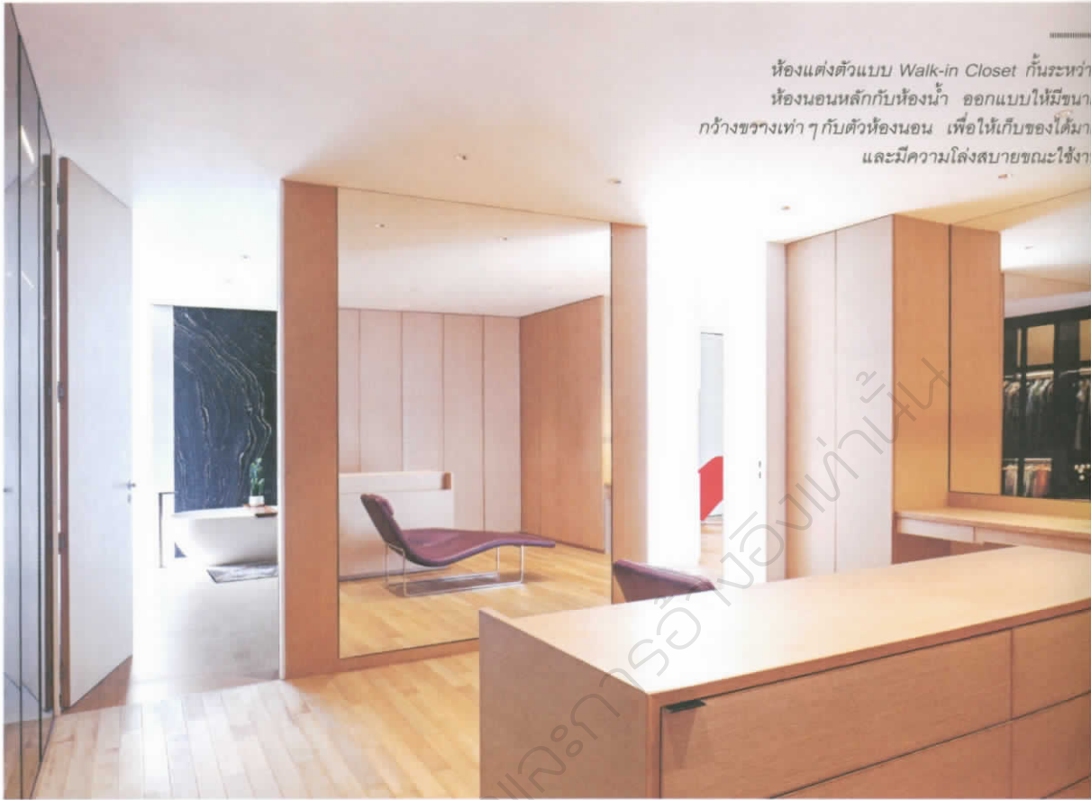
ห้องแต่งตัวแบบ Walk-in Closet กั้นระหว่างห้องนอนหลักกับห้องน้ำ ออกแบบให้มีขนาดกว้างขวางเท่าๆ กับตัวห้องนอน เพื่อให้เก็บของได้มาก และมีความโล่งสบายขณะใช้งาน