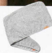
Waffle Luxe Turban ผ้าเส้นใย พิเศษช่วยดูดซับน้ำ หลังสระ (1,531 บาท) จาก AQUIS