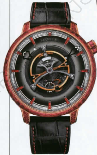
นาฬิกา รุ่น 'Insight Micro-Rotor' ตัวเรือนไวต์โกลด์ หน้าปัดลงยา สีน้เงินสด เม็ดมะยมที่ตำแหน่ง 2 นาฬิกา จาก ROMAIN GAUTHIER

นาฬิกา รุ่น 'Maximus Royal' ตระการตาด้วยอัญมณีและกลไกทูร์บิญองขนาดใหญ่ จาก KERBEDANZ