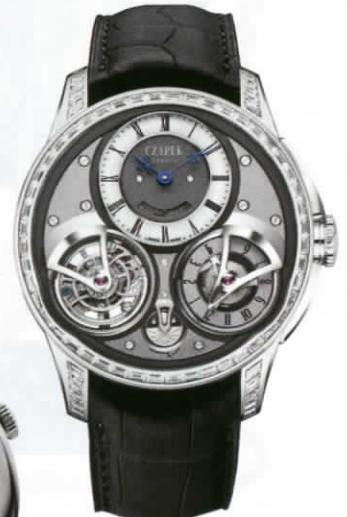
นาฬิกา รุ่น 'Place Vendôme Etincelles' ตัวเรือนแพลทินัมล้อมเพชร พร้อมฟังก์ชันทูร์บิญองและ GMT จาก CZAPEK