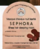
Hair Sleeping Mask มาสก์ฟื้นฟูเส้นผม ในยามหลับ (190 บาท) จาก SEPHORA