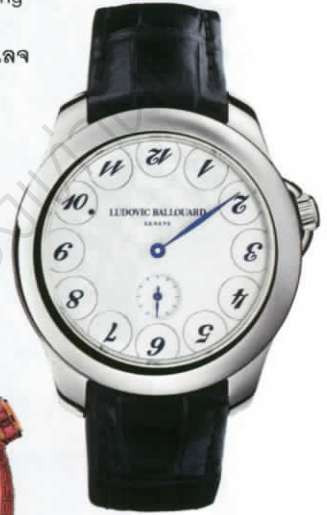
นาฬิกา รุ่น 'Ballouard Upside Down' ตัวเรือนแพลทินัม แปลกตา ด้วยตัวเลขกลับหัว จาก LUDOVIC

พบกับบางส่วนของเรือนเวลาดีไซน์สวยแปลกตา จากเหล่าสุดยอดแบรนด์นาฬิกาอินดิเพนเดนต์ ระดับโลกที่มาจัดแสดงภายในงาน 'Bangkok Independent Watchmaking Exhibition 2019' ที่ ห้างสรรพสินค้าเกษรวิลเลจ ■ V.B.