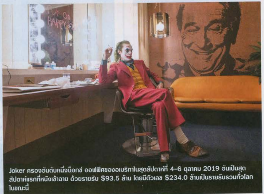
Joker ครองอันดับหนึ่งบ็อกซ์ ออฟฟิศของอเมริกาในสัปดาห์ที่ 4-6 ตุลาคม 2019 อันเป็นสัปดาห์แรกที่หนังเข้าฉาย ด้วยรายรับ $93.5 ล้าน โดยมีตัวเลข $234.0 ล้านเป็นรายรับรวมทั้งโลกในขณะนี้