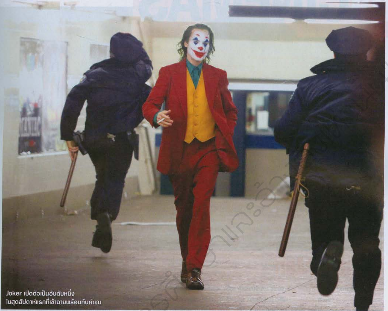
Joker เปิดตัวเป็นอันดับหนึ่ง ในสุดสัปดาห์แรกที่เข้าฉายพร้อมกับคำชม