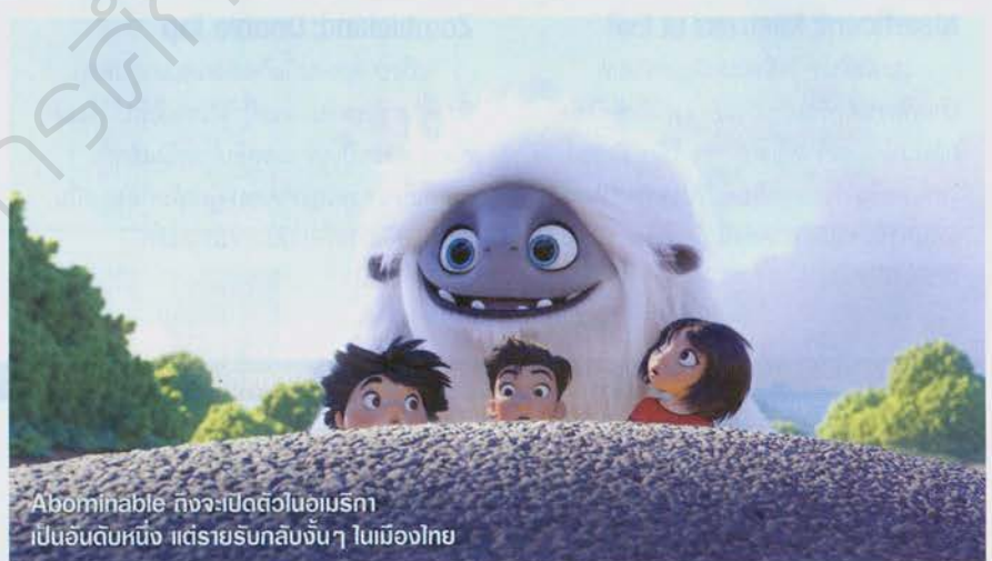
Abominable ก็จะไปเปิดตัวในอเมริกาเป็นอันดับหนึ่ง แต่รายรับกลับงั้นๆ ในเมืองไทย

ก็ได้เวลาของวายร้ายใจเกินร้อยที่จะเข้ามาสร้างความเคลื่อนไหวในมืออีก ออฟฟิศ กับหนังดราม่าทริลเลอร์อาชญากรรม Joker ที่เปิดตัวด้วยรายรับเกินกว่า 50 ล้านในบ้านเรา ซึ่งก็ต้องถือว่าไม่ธรรมดา เมื่อพิจารณาว่าหนังมีสัดส่วนความเป็นดราม่านำหน้าอารมณ์โหดๆ แลมรายรับเปิดตัวประมาณนี้ก็อาจจะส่งผลให้หนังมีลุ้นทำเงินผ่าน 100 ล้านเป็นเรื่องต่อไปได้เลยทีเดียว เพราะโหนดจะแรงหนุนจากกระแสปากต่อปากที่เริ่มเสียงดังฟังชัดมาตั้งแต่วันแรกที่เข้าฉาย แล้วก็