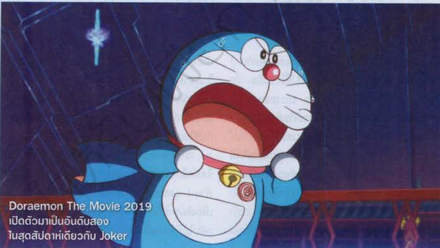
Doraemon The Movie 2019 เปิดตัวมาเป็นอันดับสอง ในสุดสัปดาห์เดียวกับ Joker

ซึ่งที่สื่อที่ตามหลัง Joker มาห่างๆ มาก ก็เป็นทางด้านของหนังการ์ตูนญี่ปุ่นอีกแล้ว Doraemon The Movie 2019 ตอนล่าสุดของหนังการ์ตูนดังจากญี่ปุ่นอีกเรื่องที่มีให้ดูกันทุกปี ซึ่งเปิดตัวด้วยรายรับประมาณนี้แหละ 5-6 ล้านสำหรับการ์ตูนโดราเอมอนแต่ละตอนที่เข้ามาฉายบ้านเราในช่วง