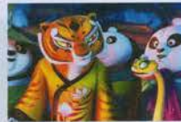
3. Kung Fu Panda 3 (2016) $521.2 ล้าน ($143.5 ล้าน, $377.6 ล้าน)