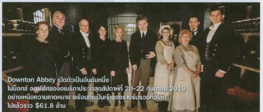
Downton Abbey เปิดตัวเป็นอันดับหนึ่งในบ็อกซ์ ออฟฟิศของอเมริกาประจำสัปดาห์ที่ 20-22 กันยายน 2019 อย่างเหนือความคาดหมาย พร้อมทั้งเป็นเจ้าขี้อายรายรับรวมทั่วโลกไปแล้วราว $61.8 ล้าน

โดยรายรับรวมของ It ในภาคนี้ ซึ่งล่าสุดทำเงินในอเมริกาไปแล้วที่ราว $179.2 ล้าน เมื่อเข้าสู่สัปดาห์ที่สามของการเข้าฉาย ขณะที่รายรับรวมทั่วโลกที่ในตอนนี้อยู่ที่ $358.9 ล้านโดยประมาณ ก็ยังคงเป็นตัวเลขที่ตามหลัง It ภาคที่แล้วเมื่อสองปีก่อนอยู่พอสมควร ซึ่งทำเงินในอเมริกาไปตลอดทั้งโปรแกรม $327.5 ล้านโดยประมาณ และมีตัวเลขราว $700.4 ล้าน