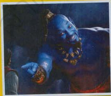
1. Aladdin (ปีที่เปิดตัว 2019) รายรับรวมทั่วโลก $1,046.7 ล้าน* (ในอเมริกา $354.9 ล้าน*, นอกอเมริกา $691.8 ล้าน*)

นำชายของหนัง Gemini Man ไม่ใช่ใครที่เหิน เป็นทางด้านของวิลล์ สมิธนักแสดงผิวสีแถวหน้าวัย 51 ที่ร่วมงานกับผู้กำกับอั้ง ลีในหนังเรื่องนี้ หลังจากที่เขาเพิ่งรับบทเจ้าชายจีนี่ในหนัง Aladdin เวอร์ชันใช้ผู้แสดงจริงที่เข้าฉายในอเมริกาไปเมื่อ 24 พฤษภาคม 2019 ที่ผ่านมาเอง แต่ก่อนหน้าทีผลงานล่าสุด Gemini Man จะเปิดตัวในอเมริกาเป็นเรื่องถัดมา นี่คืออภิญญาแต่ละสุด Top 5 หนังสืลล์ สมิธที่ทำรายรับรวมทั่วโลกสูงสุดในช่วงระหว่างปี 2009-2019