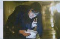
4. Salt (2010) $293.5 ล้าน ($118.3 ล้าน, $175.2 ล้าน)