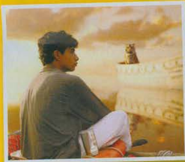
1. Life of Pi (ปีที่เปิดตัว 2012) รายรับรวมทั่วโลก $609.0 ล้าน (ในอเมริกา $125.0 ล้าน, นอกอเมริกา $484.0 ล้าน)

กำลังจะมีงานกำกับเรื่องใหม่เตรียมเปิดตัวในอเมริกา 11 ตุลาคม 2019 นี้ สำหรับผู้กำกับชาวไต้หวันวัย 65 อั้ง ลีที่กลับมาพร้อมผลงานแอ็กชันดราม่าไซไฟเรื่อง Gemini Man แต่ก่อนที่ผลงานล่าสุดจะเข้าฉาย นี่คือ Top 5 งานกำกับที่ผ่านมายของอั้ง ลี ทำรายรับรวมทั่วโลกสูงสุด