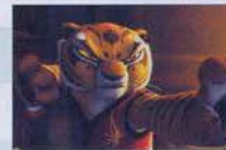
2. Kung Fu Panda 2 (2011) $665.7 ล้าน ($165.2 ล้าน, $500.4 ล้าน)