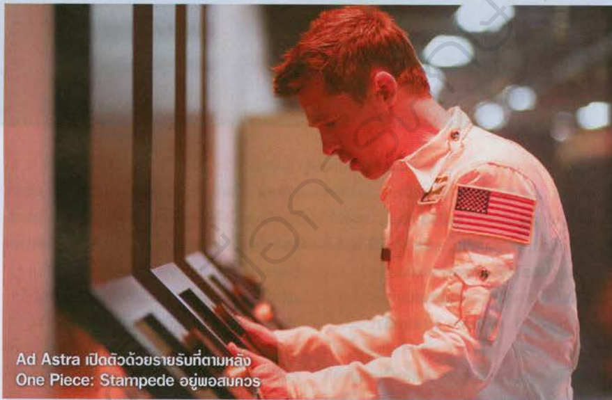
Ad Astra เปิดตัวด้วยรายรับที่ตามหลัง One Piece: Stampede อยู่พอสมควร

ทางด้านของไทย มิสเตอร์ดี้อ่า ที่ดูท่าจะกลายเป็นมิสเตอร์ "ดี้อ" ไปเลยก็ไมรู้ ซึ่งน่าจะเป็นความล้มเหลวในทุกทางที่เริ่มต้นตั้งแต่ตัวหนังเองที่ไม่ได้สนุกอย่างที่คิดจนยังคงมาถึงรายได้ของหนังที่ไม่ได้มีกระแสปากต่อปากมาเป็นแรงหนุนแต่อย่างใด ทีนี้ทะเลืออะไรหนังก็จำต้องตกอยู่ในสถานการณ์ได้เท่าไรก็เท่านั้นไปโดยปริยาย กลายเป็นผลงานที่เสียของอีกเรื่องหนึ่ง ทั้งที่น่าจะมีศักยภาพในการเรียกแขกได้มากกว่านี้