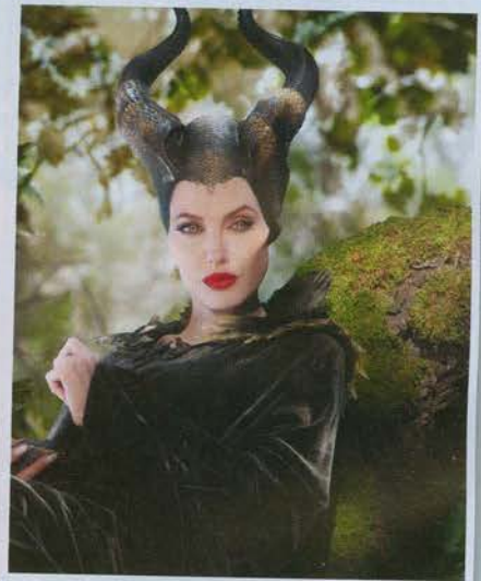
1. Maleficent (ปีที่เปิดตัว 2014) รายรับรวมทั่วโลก $758.5 ล้าน (ในอเมริกา $241.4 ล้าน, นอกอเมริกา $517.1 ล้าน)

แอนเจลิน่า โจลี่ นักแสดงหญิงวัย 44 เป็นอภิญญาที่กำลังจะมีผลงานใหม่เปิดตัวในอเมริกา 18 ตุลาคม 2019 นี้ กับการหวนกลับมารับบทมาเลฟิซันต์ในหนังผจญภัยแฟนตาซีภาคต่อ Maleficent: Mistress of Evil ที่ทิ้งช่วงจากภาคแรกมา 5 ปี แต่ก่อนที่ผลงานล่าสุดจะเข้าฉาย นี่คือ Top 5 หนังสืลล์ นิก โจนส์ที่ทำรายรับรวมทั่วโลกสูงสุดในช่วงระหว่างปี 2009-2019