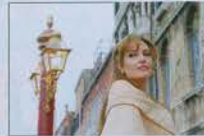
5. The Tourist (2010) $278.3 ล้าน ($67.6 ล้าน, $210.7 ล้าน)