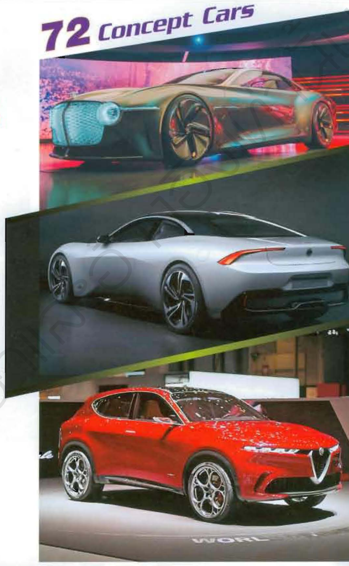
72 Concept Cars