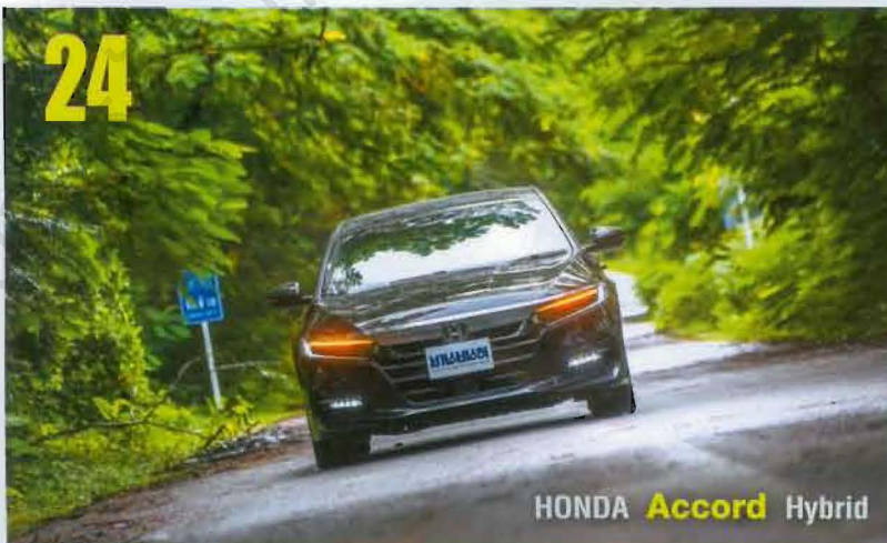
HONDA Accord Hybrid