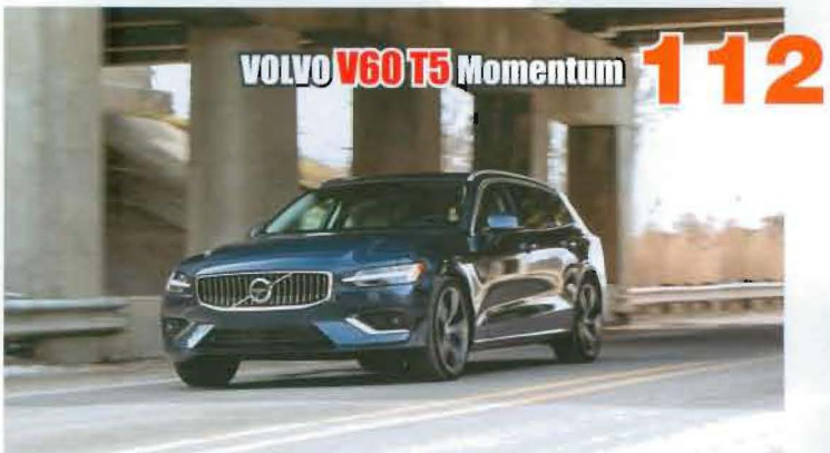
VOLVO V60 T5 Momentum 112