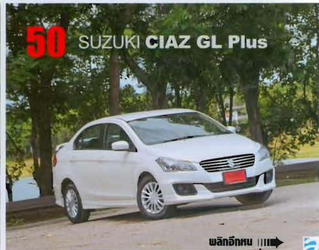
50 SUZUKI CIAZ GL Plus