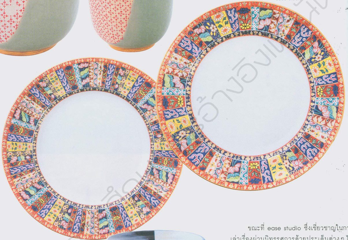
นักออกแบบจาก ease studio ที่ปรึกษาผู้ประกอบการ โครงการ SACICT Signature Collection 2019

12 ลายดั้งเดิมของเบญจรงค์ ที่วางองค์ประกอบใหม่ในงาน ใบเดียว จากอุไรเบญจรงค์ แห่งดอนไก่ดี ทำงานร่วมกับ ease studio