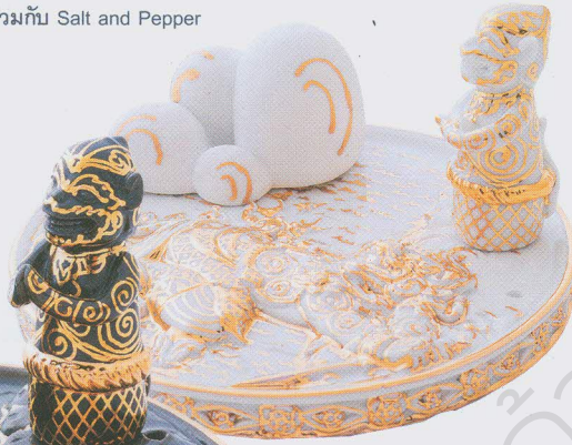
ถาดจตุรปูหอมผสมเทคนิค การปั้นประติมากรรม จากเบญจรงค์มงคลศิลป์ ทำงานร่วมกับ Salt and Pepper