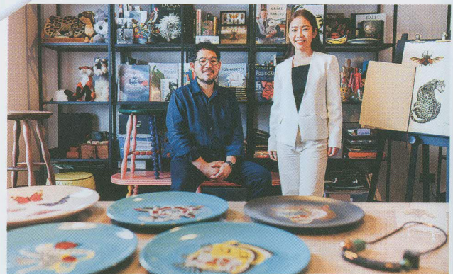
นักออกแบบจาก Salt and Pepper ที่ปรึกษาผู้ประกอบการในโครงการเบญจรงค์

“สิ่งที่เราทำคือการผลักดันให้เขาได้ไปต่อจากสิ่งที่เขาเคยทำ มากกว่าการที่ไปผืนการทำงานของแต่ละผู้ประกอบการ หรือแม้กระทั่งการฝันบางครั้งก็ไม่ใช่เขาว่าฝัน อันนี้จะเป็นประสบการณ์ของนักออกแบบหลาย ๆ คนที่ทำงานพัฒนาผลิตภัณฑ์ชุมชนจะต้องเข้าใจว่าการทำงานกับผู้ประกอบการเป็นอย่างไร ยิ่งเป็นผู้ประกอบการที่ดัดกรรม เขาจะคล้าย ๆ กับศิลปินที่บ้าน ต้องเข้าใจตรงนี้ด้วย ส่วนในรายละเอียดของผู้ประกอบการแต่ละคนก็แตกต่างกันโดยสิ้นเชิง เพราะแต่ละคนมีที่มา ความพร้อม และวัตถุประสงค์แตกต่างกัน แม้กระทั่งบุคลิกภาพนิสัยทัศนคติ”