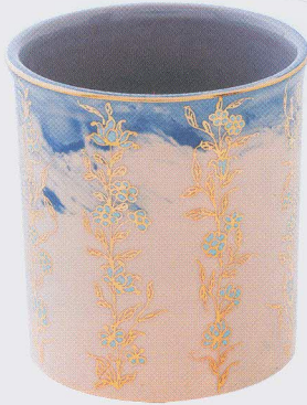
ผลงานแก้วเบญจรงค์ ที่เพิ่มเติมเทคนิคในการขึ้นรูป เครื่องเซรามิกเป็นสียดินแบบผสม จากเบญจรงค์ทองโพธิ์พระยา ทำงานร่วมกับ Salt and Pepper